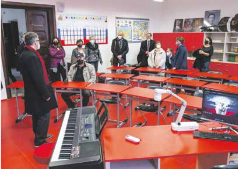
Studenti mají nové učebny díky finanční podpoře Olomouckého kraje a Evropské unie.