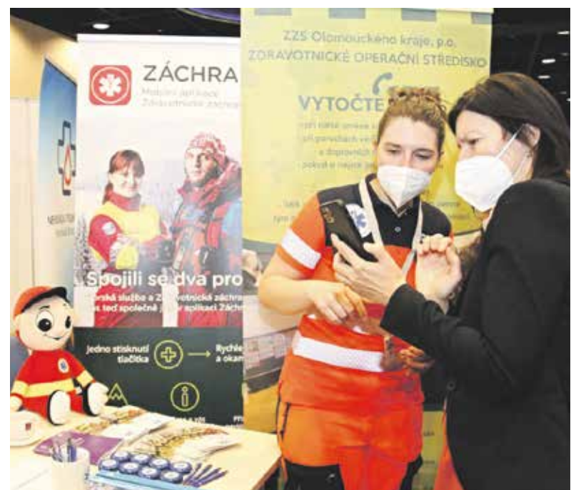
Letos se na veletrhu prezentovalo celkem 42 zdravotnických zařízení a poskytovatelů zdravotní péče z Česka i Slovenska.

Veletrh práce ve zdravotnictví patří mezi největší akce svého druhu v České republice. Mezi studenty medicíny ale i středních a vyšších odborných škol hledali zdravotnické i nezdravotnické pracovníky. „To hlavní, co chceme studentům předat, je,