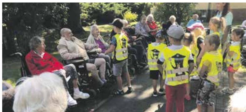
Setkání dětí a seniorů v Domově seniorů Pohoda v Olomouci.

Děti, babičky a dědečkové mají možnost se poznat a najít si k sobě vzájemnou cestu. Setkání probíhají formou výtvarných nebo kreativních činností, hraní her, sportovních aktivit, výletů nebo čtení seniorů ve školkách. Jde o společné objevování, poznávání, obohacování a hledání porozumění a vzájemné úcty mezi generacemi.