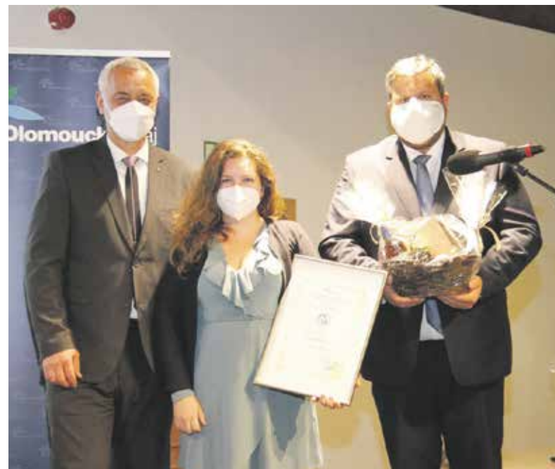
Ocenění za společenskou odpovědnost převzali vítězové v olomoucké Pevnosti poznání.

„Společenská odpovědnost je termín, který se stále častěji dere do popředí. Co přesně znamená? Obsahuje vše, co dlouhodobě prospívá společnosti