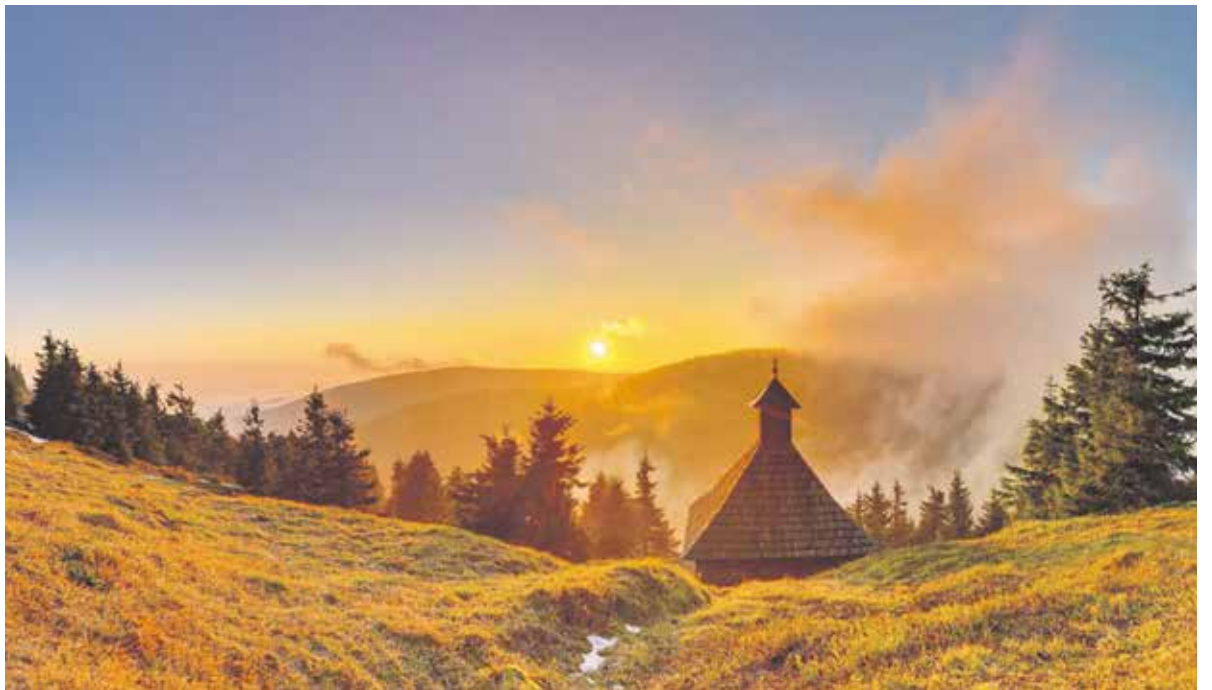
I přes epidemiologická opatření si krásy našeho kraje přijelo užít čtvrt milionu lidí.

Rekordní turistickou sezónu hlásí letos Olomoucký kraj. Region navštívilo nejvíce hostů za posledních deset let. Skvělý výsledek se projevil především o letních prázdninách.