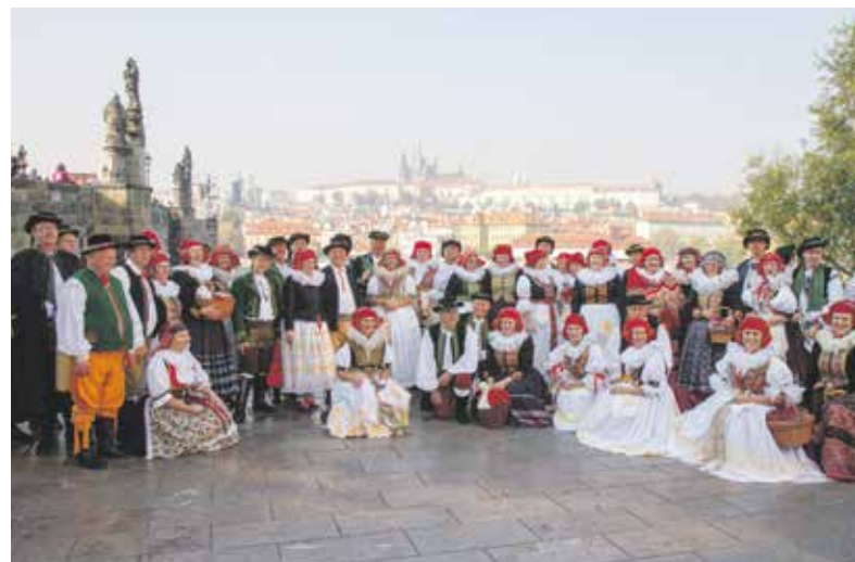
Průvod Hanáků Prahou v roce 2018.