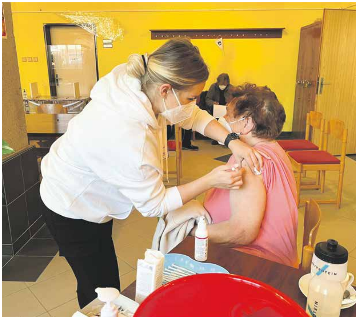
Mobilní očkovací týmy vyrazí především do odlehlých částí kraje, odkud by lidé komplikovaně dojezdili do očkovacích center nebo zdravotnických zařízení.