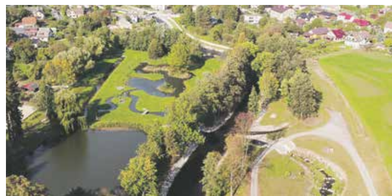
Stavební práce trvaly tři roky, probíhaly na katastru tří obcí a ochrání obyvatele obcí před padesátiletou vodou.

Přírodě blízká protipovodňová opatření na řece Desné dokončili na podzim vodohospodáři na Šumpersku. Akci za 375 milionů korun podpořil také Olomoucký kraj. Říčka získala několik nových biotopů, revitalizační ramena a povodňové parky. Všechna tato opatření dokážou zadržet až padesátiletou vodu a ochrání před povodněmi obce Rapotín, Víkřovice a Petrov nad Desnou. „Nedávne zkušenosti ukázaly, že snaha člověka násilně zkrátit velké řeky se mívá účinkem. Přírodě blízká protipovodňová opatření jdou jinou cestou – snaží se respektovat přirozený tok řeky, krajinu, kterou protéká, a zájmy člověka,“ uvedl Jan Šafařík, náměstek hejtmana Olomouckého kraje pro regionální rozvoj. V rámci projektu se na toku podařilo vybudovat rybochody, které umožní migraci vodním živočichům, což se projeví například zvýšením druhové rozmanitosti v řece.