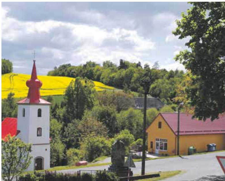
Obec Krchleby – jeden z úspěšných žadatelů v Programu obnovy venkova.

Žadatelé se často rok od roku opakují, což je zcela logické. Opakování žádostí není