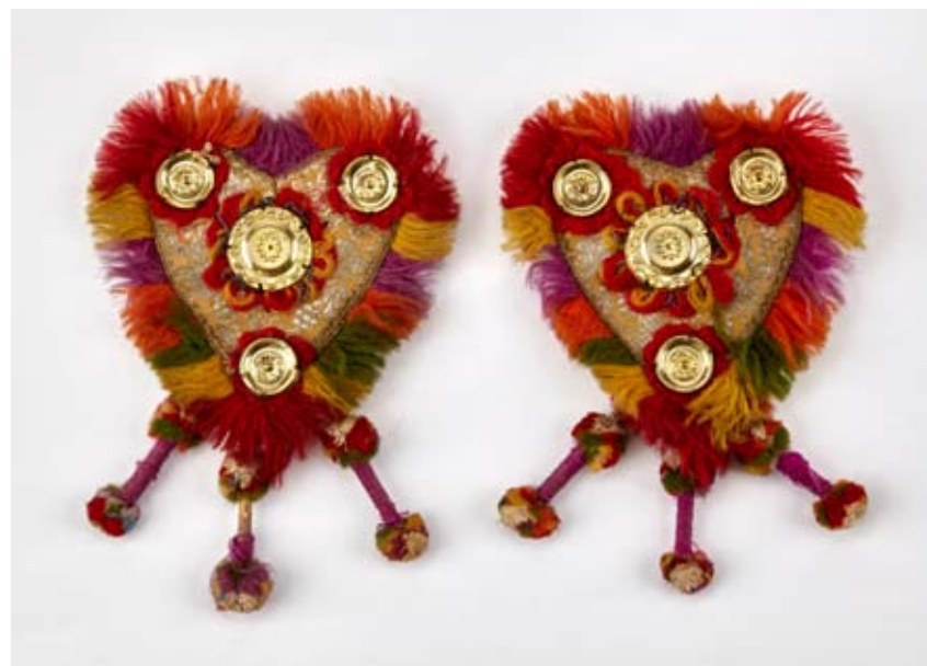
Části slavnostního ustrojení koní Haná, 19. století, Vlastivědné muzeum v Olomouci