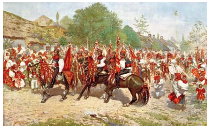
Jízda králů ve Vlčnově

Z publikace Die österreich-ungarische Monarchie in Wort und Bild, Mähren und Schlesien , 1897, Vlastivědné muzeum v Olomouci