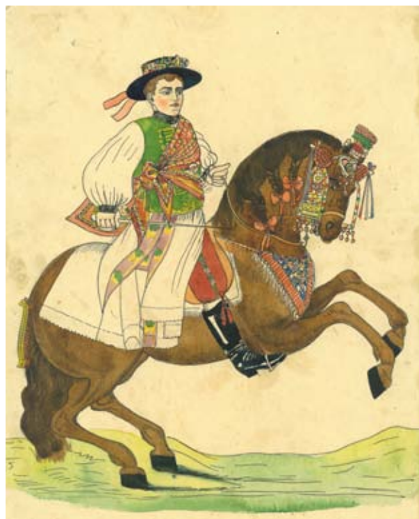
Jezdec ve slavnostním úboru v letech 1840 až 1864

Ještě v polovině 19. století byla jízda králů pravidelně praktikována v mnoha hanáckých obcích. V následujícím období však na střední Moravě prakticky zanikla. Souviselo to s novou společenskou situací po zrušení roboty v roce 1848, parcelací luk a pastvin, častější migrací obyvatelstva a tím i přirozeným narušováním životnosti výročních obyčejů. V pozdějších letech k zániku přispěl i značný úbytek koní ve vesnickém hospodářství.