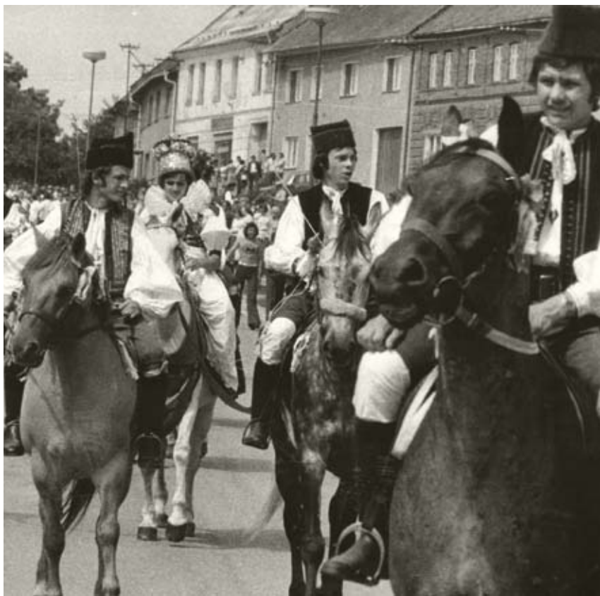
První jízda králů v Doloplazích

V poslední třetině 20. století, v souvislosti s relativní stabilizací venkova po kolektivizaci zemědělství, docházelo v některých hanáckých obcích postupně k obnově lidových zvyků a obyčejů, včetně královských jízd. V této souvislosti bylo neméně důležitým faktorem zakládání či ožiování činnosti folklorních souborů a jezdeckých oddílů. Některé jízdy králů vydržely do dnešních dnů, jiné, jako např. v Nákle u Litovle nebo v Manerově na Vyškovsku, časem zanikly.