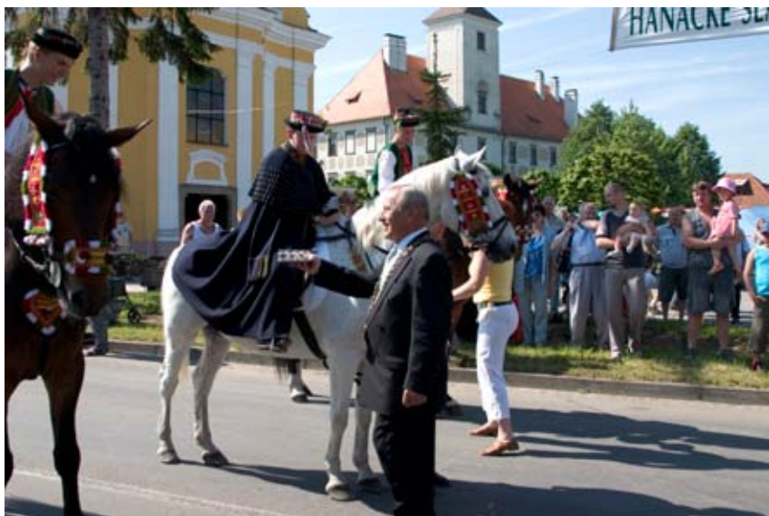
Setkání krále Ječmínka a jeho družiny se starostou města Chropyně