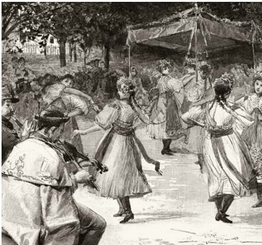
Průvod královniček na Moravě

Obyčej spadá do období letničních (Svatodušních) svátků, které připomínají Seslání Ducha svatého na apoštoly po Nanebevstoupení Páně. Jedná se o svátek pohyblivý, připadající na padesátý den po Velikonocích; může se tedy uskutečnit kdykoliv od 10. května do 13. června. Zatímco Svatodušní neděle měla vždy spíše duchovní rozměr, Svatodušní pondělí patřilo lidovým zvykům, které mají často svůj předkřesťanský základ. Kromě jízd králů se o Letnicích konaly dívčí obřadní průvody královniček a otevírání studánek nebo dětské honění krále; v širším smyslu období zahrnovalo také májové a svatojánské obyčeje a slavnost Božího Těla.