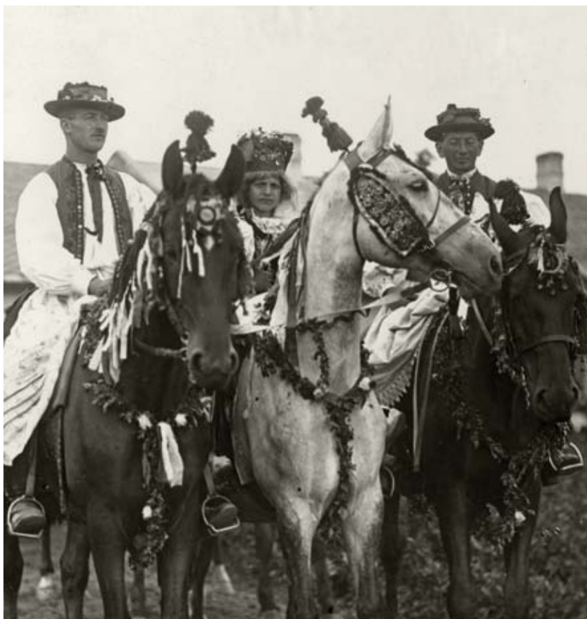
Král se svými pobočníky při honění krále na Holešovsku Začátek 20. století, Etnografický ústav Moravského zemského muzea v Brně