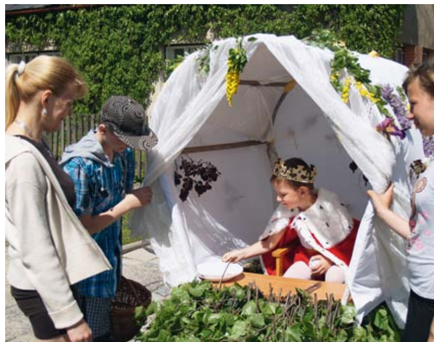
Vodění krále v Rájci u Zábřeha

Letniční obchůzka konající se každoročně v Rájci u Zábřeha si dodnes zachovává svůj tradiční lidový ráz. Na Svatodušní neděli zde chlapci vozí zvoleného krále, nejmladšího chlapce, v královském oděvu ve vozíku, ozdobeném živými květinami. Děvčata naopak za zpěvu vodí po vesnici královničku; jejím atributem je kytice květů, kterou podává domácím přivonět. Děti bývají za odměnu od místních v průběhu obchůzky často pohoštěny jídlem a pitím.