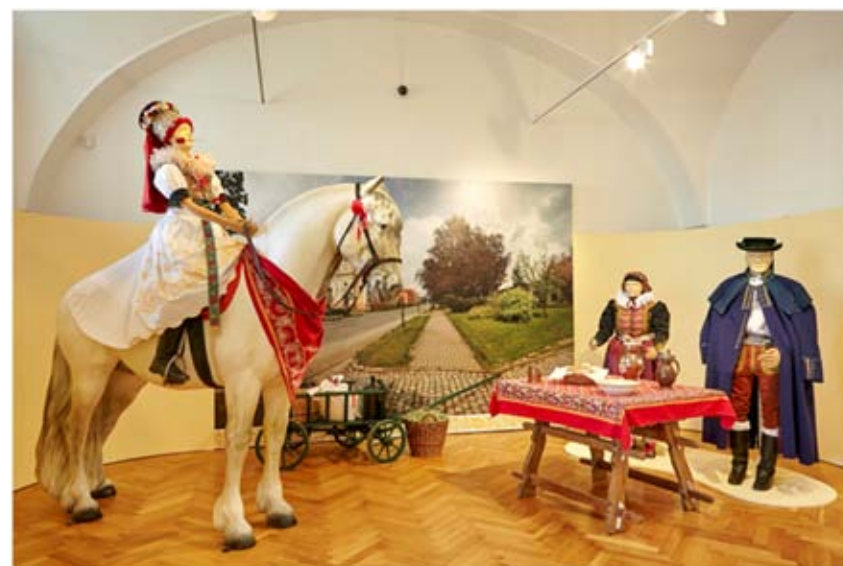
Z výstavy Jízda králů na Hané / Lidový obyčej v proměnách času