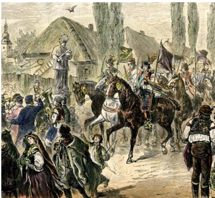
Letnice na Moravě

Jako mnoho jiných výročních lidových obyčejů i jízda králů měla především funkci ochrannou a souvisela s magickými praktikami, které měly zajistit hojnost a dostatek úrody. Po ukončení jarních prací bylo z pohledu místního společenství rozhodující naklonit si přízeň počasí v následujícím období. Důležitou roli pro obyvatelstvo hrála i sociální a iniciační funkce, kdy se z chlapců během jízdy stávali muži.