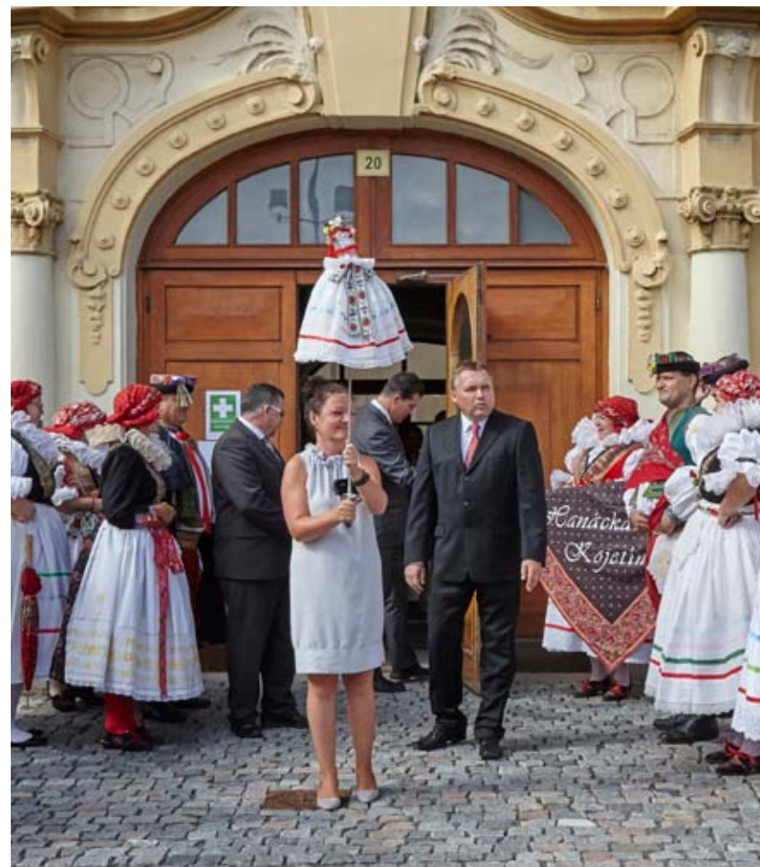
Hodové právo v Kojetíně Foto Pavel Rozsival, 2017, Vlastivědné muzeum v Olomouci

Zajímavostí při jízdách králů v Kojetíně a Bezměrově je propojení královského obyčeje s oslavami místních hodů. I proto zde dochází k veřejnému předávání hodového práva (ozdobené šavle) starostou města či obce představitelům místní chasy, zastoupené stárkem. Tímto symbolickým aktem přebírá chasa odpovědnost za průběh hodů. Zároveň má možnost pomocí ferole (dřevěné plácačky) trestat případné hříšníky.