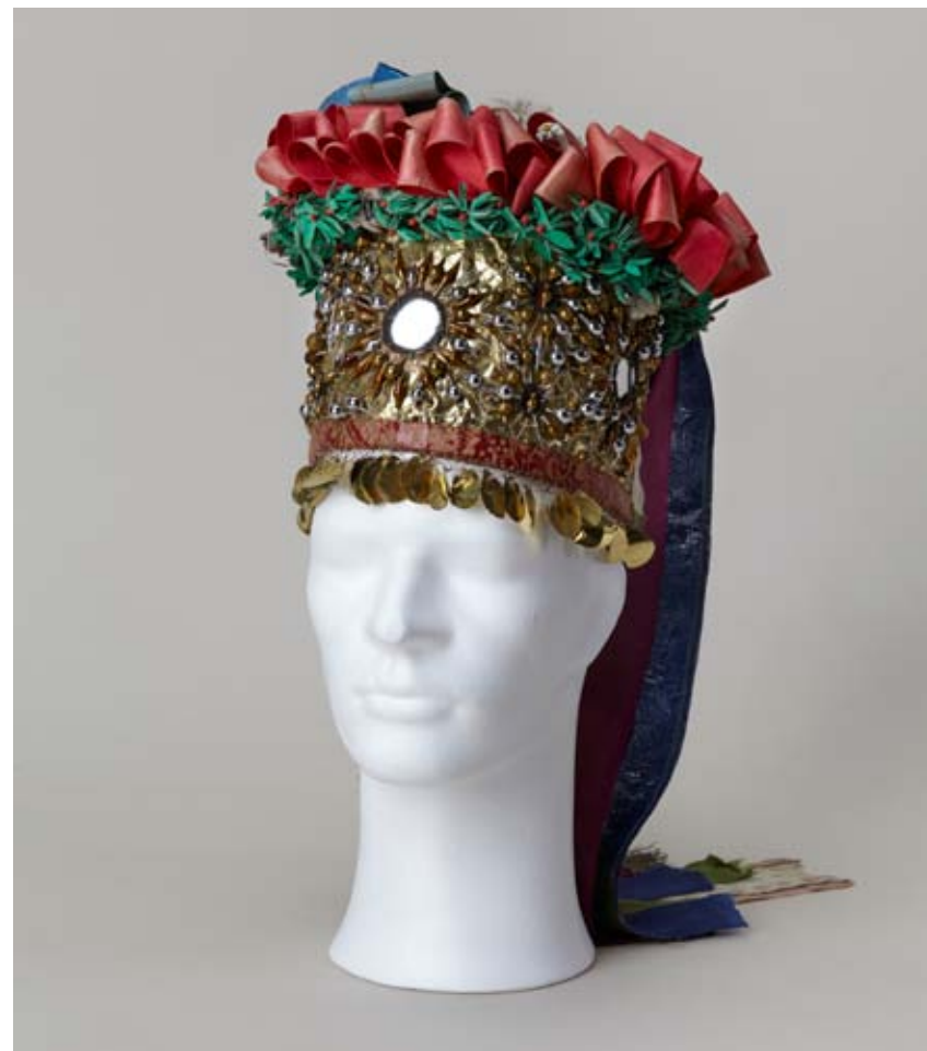
Pantlák (čepec) Tovačovsko, 19. století, Vlastivědné muzeum v Olomouci

Při jízdách králů se používá velké množství artefaktů, které však mají svou skrytou a tajemnou symboliku a v současné době jsou schované za okázalým vnějším efektem. V tomto smyslu jsou pantlák (jako pokrývka hlavy nevěsty), ženské šaty, kůň (hřebec), ale i samotná růže či postavy malého chlapce (panice) nebo krále Ječmínka jednoznačnými symboly budoucí prosperity, bohaté úrody a plodnosti.