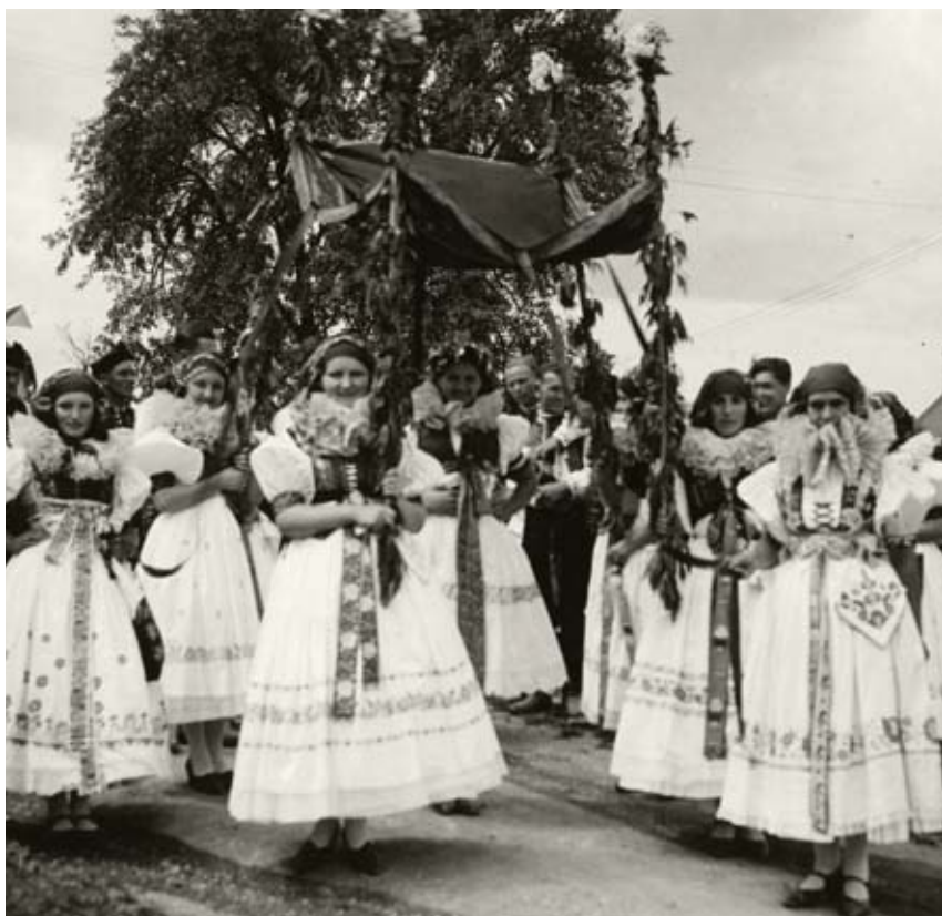
Průvod královniček ve Štěpánově u Olomouce

Foto Antonín Blažek, 1934, Etnografický ústav Moravského zemského muzea v Brně