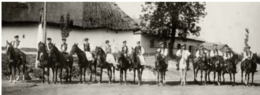
Selské banderium na Kroměřížsku Před rokem 1890, Městské kulturní středisko Kojetín