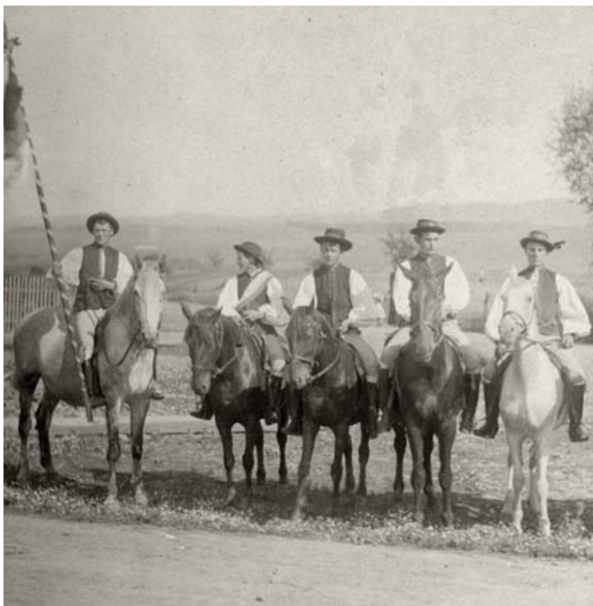
Členové královské družiny na národopisné slavnosti v Dřevohosticích Foto Josef Klvaňa, 1893, Etnografický ústav Moravského zemského muzea v Brně