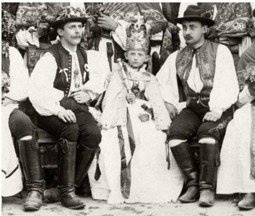
Detail skupiny krojovaných mužů z Biskupic s jejich králem na národopisné slavnosti v Prostějově

Jízda králů, dříve rozšířená nejen ve střední Evropě, je stále zakryta závojem tajemství a existují spousty domněnek ohledně jejího vzniku a původu. Může se prý jednat o připomínku středověkých rytířských slavností či putování knížat bez stálého sídla. Samotný obyčej je pravděpodobně mladšího data, jelikož kůň byl až do renesance na vesnici spíše vzácností. To však nebránilo lidem, aby vznik tradice zasadili do starobylých příběhů nebo ztotožnili s konkrétní událostí. Na Hané je jízda králů spojována nejčastěji s hledáním bájného krále Ječmínka.