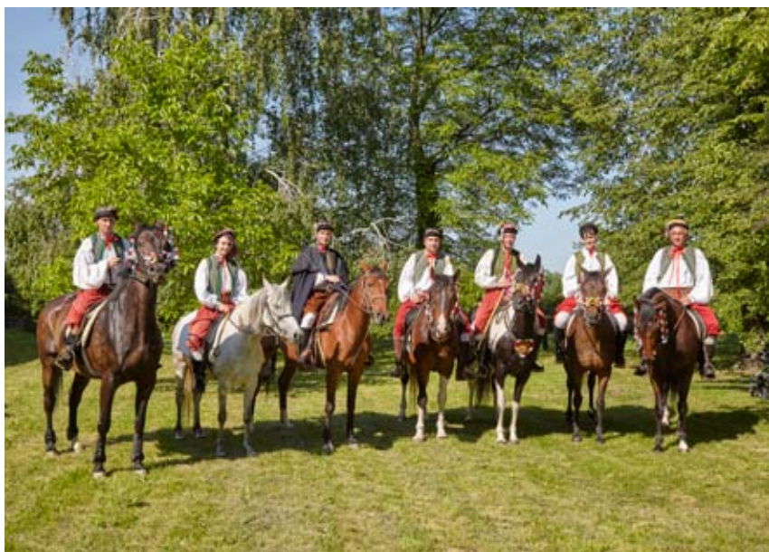
Královská jízda v Bezměrově