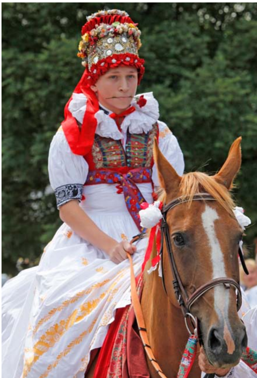
Chlapec v ženském kroji a s růží v ústech při jízdě králů v Doloplazích Foto Pavel Rozsívál, 2016, Vlastivědné muzeum v Olomouci