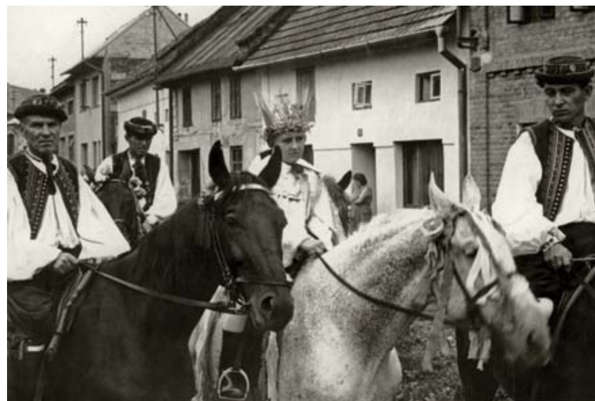
Král Ječmínek na bílém koni v Lutopecnách na Kroměřížsku 1961, Muzeum Kroměřížska v Kroměříži