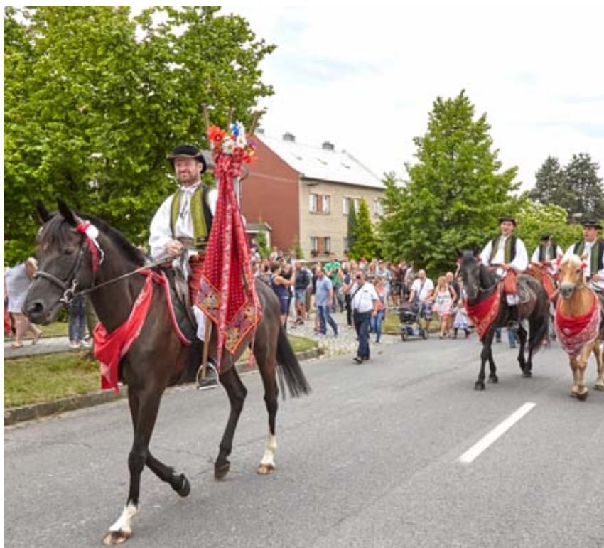
Jízda králů v Doloplazích

Jízda králů ( honění, hledání, chytání krále ) je výroční lidový obyčej, který spočívá v obřadní objíždce chlapců a mužů na koních. Hlavní postavu krále představuje dospívající chlapec nebo svobodný mládelec. V průběhu 19. století obyčej jako součást vesnického lidového výročního cyklu zanikl a dnes se na Hané zachovává v rámci místních folklorních a hodových slavností pouze ve čtyřech lokalitách – Bezměrov, Doloplazy, Chropyně a Kojetín.