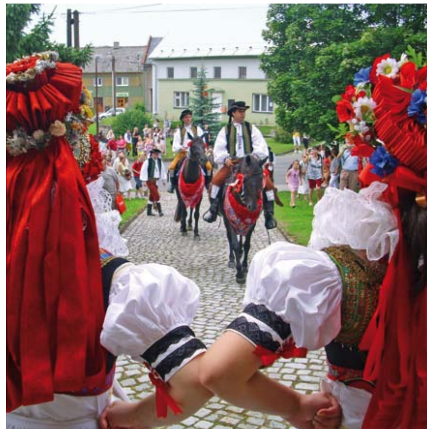
Návštěva vyvolávačů při královské objízce v Doloplazích

Funkce jízdy králů se výrazně proměnila a v současnosti plní hlavně roli reprezentativní a sociální. Několikaměsíční příprava a samotná realizace slavnosti, přes různé povinnosti, mezi něž patří shánění koní, jezdců, krojů, pečení koláčků či příprava ozdob, výrazně stmeluje obyvatele a posiluje jejich vztah k lidové kultuře a k regionu. Za realizací stojí desítky nadšenců, kteří tak pravidelně přispívají do mozaiky hanáckých zvyků a tradic. Zdá se, že jízdy králů jsou pevnou součástí kulturního a sociálního života daných obcí a měst a bezprostřední zánik jim naštěstí nehrozí.