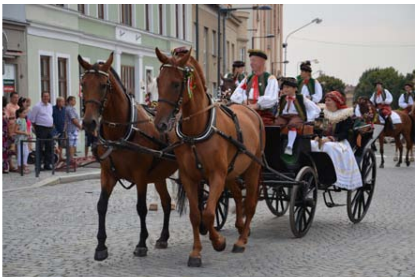
Z Ječmínkovy jízdy králů v Kojetíně Foto Josef Urban, 2015, Vlastivědné muzeum v Olomouci