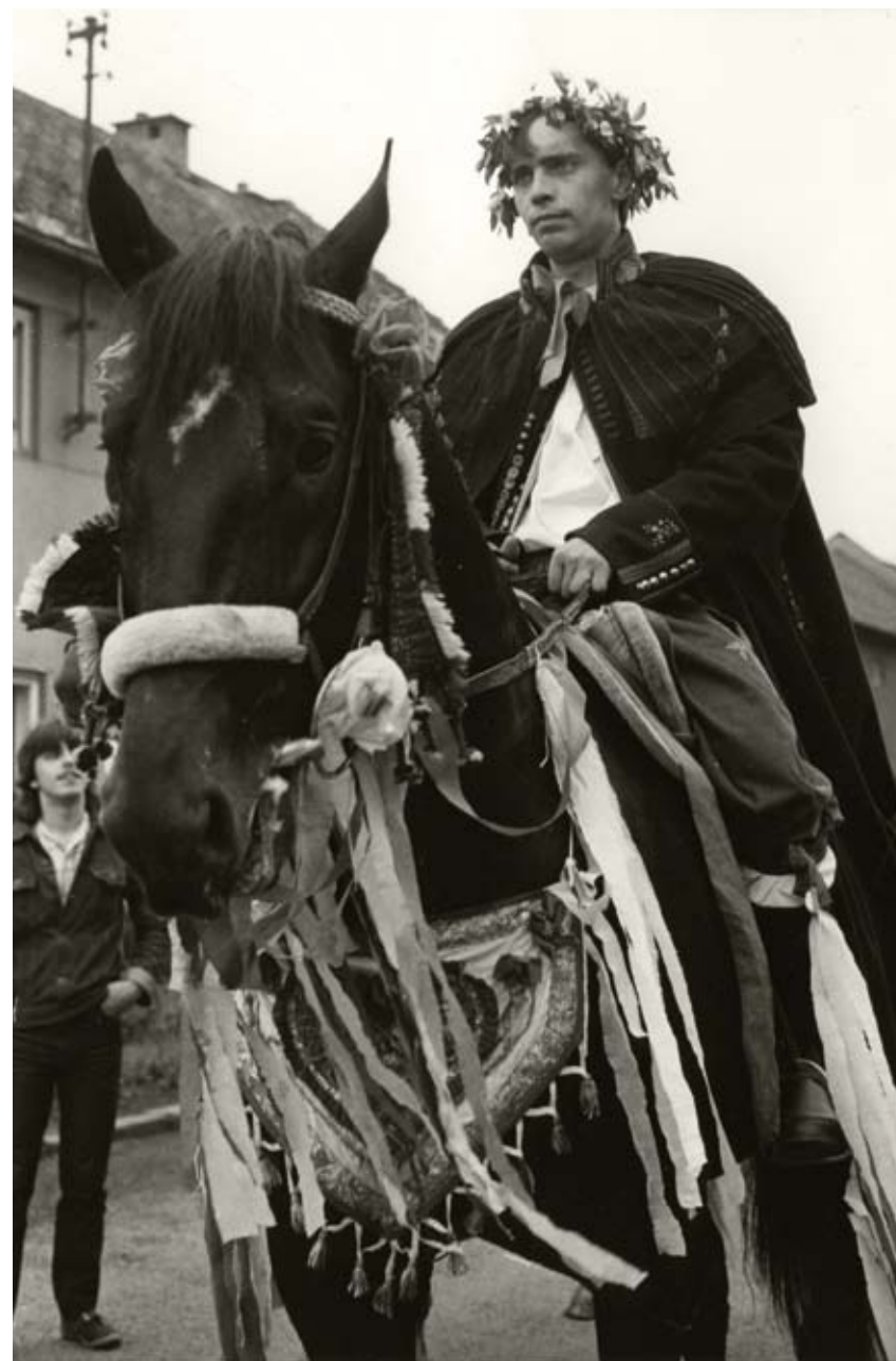
Honění krále na Hanáckých slavnostech v Chropyni

Foto Vladislav Galgonek, 1977, Hanácký národopisný soubor Olešnica Doloplazy