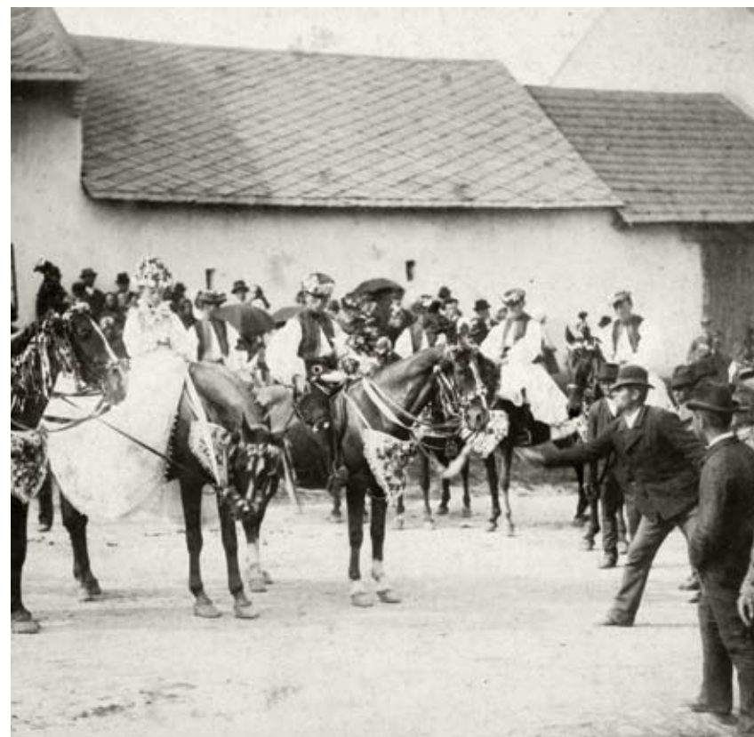
Honění krále na národopisné slavnosti v Kojetíně

Jan Zbořil, přelom 19. a 20. století, kolorovaná perokresba, Muzeum a galerie v Prostějově