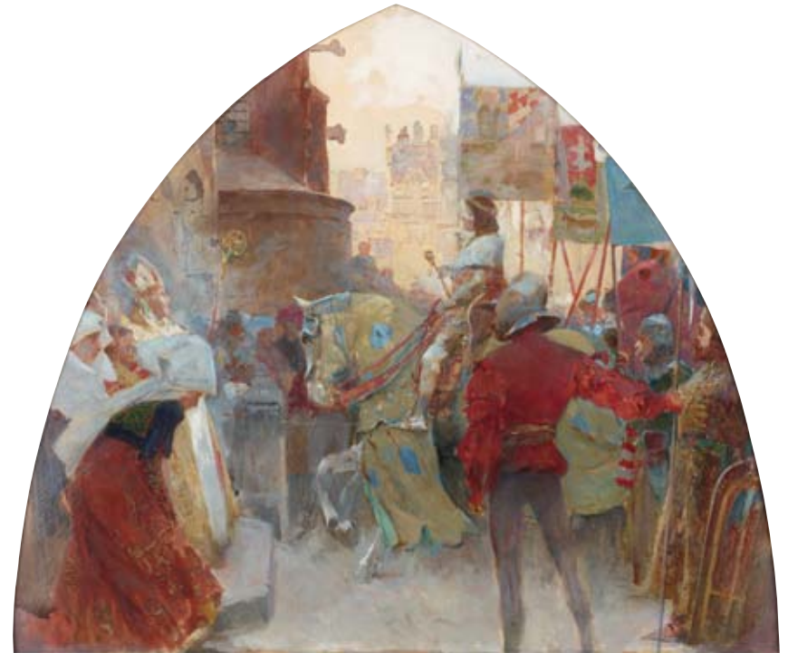
Příjezd krále Matyáše Korvína k olomouckému dómu (1469)

Jano Köhler, 1900–1901, sgraffito, zámek v Prostějově