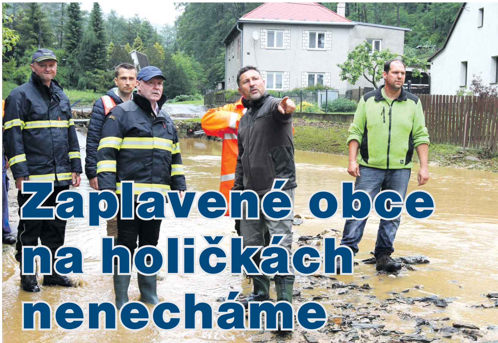
Přivalové deště zaplavily na Uničovsku a Šumpersku desítky domů, hasiči evakuovali na třicet lidí. Hejtmán Ladislav Okleštěk na místě zjišťoval, jak okamžitě pomoci.

Ladislav Okleštěk hejtmán Olomouckého kraje