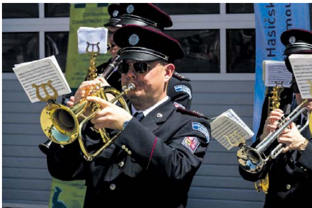
Děkonné koncerty pro první linii rozeznaly Olomouc.

H ned na třech místech v Olomouci se v pondělí 1. června uskutečnily slavnostní koncerty Hudby Hradní stráže a Policie České republiky. Smyslem akce, která se uskutečnila ve spolupráci s Olomouckým krajem, bylo poděkovat záchranářům, zdravotníkům, lékařům, hasičům a vůbec všem lidem, kteří se podíleli na zvládnutí epidemie koronaviru. „Všechny složky záchranného systému odvedly a stále ještě odvádí prvotřídní práci. Mají za sebou vysilující služby, probdělé