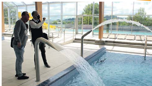
Bazén nabízí plavání, vířivku, ale i wellness.

C elkem devatenáct měsíců trvala modernizace krytého bazénu Na Benátkách v Šumperku. Po kolaudaci teď bude následovat zkušební provoz, pro veřejnost by se rekonstruovaný bazén za 170 milionů korun měl otevřít 1. září.