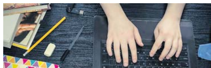
Online výuka se stane běžnou součástí vzdělávání.

Š koly v regionu se v současné době postupně vrací ke klasické výuce, kterou přerušila opatření v souvislosti s pandemií koronaviru. Podle odborníků je ale zřejmé, že výuka už nikdy nebude probíhat stejně. Různé formy online učení se stanou běžnou součástí vzdělávacího procesu na všech typech škol. „V rámci projektu na implementaci Krajského akčního plánu rozvoje vzdělávání Olomouckého kraje s názvem „Rovný přístup ke vzdělávání s ohledem na lepší uplatnitelnost na trhu práce“ byl již v roce 2017 zřízen