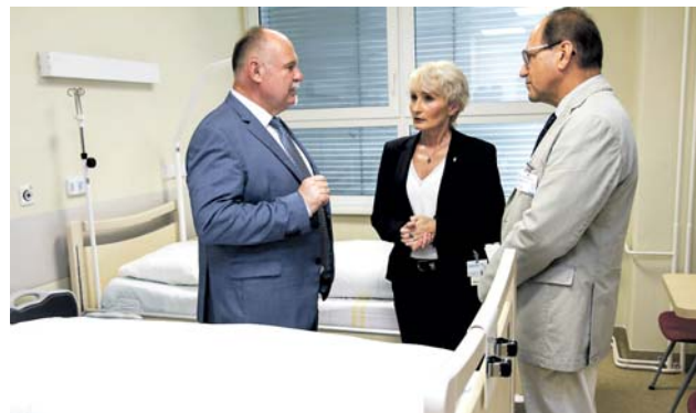
Už loni se za přispění Olomouckého kraje otevřelo v prostějovské nemocnici nové oddělení. Zdravotníci se tam starají o nevyléčitelně nemocné a umírající.

Pro Olomoucký kraj, který spolu s Hospicovou péčí Caritas odbornou konferenci organizoval, je téma paliativní péče jednou z dlouhodobých priorit. Na jejím systematickém zlepšování začalo hejtmanství pracovat jako jedno z prvních v Česku. Letos