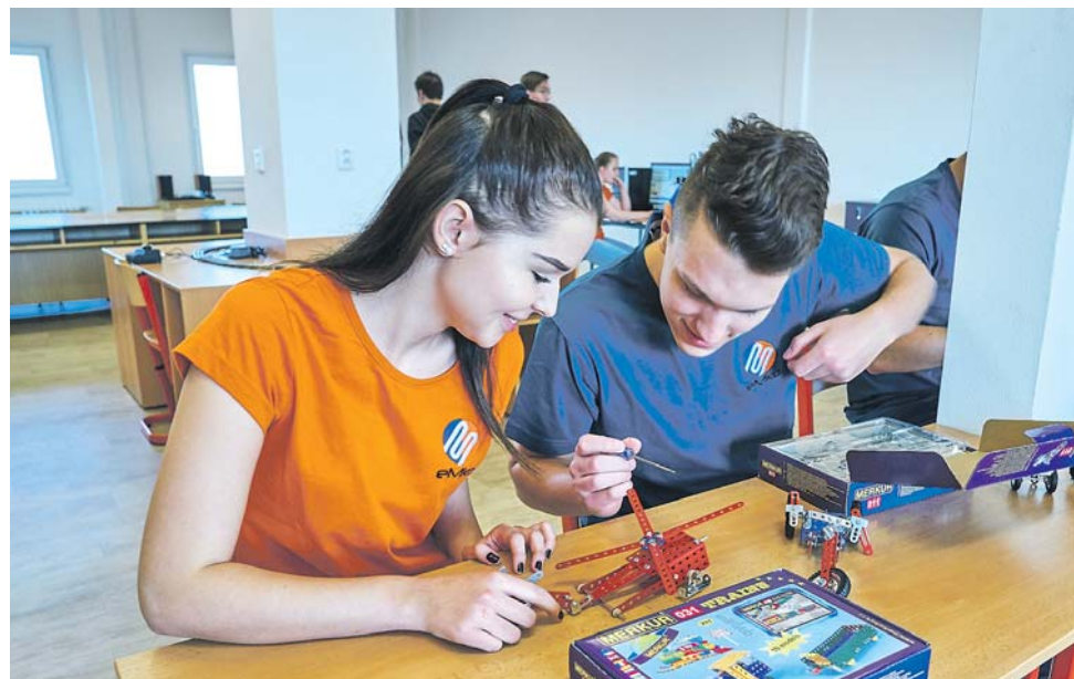
Střední průmyslová škola Jeseník otevře obor Informační technologie a učební obor Elektrikář.

Aktuálně se pracuje také na nových učebnách polytechnického vzdělávání, robotiky a 3D tisku. S mo-