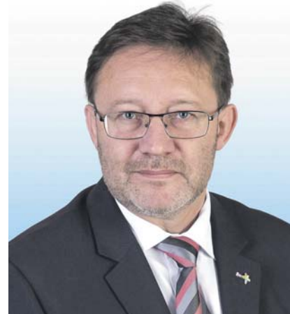
Jiří Zemánek, 1. náměstek hejtmana zodpovědný za finanční a investiční oblast.

V první fázi jsme se zaměřili na cestovní ruch a životní prostředí. Chceme totiž investovat do aktivit, které budou