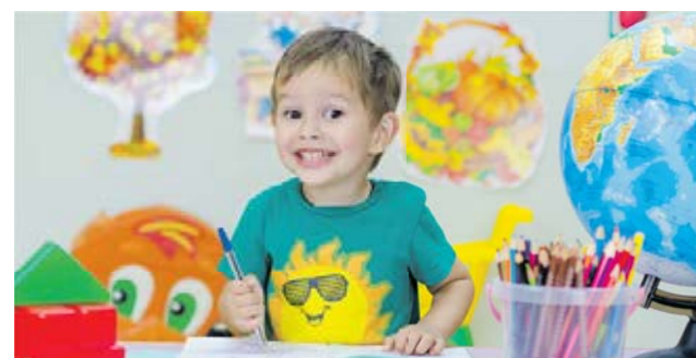
Cílem kampaně je propojení dvou generací, seniorů a dětí.

Děti tak mohou vytvořit pro babičky a dědečky přání, které pak poputují nejen do pobytových zařízení, ale i do domácností osamělých seniorů. „Pokud máte zájem se do iniciativy zapojit, prosím kontaktujte nás do 14. srpna a to prostřednictvím emailu vatlav.zatloukal@mpsv.cz ,“ doplnil Václav Zatloukal. (red)