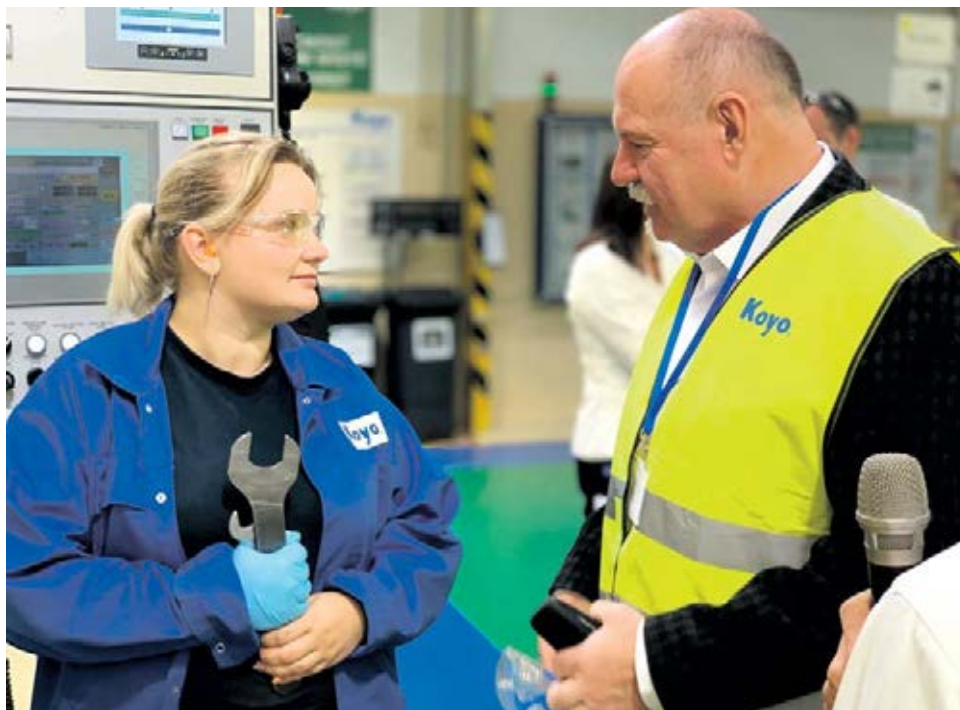
Hejtmán Ladislav Okleštěk debatuje se zaměstnanci při návštěvě Koyo Bearings.

Podobný princip uplatní hejtmánství také v podpoře cestovního ruchu. Další deset milionů totiž uvolní na doporučení ekonomického týmu do budování turistické infrastruktury. „Stavební firmy tak získají důležité zakázky a opět půjde o podporu velmi rychlou. Dotační titul v této oblasti už kraj nabízí a zájemci, na které se nedostalo, se teď budou moci přihlásit do druhého kola. Projekty i spolufinancování jsou připravené, to je velká výhoda,“ uvedl hejtmán. Kraj zároveň plánuje ještě zintenzivnit