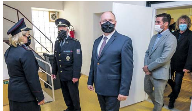
Červnového slavnostního otevření se zúčastnil hejtmán Olomouckého kraje Ladislav Okleštěk.

Zvýší se akceschopnost, dosažitelnost služby, a dojde i k výrazně lepšímu pokrytí územní působnosti obvodního oddělení. S ohledem na strategické umístění města Javorníku u státních hranic a také rozlohu území, které spravuje OOP Javorník, bylo potřeba zajistit častější přítomnost policistů v tomto městě. (red)