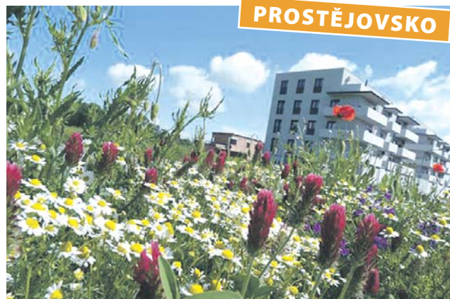
Rozkvetlé louky o čtyřiceti až sto druhů rostlin zdobí město Prostějov.

R ozkvetlé louky aktuálně zdobí Prostějov. Město s nimi začalo experimentovat už v roce 2009 a postupně se podařilo osadit několik lokalit, například je najdeme na ulici Brněnská, v lesoparku Hloučela nebo na kruhovém objezdu na Plumlovské.