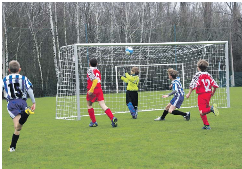
Hejtmanství pomohlo trenérům a podpořilo také mladé reprezentanty.

Krajské dotace podstatně snižují finanční zátěž, kterou musí budoucí trenéři vynaložit na sebevzdělávání. Cena se odvíjí od vý-