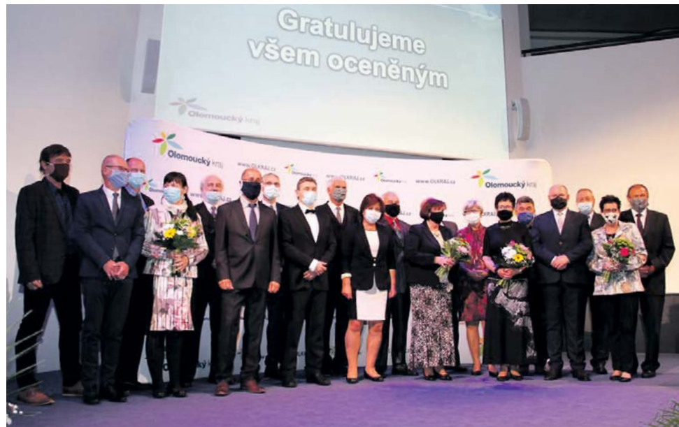
Hejtmanství ocenilo celkem patnáct pedagogických pracovníků a Cenu náměstka hejtmána obdrželi další tři.

Hejtmanství ocenilo v pondělí 25. května celkem patnáct pedagogických pracovníků a Cenu