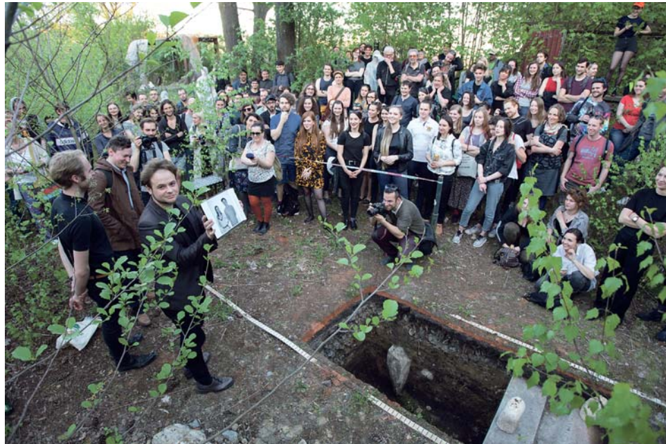
Ojedinelá procházka Olomoucí má několik zastávek, třeba galerii HROB, jejíž umístění zůstává do poslední chvíle návštěvníkům neznámé.

Návštěvníci na procházce městem putují často neobvyklými malými galeriemi. Vedle klasické kamenné galerie XY na Dolním náměstí se mohou s uměním Opavy setkat