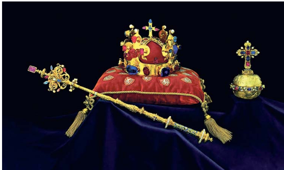
Mistrovské kopie českých korunovačních klenotů se v Olomouci představí od září do ledna.

Archeologická výstava, jejíž příprava trvala téměř dva roky, se zaměřila na prezentaci kamenné hlavy nalezené v roce 1943 v pískovně na katastru Mšeckých Žehrovic na Rakovnicku. Její originál je uložen v Národním muzeu v Praze, pro svou unikátnost je k vidění výjimečně. „Národní muzeum ji zapůjčuje velice sporadicky, a to i do zahraničí. Dokonce v expozicích Národního muzea je vystavena pouze kopie,“ uvedl mluvčí Vlastivědného muzea v Olomouci Antonín Valenta. Kamennou plastiku