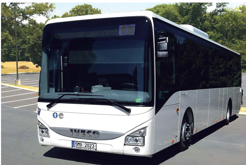
Takzvaný aktivní kyslík spolehlivě zničí viry a bakterie.