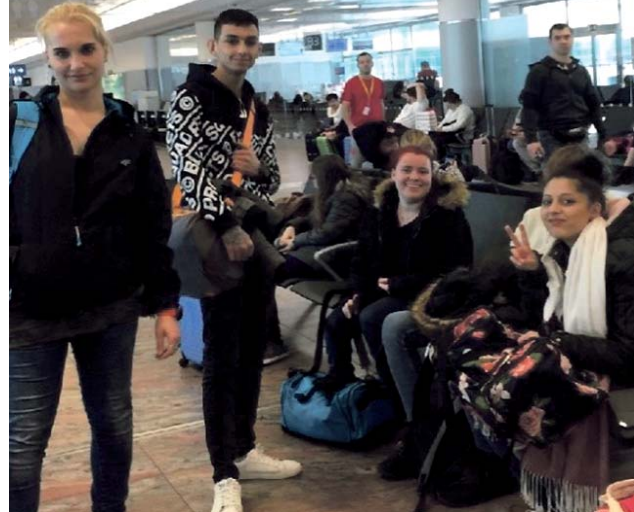
Projekt nabízí i zahraniční stáže.

Současně začíná třetí běh projektu „Máš na to“ - podnikatelský venkovský akcelérátor, který umožňuje zpracování podnikatelského plánu a pro vybrané účastníky možnost otestovat své podnikání v podnikatelsko-zaměstnaneckém družstvu BEC.