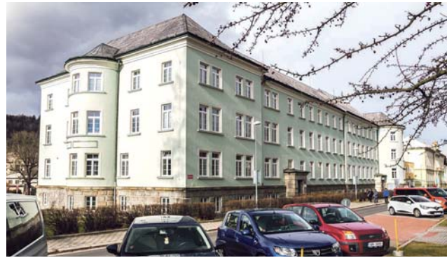
Některá okna na budově polikliniky byla ještě původní, stará skoro 90 let. Výměna ušetří peníze za vytápění.

Poliklinika navíc otevřela novou RTG ambulanci. Moderní pracoviště za sedm miliónů korun zvýší kvalitu i dostupnost zdravotní péče nejen pro obyvatele města, ale celého okresu. (red)