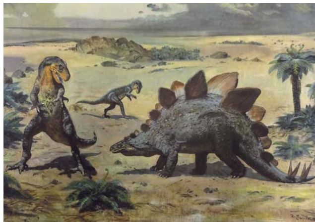
Školní plakát Stegosarus a Allosaurus od Zdeňka Buriana. Zdroj: Muzeum Komenského v Přerově

Máte jedinečnou možnost vidět na vlastní oči vzácnost z přerovského muzejního depozitáře – tři olejomalby lidských typů z doby první republiky, které ukazují americké, africké a asijské obyvatelstvo. Burian je namaloval ve dvacátých letech minulého století pro Stanislava Nikolaua a jeho zeměpisný časopis Širým světem. V cyklu nazvaném Země a lidé vzniklo sedm obrazů zachycujících vždy čtyři