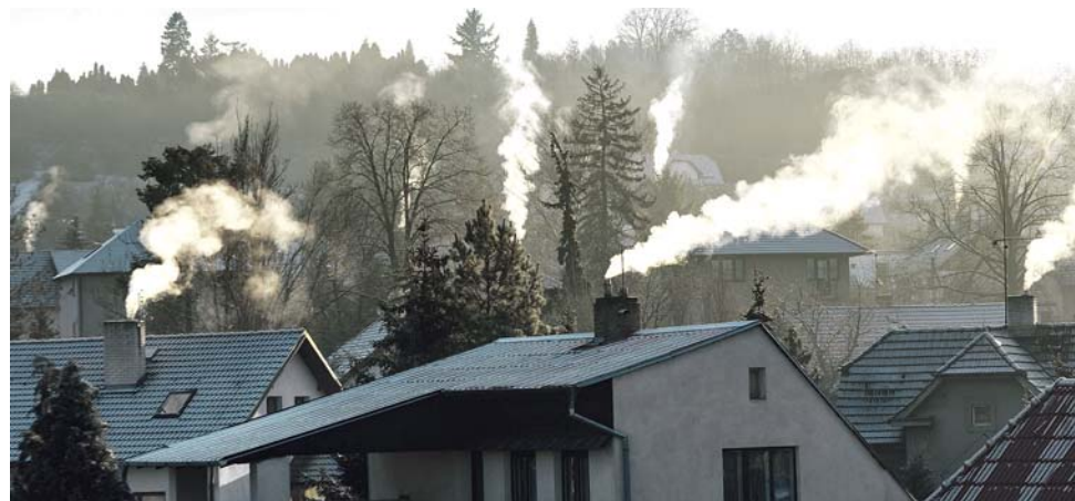
Ve třetí vlně rozdělování kotlíkových dotací byl největší zájem o kondenzační kotle na zemní plyn.

„Peníze navíc se vždycky hodí, a v tomto případě to platí dvojnásob. Pokud budeme s požadavkem o finanční dorovnání úspěšní, můžeme podpořit dalších téměř šest stovek žádostí o nový kotel nebo tepelné čerpadlo, což významně přispěje