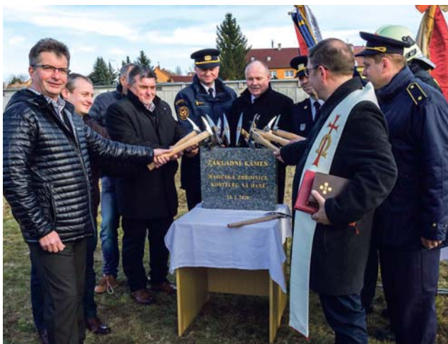
V nové zbrojnici bude dost místa i pro třetí auto, které teď mohou hasiči pořídit.

Poklepáním základního kamene odstartovala v pondělí 24. února stavba nové hasičské zbrojnice v Kostelci na Hané. Hasičárna za zhruba 25 miliónů korun vyroste na okraji města.