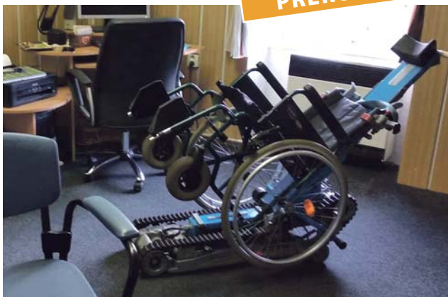
Schodolez umožňuje imobilním lidem překonat různé typy schodišť.

Dvě klubových prostor neziskové organizace Alfa handicap Přerov se v polovině února otevřely pro veřejnost. Odpoledne pořadatelé věnovali valentýnské tvořivé dílně, ve které si mohli účastníci vyrobit drobný dárek k svátku zamilovaných. Odvážnější měli možnost si prohlédnout i prakticky vyzkoušet