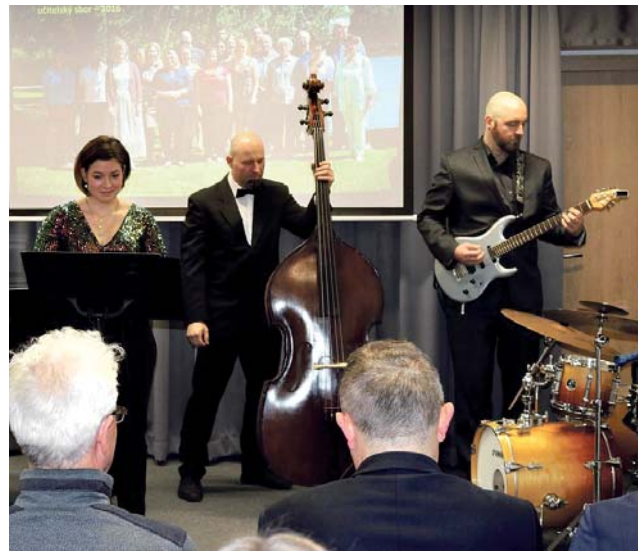
Rekonstrukce litovelské ZUŠ skončila v roce, kdy si škola připomíná 120 let od založení.

Rekonstrukce litovelské ZUŠ byla rozdělena do dvou částí. Během první vznikly v roce 2018 tři nové učebny ve třetím