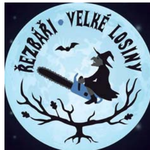
Velké Losiny budou v dubnu tři dny hostit řezbářskou přehlídku.

Vše začne ve čtvrtek v 9 hodin ráno, kdy řezbáři začnou tvořit díla na téma čarodějnice, čaro-