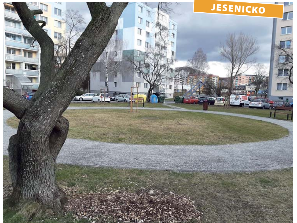
Na jaře v parčíku v Lipovské ulici vykvětou keře a záhony trvalek.