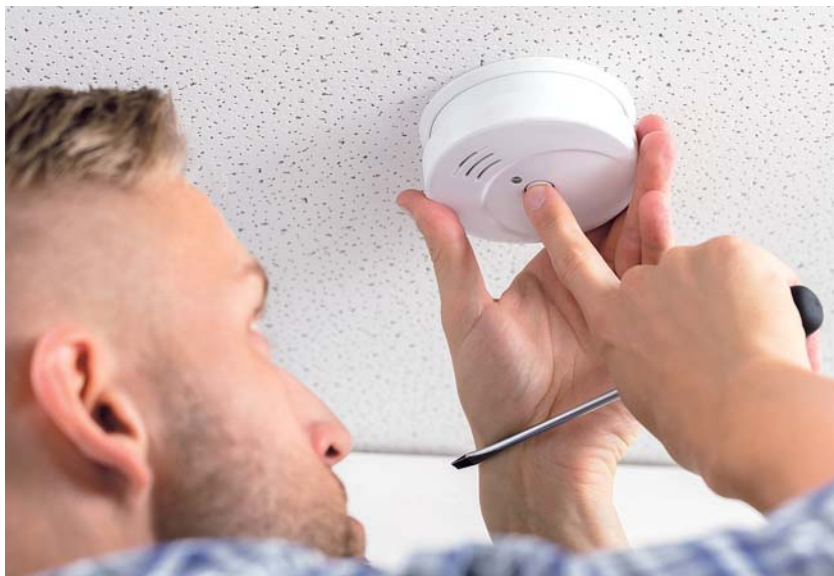
Detektory kouře umožní včasné přivolání hasičů, které může být rozhodující.

„Detektory dokážou obyvatele domu včas varovat před hrozícím požárem. Umožní jim tak bezpečnou evakuaci a včasné přivolání hasičů – právě rychlost hraje při těchto událostech zásadní roli,“ dodala Alena Hložková, vedoucí oddělení krizového řízení Olomouckého kraje. (red)