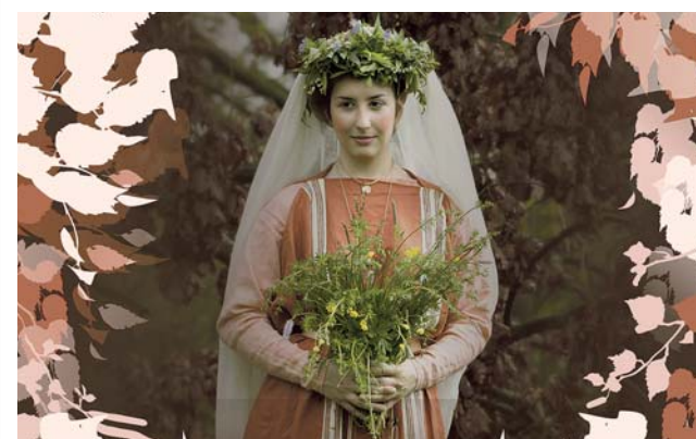
Výstava na přerovském zámku potrvá až do 21. června.

Kromě panelů a figurín tvoří výstavu, která potrvá do 21. června, i bohatý archeologický materiál. (red)