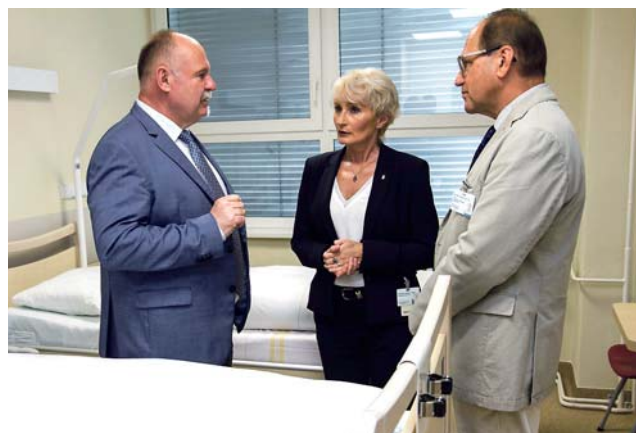
Vyšší podpora zahrnuje lůžkovou i domácí péči. Dohromady kraj uvolní přes osm milionů korun.

Žádosti o dotace začne hejtmánství přijímat v dubnu, ještě předtím uspořádá pro zájemce informační seminář. (red)