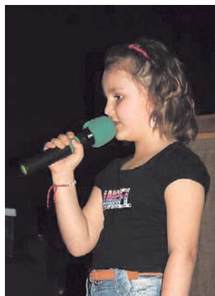
Soutěže ve zpěvu populárních písní Hanácký skřivan se pravidelně účastní i děti z okolních krajů.

Přehlídka pro soutěžící od 15 do 20 let Hanácký skřivan 15-20 má své 16. pokračování 18. dubna. Hlásit se mohou dva i tria.