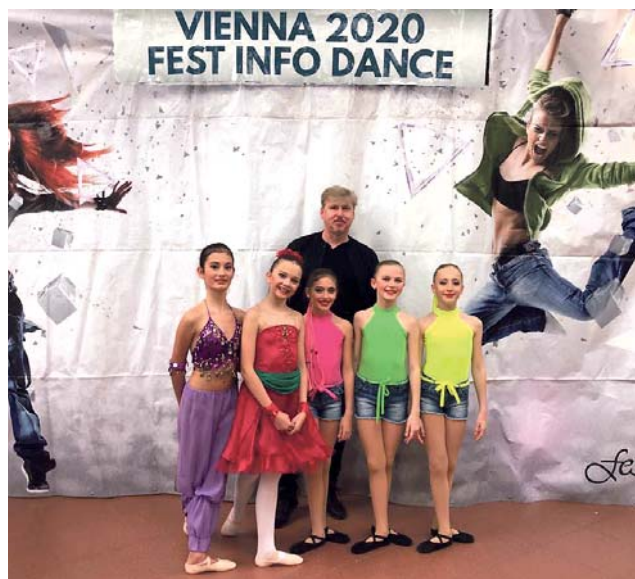
Olomoucké baletky přivezly z Vídně většinu medailí ze svých kategorií. Dvě děvčata se nominovala do finále soutěže v Itálii.