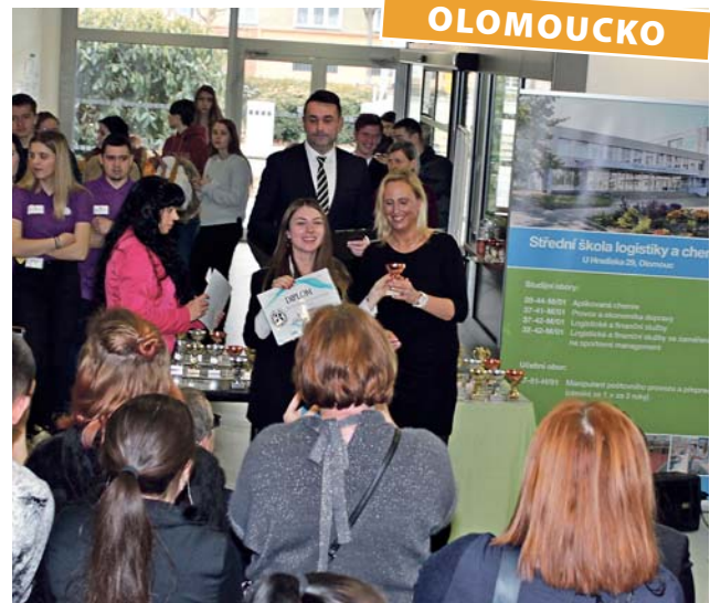
Na organizaci veletrhu fiktivních firem se mimo jiné podíleli pedagogové a žáci ze Střední školy logistiky a chemie v Olomouci.

Kromě 24 účastníků z České republiky jich 19 dojelo ze zahraničí (Slovenska, Ruska, Moldávie, Rumunska a Belgie). Odborná porota vybírala nejlepší logo, slogan či prodejní stánek, hledal se nejlepší reprezentant, osobní prezentace nebo obchodní plán. Porotcům neunikly ani jazykové zna-