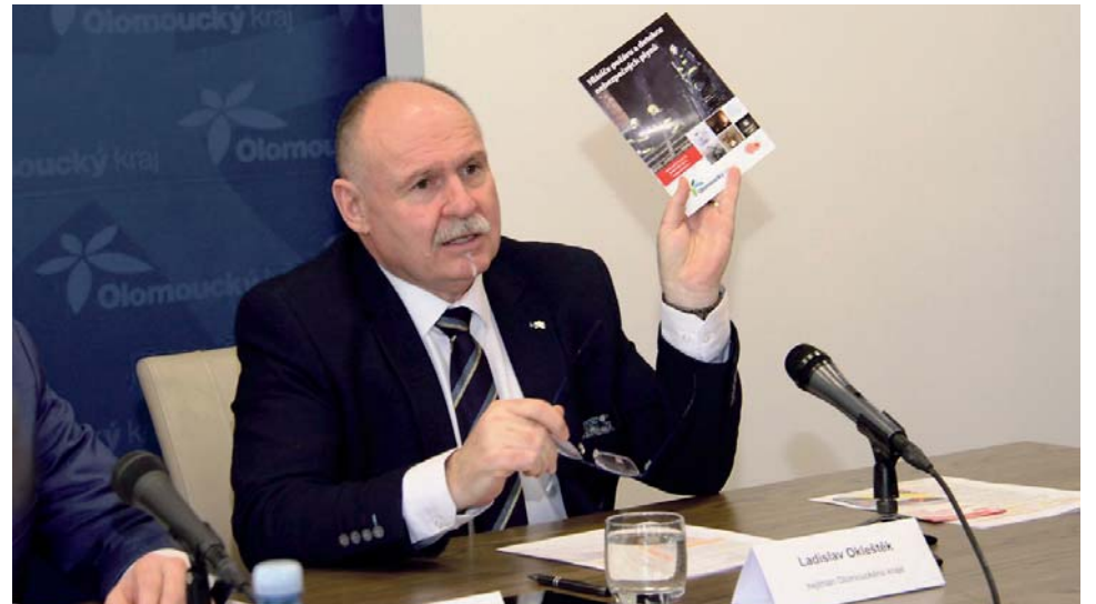
Senioři jsou nejohroženější skupinou obyvatel, proto na ně kraj s požárními hlásiči myslel nejdříve.

„Projekt je výsledkem pravidelných jednání naší bezpečnostní rady. Ta už vloni vydala brožuru, kde lidé najdou užitečné informace právě k této problematice. Záměr rozdat požární hlásiče mezi nejohroženější skupiny obyvatel je tak dalším krokem k zajištění větší bezpečnosti našich občanů,“ uvedl Ladislav Okleštěk, hejtmán Olomouckého kraje.