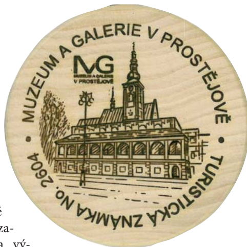
Sběratelé odhlasovali, že budova prostějovského muzea by měla mít vlastní známku. Už je na světě.

Aktuálně je v muzeu v Prostějově k vidění do začátku března výstava řemesel Když ten dělá to a ten zas tohle. Galerie Špalíček zve na výstavu Výtvarný slabikář. (red)