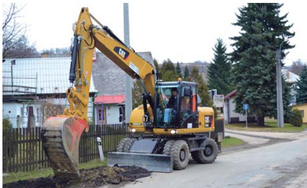
Obce mohou čerpat peníze například na protipovodňové stavby.

Žádosti o podporu v obou dotačních progra-