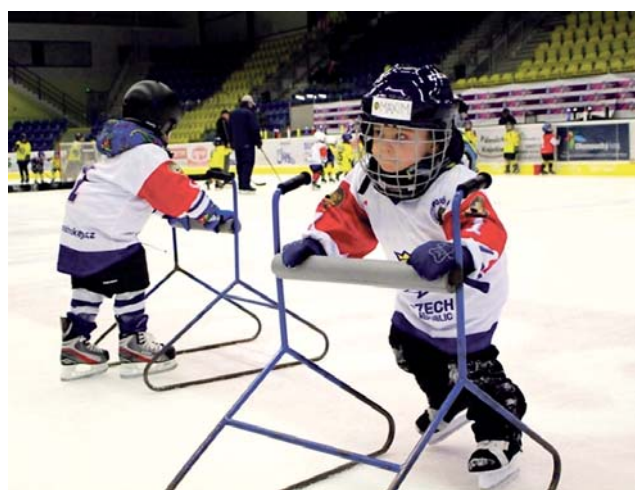
Na zimní stadion v Přerově přišli bruslit i nejmenší.

Všichni účastníci se nejprve zaregistrovali a v šatně převlékli do hokejového. Pak už mohli vyrazit dováčet na ledě. O zábavě dětí jsou akce během Týdne hokeje především. Od roku 2017 je organizují kluby po celém Česku. Na stadionech si pro kluky a holky ve věku od čtyř do osmi let připravili střelbu na brankáře nebo ukázkový tré-