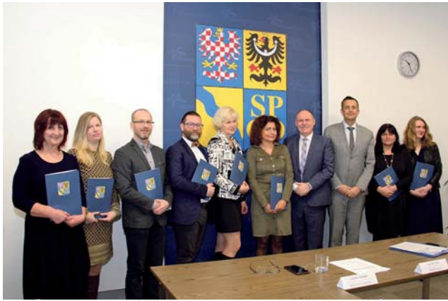
V regionu je 479 základních knihoven, které zřizují města a obce. Kraj pro ně připravil tři dotační programy.

B ezmála dvanáct milionů korun uvolní letos Olomoucký kraj na podporu knihoven. Čtenáři se tak nemusí obávat, že by o svoji zálibu přišli nebo ji museli omezit. Příslušné smlouvy uzavřelo hejtmánství se sedmi pověřenými knihovnami v pondělí 3. února.