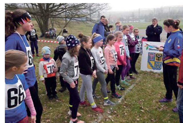
Tradičního Lesního běhu Opatovice se mohou účastnit mladší i starší žáci, dorostenci, junioři, mláďaři i vytrvalci.

Žáci mají startovné zdarma, dorostenci, junioři a dospělí zaplatí 50 korun. Hlásit se do závodu je možné na fotbalovém hřišti nejpozději deset minut před startem. (red)