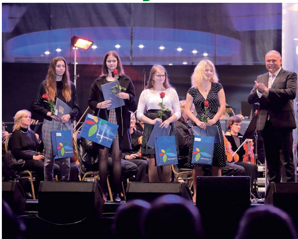
Poprvé hejtmanství ocenilo mladé výtvarníky minulý rok při Dnech Olomouckého kraje. Po úspěchu soutěže zaměřené na základní umělecké školy v ní bude letos pokračovat.

Minulý rok se do soutěže zapojili žáci šesti základních uměleckých škol z Olomouce, Prostějova, Hranic, Zábřehu, Konice a Zlatých Hor. Celkem na kraj poslali 137 prací. (red)