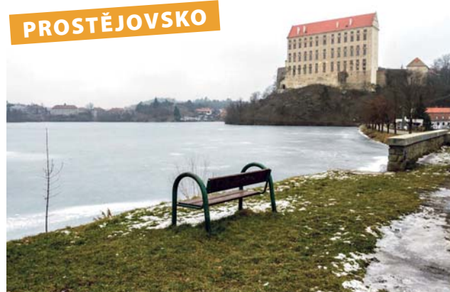
Téměř dva kilometry dlouhá cyklostezka spojí na podzim Plumlov a Mostkovice na Prostějovsku.

N ová cyklostezka podél severního břehu plumlovské přehrady vyroste mezi městem Plumlov a sousední obcí Mostkovice na Prostějovsku. Stavba dlouho očekávaného úseku v délce 1,8 kilometrů potrvá do září tohoto roku.