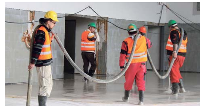
Při plánování dotací se kraj obracel na starosty, aby mohl podporu co nejlépe zacílit.

Olomoucký kraj bude letos pokračovat ve splácení dluhu, který získal v minulosti. A to bez ohledu na výši investic určených na rozvoj kraje. Tento týden o tom informoval Jiří Zemánek, náměstek hejtmana pro oblast financí a investic.