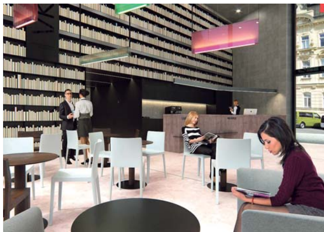
Vědecká knihovna v Olomouci nabízí možnost podílet se na vzhledu interiéru nové přístavby. Stačí věnovat staré knihy ve vhodném rozměru.

Knihy mohou dárce nosit po celý měsíc březen v maximálním počtu dvaceti kusů. Vítány jsou zejména knihy staré se zažloutlými stránkami, stránky mohou být ale i bílé nebo jinak barevně upravené. Podmínkou jsou rozměry: 20–32 centimetrů na výšku, 10–21 centimetrů na šířku, hloubka nejméně jeden centimetr. Speciální místo budou mít knihy s počtem stran přes 600. Je třeba, aby knihy měly zachovalou vazbu a desky, nebyly navlhle nebo plesnivé a byly odbalené.