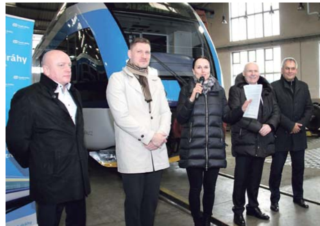
Na koleje v kraji vyjede celkem 12 nových jednotek.

První dvě soupravy Stadler začnou cestující vozit v nejbližších dnech na trati