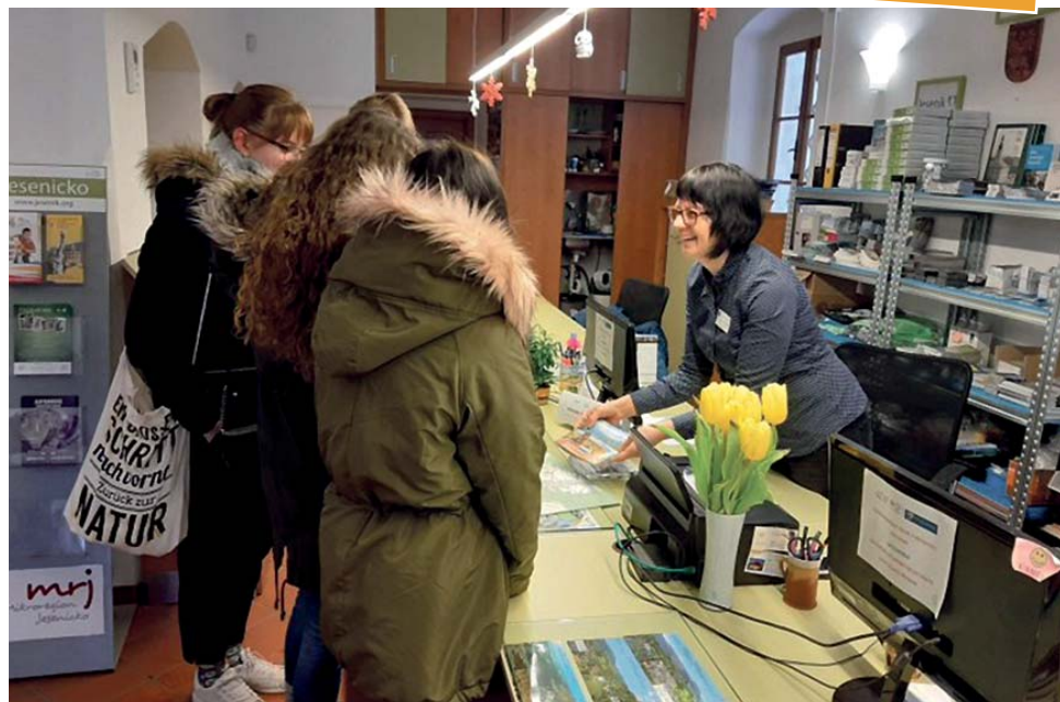
V době letních prázdnin navštíví jesenické infocentrum i tři sta lidí za den.

Jesenické infocentrum sídlící v měšťanském domě Katovna navštívilo v období let 2016 až 2019 celkem 108 222 turistů. Z toho přes 96 tisíc jich bylo české národnosti - nejčastěji z krajů Moravskoslezského, Olomouckého, Středočeského, hlavního města Prahy a Jihomoravského kraje. Cizinců pocházejících převážně ze zemí sousedících s Českou republikou přijelo téměř 12 tisíc, nejpočetnější skupinu tvořili naši polští sousedé. „Nejvíce lidí již tradičně přijíždí v období letních prázdnin, a to zejména v srpnu, kdy návštěvnost šplhá na více