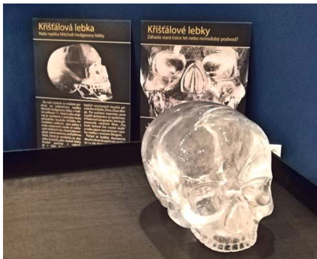
Zřejmě nejdražší exponát výstavy. Věrná replika slavné Michell-Hedgesovy křišťálové lebky.

I přes skutečnost, že výstava Největší záhady a tajemství světa je samozřejmě jen kolekcí kopií mistrovských a výstavních replik, faksimilií a reprodukcí, bylo velmi náročné je na výstavu zajistit. Pro zajištění všech exponátů bylo nutné doslova proletět celý svět a propojit se s top odborníky nejen několika zemí Evropy, ale i USA, Indie, Austrálie, Hondurasu a Číny. „Vidět na jednom místě nejznámější záhadné výtvořky světa bude úžasný zážitek. I kopie jsou zpracovány do nejmenších detailů a mohu ubezpečit, že stojí za návštěvu,“ upřesnil