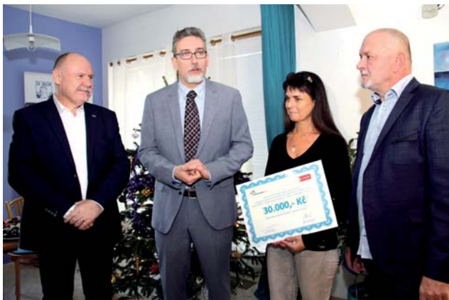
Dar ve výši 30 tisíc korun použije organizace Za sklem na výstavbu relaxační místnosti v olomoucké pobočce.

Hejtman Olomouckého kraje Ladislav Okleštěk a primátor města Olomouce Miroslav Žbánek předali organizaci Za sklem šek na třicet tisíc korun. Osmnáct a půl tisíce korun se podařilo získat díky charitativnímu prodeji punče, zbytek přidali hejtman a primátor ze svého.