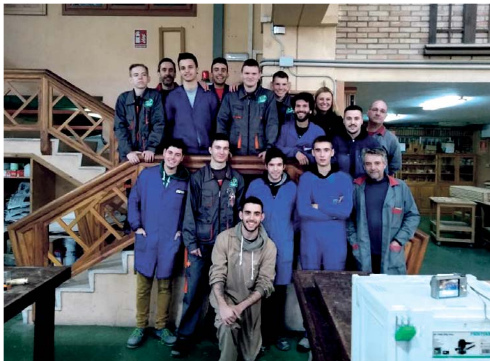
Na dvouměsíční praxi vyjeli z Olomouce do španělského města Pontevedra žáci oborů automechanik, autoelektrikář a truhlář. Věnovali se i práci na zakázku.

Žáci oboru truhlář samostatně vyráběli pracovní pomůcku, učili se programovat ve 3D a pracovali na CNC stroji. V dílně se také zapojili do zakázkové výroby laviček, vyzkoušeli si lakování kuchyňské pracovní desky a absolvovali přednášku