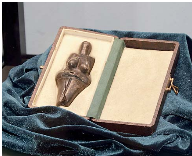
Dvacet tisíc návštěvníků za dvanáct dní. Muzeum muselo kvůli zájmu o jedinečnou sošku posílit pokladnu i ostrahu.

Takto vzácný artefakt hostilo muzeum poprvé, teď už ovšem připravuje na konec ledna další architektonický unikát, který ve speciálně vyrobené vitrině Věstonickou venuši vystřídá a to kamennou hlavu Kelta. Nalezena byla v roce 1943 v pískovně u Mšeckých Žehrovců a po většinu času je uložena v Národním muzeu v Praze.