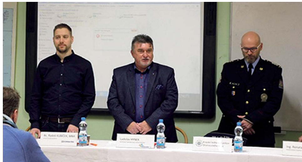
Vzdělávací akce pro zástupce škol a školských zařízení za účasti Ladislava Hynky, náměstka hejtmana Olomouckého kraje a zástupců Krajského ředitelství policie Olomouckého kraje.

Minulý rok hejtmantství čerpalo pro tyto účely dotaci Ministerstva vnitra. Kraj zpracoval dokumenty, které vyhodnocují ohroženost měkkých cílů a dále bezpečnostní plány včetně bezpečnostních procedur. Zároveň se uskutečnily vzdělávací akce zaměřené na základní ochrany měkkých cílů. Odborníci vedli také výcvikovou akci, která se věnovala základům zdravotnictví a poskytnutí první pomoci s praktickým nácvikem. Programy primárně mířily na zástupce škol a školských zařízení a zástupce veřejné správy.