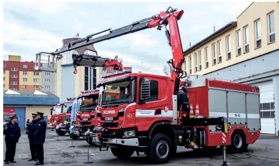
Profesionálové z Přerova a Jeseníku dostali úplně nová auta, která budou v provozu každý den. Staré vozy šly do služeb dobrovolným hasičům.

Nové vozy doplní technický park na požárních stanicích v Přerově a v Jeseníku. Hasiči je budou používat při zásazích u silničních i železničních nehod, záchrane osob ze zřícených staveb a závalů stavebními konstrukcemi.