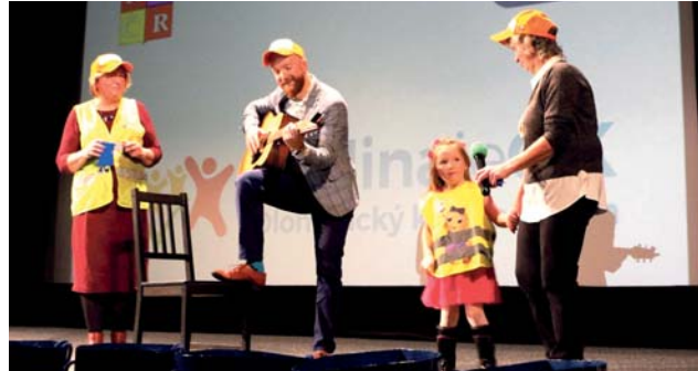
Pěvecká soutěž spojila generace. Určená je pro prarodiče s vnučaty, ke kterým se mohou připojit také rodiče dětí.

„Výběr skladby byl v režii soutěžících. Zazněly lidové písně, vánoční koledy i vlastní tvorba. Všichni soutěžící podali obdivuhodný výkon. Vybrat vítěze bylo nesmírně těžké. Skvělá byla také atmosféra v sále,“ řekl náměstek