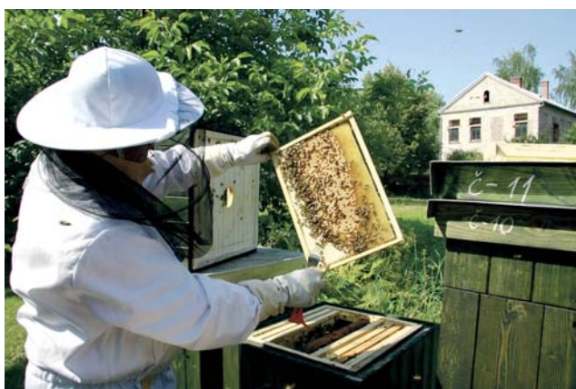
O příspěvek na chov mohou kromě nových včelařů žádat i ti stávající.

Příjem žádostí bude zahájen 20. ledna. Maximální výše dotace poskytnuté na jednu akci je limitovaná částkou deset tisíc korun. (red)