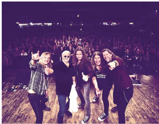
I v 71 letech to umí Ian Paice (v brýlích) pořádně rozjet, jak se v únoru přesvědčí jeho fanoušci v Šumperku.

Na studiových albech hrál Paice například se zpěváky jako je Paul McCartney, David Gilmour (Pink Floyd) nebo třeba se skupinou The Velvet Underground. Bubeník hrající jako jeden z mála s levorukou bicí soupravou svůj velký talent ukázal i během téměř devítiminu-