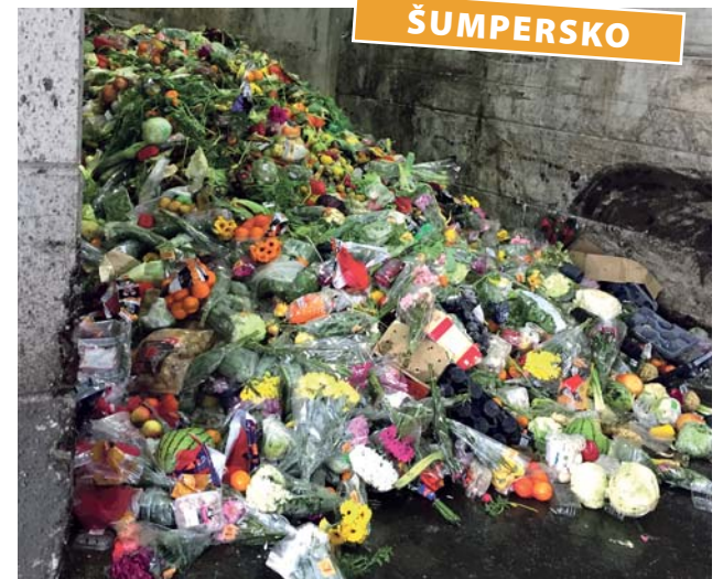
Velkou výhodou rapotínské technologie je možnost prvotního zpracování bioodpadu a zbytků i s obaly.