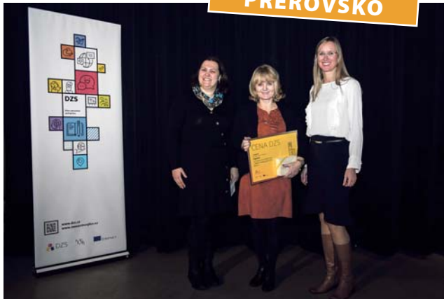
Mezinárodní projekt přerovských škol hledal cestu k podpoře a začlenění znevýhodněných žáků do vzdělávacího procesu.