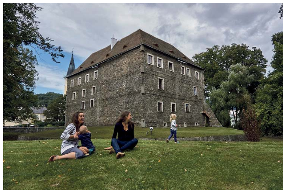
Zavedení 5G sítě pomůže zbrzdít vyhlídkování regionu. Využívat by ji mohli i turisté.

Jak produktivní může být spolupráce Olomouckého kraje, místní samosprávy i Senátu dokazuje úspěch Jeseníku. Ten se jako jedno z pěti míst v Česku zapojí do pilotního programu na testování 5G sítě. Projekt vyhlásilo Ministerstvo průmyslu a obchodu ve spolupráci s Ministerstvem pro místní rozvoj. Nová technologie přinese například super rychlý internet, holografické telefonní hovory nebo zdokonalení robotů.