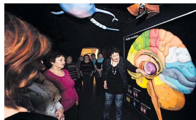
Dvanáct lekcí programu Blízká setkání 3. věku určených seniorům začíná 17. února.

Cena za jednoho účastníka je 1 400 korun. Manželské páry mají slevu 1 100 na osobu. (red)