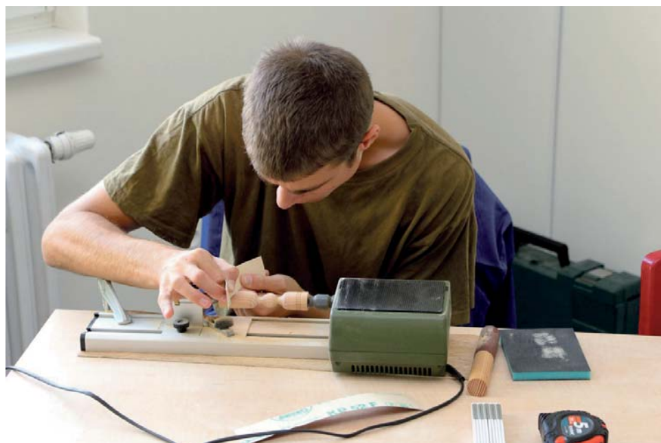
Žáci středních škol na Jesenícku si od příštího školního roku mohou přilepšit jednorázovými stipendii.

Na školách navíc přibudou obory, po jejichž absolventech je poptávka na trhu práce a které z atraktivní nabídku těchto vzdělávacích zařízení. Například na SOŠ a SOU stro-