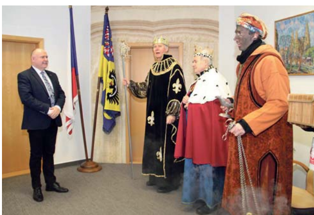
Výsledky Tříkrálové sbírky lze sledovat na webu www.trikralovasbirka.cz .

Sbírka probíhala od 1. do 14. ledna po celém Česku. Její výsledky budou postupně zveřejňovány na webových stránkách www.trikralovasbirka.cz . Zhruba dvě třetiny výtěžku zůstávají v regionu, část jde na pomoc do zahraničí. (red)