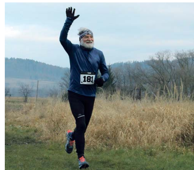
230 běžců je dosud nejvyšší počet účastníků Vikýřovické 12. Měnil se i zatím nejlepší čas, nově má hodnotu 43:29 minut.

V cíli byl zájemcům vypsán originální pamětní list a pochutnali si na již tradičním guláši a speciální edici piva Vikýřovická 12 – polotmavý běžák. Příjemné počasí udrželo závodníky a diváky na místě až do odpoledních hodin, kde diskutovali o parádně stráveném silvestrovském dnu. (red)