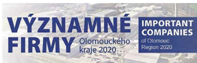
Už páté vydání katalogu obsahuje přes 175 firem z regionu.

Hledáte zaměstnání nebo jiný obor, ve kterém chcete najít uplatnění? Jste investor, který zjišťuje, jak nejlépe zhodnotit peníze? Pak sáhněte po nové publikaci Významné firmy Olomouckého kraje 2020, kterou v těchto dnech vydalo hejtmantství.