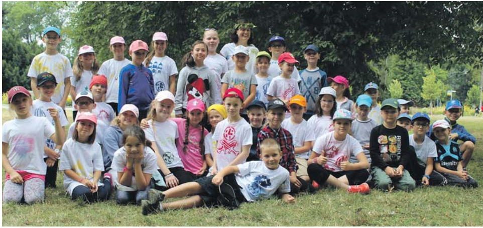
Univerzitní příměstské tábory dětí vzdělávaly v technice, informatice i historii.