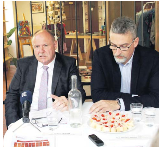
„Otevřeme těm, kteří chtějí, cestu k normálnímu životu,“ řekl k problematice bezdomovectví hejtmán Okleštěk na setkání s Charitou Olomouc. Vpravo olomoucký primátor Miroslav Žbánek.

„Stále hledáme východiska, která by přinesla kýžený efekt. Pokud bychom to po celou dobu už v minulosti nedělali, Olomouc by dnes pocítila bezdomovectví jako mnohem palčivější problém,“ sdělil ředitel Charity Olomouc Petr Prinz. (red)