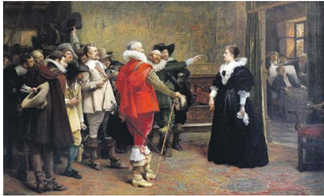
Polyxena z Lobkovic ochraňuje ve svém domě královské místodržící Slavatu a Martinice, svržené z oken královského hradu v Praze roku 1618 od Václava Brožíka.

Václav Brožík se narodil 5. března 1851 a patřil ke generaci umělců Národního divadla. Pocházel z početné rodiny a velmi chudých poměrů a nic nenásledovalo tomu, že by ho čekala tak zá-