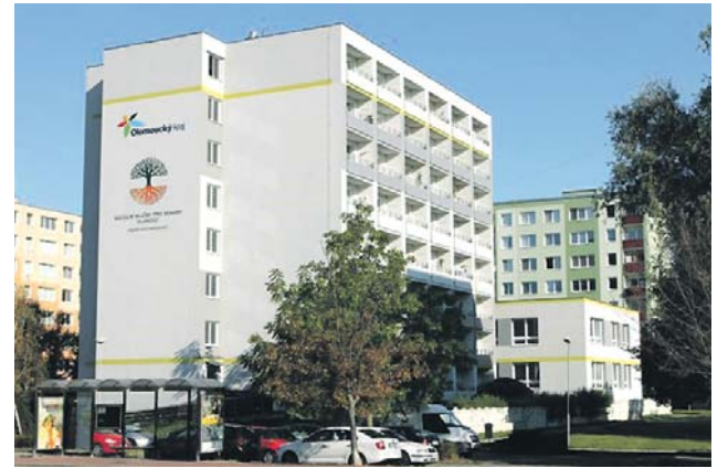
Sociální služby pro seniory Olomouc.

- Chráněné bydlení na adrese Zikova 14, Olomouc - Pečovatelská služba na adrese Zikova 14, Olomouc. Zájemci se mohou obrátit také na zaměstnance pečovatelské služby, kteří budou k dispozici v Domech s pečovatelskou službou: Politických vězňů 4, Příčná 6, Fischerova 4 a Přichystalova 68