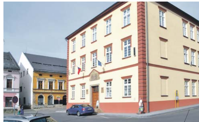
Vedení Štítů se podařilo sehnat zubaře, teď chce pediatra.

„Štíty už investovaly do rekonstrukce zdravotního střediska a stomatologické ordinace nemalé finanční prostředky. Kraj městu pomůže s pořízením dalšího moderního vybavení. Jediný podobný rentgen je dosud od Štítů šestnáct kilometrů daleko,“ odůvodnil poskytnutí dotace Dalibor Horák,