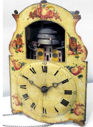
Charakteristický automat.

Výstava je také doplněna ojedinělým celodřevěným věžním hodinovým strojem z kostela z Žiliny u Nového Jičína zapůjčeným Mu-