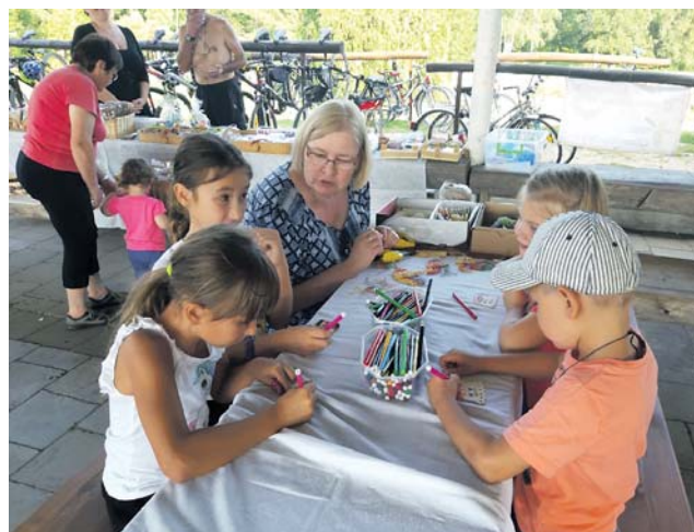
Akce na Poděbradech nedělala rozdíly podle věku.