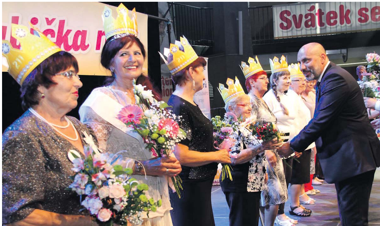
Olomoucký kraj inspiroval zbytek republiky a „jeho“ soutěž Babička roku je tak letos poprvé celostátní akcí.

Cílem akce Babička roku je posílení mezigeneračních vztahů, propojení trávení volného času celé rodiny a ukázka lidské hodnoty a pravé vnitřní krásy člověka v seniorském věku. V Olomoucké kraji už známa přehlídka proběhne poprvé formou krajského kola 19. září na Výstavišti Flora Olomouc. Kategorie budou tři: Babička roku Olomouckého kraje 2019, Babička sympatie a Nejstarší babička.