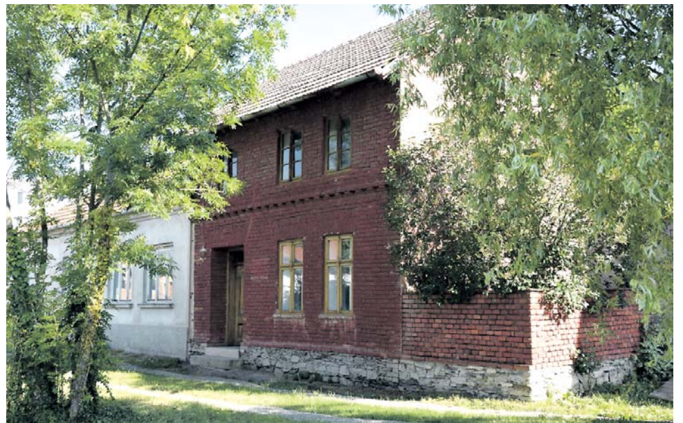
Olomoucký kraj nechá opravit takzvaný červený domek v Kostelci na Hané na Prostějovsku, ve kterém žil a tvořil básník Petr Bezruč.

Zelenou dostala také realizace stěhování knihovního fondu depozitáře Vědecké knihovny v Olomouci, rekonstrukce domku Petra Bezruče