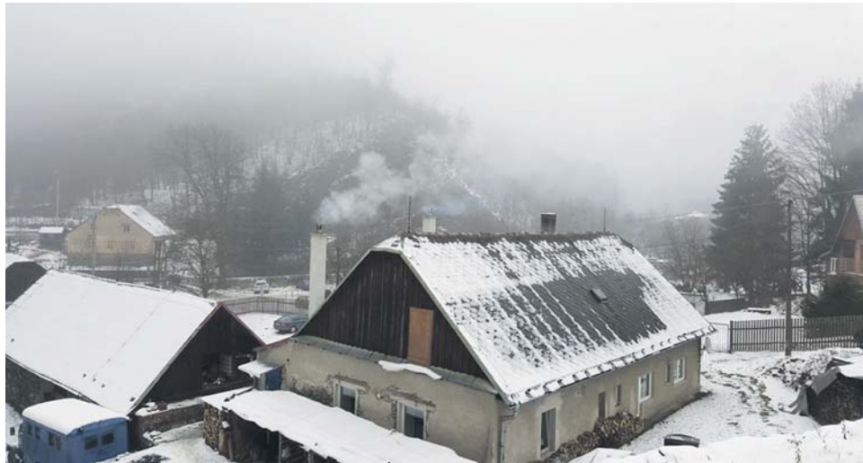
Další možnost žádat o příspěvek na výměnu kotle bude příští rok.

„Vzhledem k tomu, že aktuálně jsou pracovníky oddělení administrace