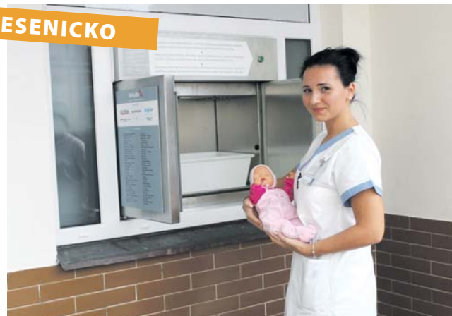
Schránku zaplatili zejména dárci.

Schránka pro odložené děti funguje od úterý 16. října v nejsevernější části Olomouckého kraje. Babybox, v rámci republiky v pořadí už pětasedmdesátý, je umístěn na snadno dosažitelném místě při vstupu do Jesenické nemocnice.