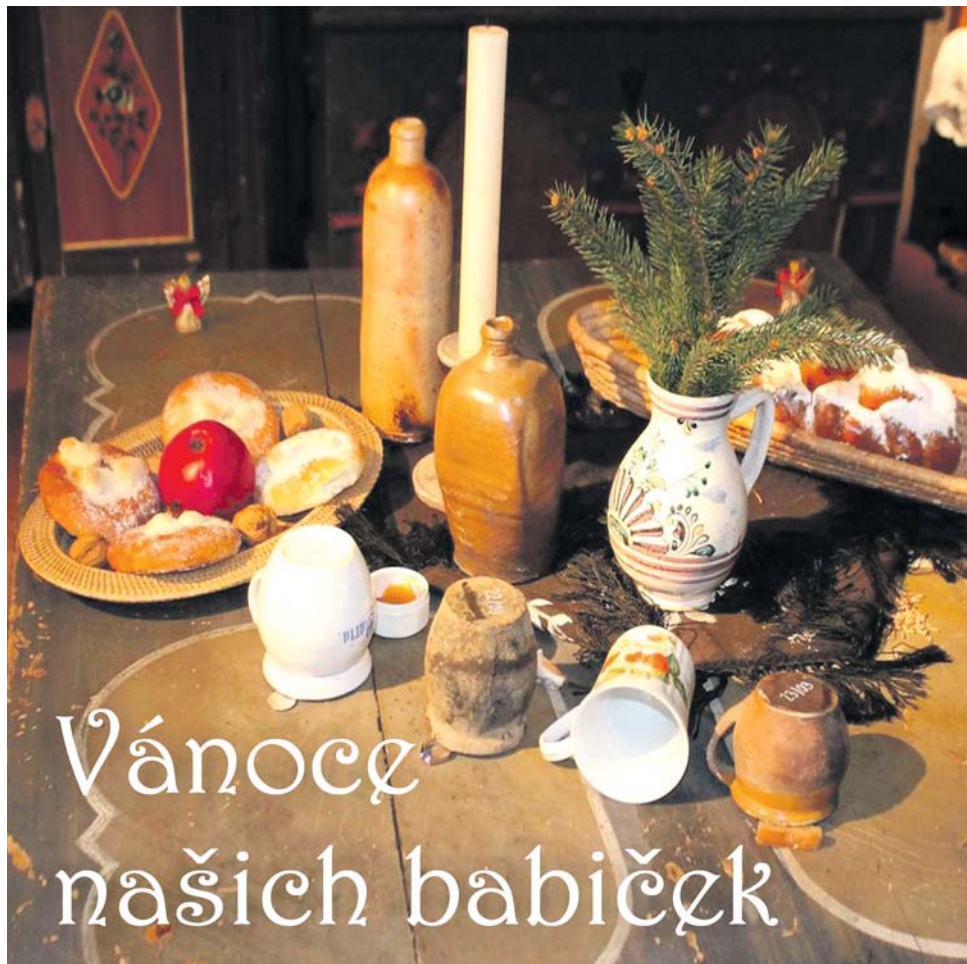
Naladit se pomalu na vánoční náladu mohou návštěvníci Vlastivědného muzea Jesenicka.

K vidění bude i jesnický betlém z přelomu