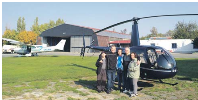
Klienti olomouckého Klíče navštívili neředínské letiště.

Sportovního ducha uplatnili zúčastnění při závodě přesného seskoku na tréninkovou podložku s měřením přesnosti. Nechyběla ani prohlídka hangáru a různých letadel. Letečtí nadšenci si mohli vyzkoušet polet v kabině letadla před seskokem padákem. „Protože počasí ukázalo svou vlídnou tvář, viděli na vlastní