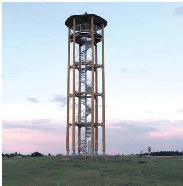
Na vrchol rozhledny Kopaninka vede 83 schodů.

Rozhledna první návštěvníky přivítá na začátku prosince. V provozu