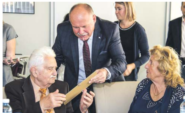
Krajský příspěvek mohou obdarovaní využít na nákup zdravotních pomůcek, léků nebo potravinových doplňků.

Peníze kraj rozdělí mezi lidi, na kterých se léta stravená v nacistických lágrech tvrdě podepsala. Prostředky mohou využít nejen na nákup zdravotních