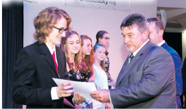
Náměstek hejtmana pro oblast školství Ladislav Hynek gratuloval mladým lidem, kteří dělají dobré jméno regionu.

Ve středu 17. října proběhlo v Regionálním centru Olomouc slavnostní vyhlášení 14. ročníku ocenění Talent Olomouckého kraje 2018. Ohodnocení nejlepších žáků a studentů, kteří dosáhli mimořádných výsledků v krajských, celorepublikových i mezinárodních kolech soutěží a přehlídek, je jednou z forem, jak hejtmanství podporuje talentovanou mládež v regionu.