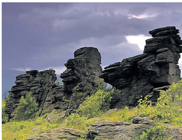
Obří skály v Jeseníkách na snímku Pavla Dačického.

„Fotograf chce ukázat, že země není zatím zpustošená, ale že jsou místa, kde žijí ve vzájemné symbióze zvířata, rostliny i lidé,“ uvádějí pořadatelé. (red)