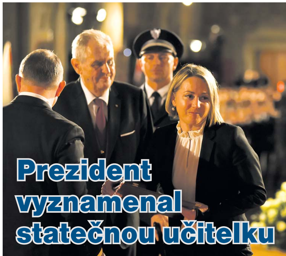
Prezident Miloš Zeman udělil Darině Nešporové 28. října na Pražském hradě medaili Za hrdinství. Učitelku z mateřské školy v Jívové na Olomoucku ocenil za záchranu života čtyř dětí. Více k tématu čtěte v rozhovoru na straně 5.

Žádat o dotace na krajském úřadu bude příští rok ještě jednodušší.