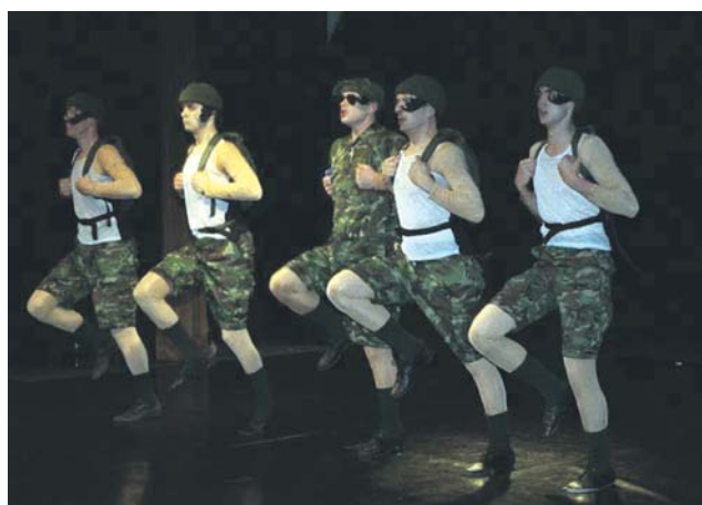
Divadelní hra Ze života obtížného hmyzu.

Začátek je v 19 hodin. V předprodeji stojí vstupenky 200 korun, na místě 250 korun. Dětské vstupné je za 50 korun. (red)