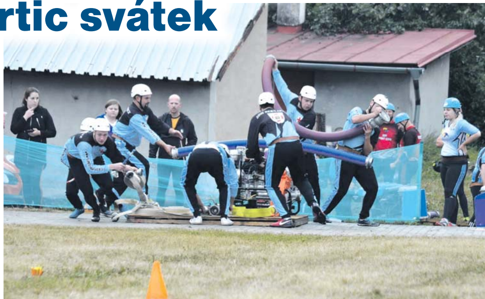
Členům SDH Bernartice požární sport jde. Mladí hasiči byli v kraji ve hře Plamen devátí.

V současnosti mají Bernartičtí 85 členů (31 dětí, 26 mužů a 28 žen). Sbor plní čtyři základní úlohy: výchovnou a vzdělávací, hasičskou činnost, kulturní a společenskou a sportovní. „Letos se členové zásahové jednotky aktivně podíleli na oslavách sta let založení Československé re-