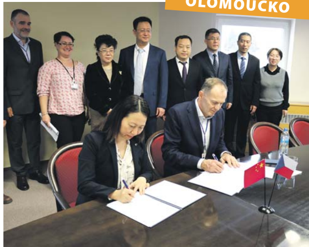
Nemocnice ve Fu-čou a v Olomouci podepsaly spolupráci.

Odborníci na tradiční čínskou medicínu odhalili v Olomouci zájemcům tajemství akupunktury i dalších léčebných technik. V BEA centru stálé znalosti přiblížili lékaři z Přidružené lidové nemocnice při Univerzitě tradiční čínské medicíny ve Fu-čou z provincie Fujien, kteří přijeli na pozvání Olomouckého kraje. Ten má s čínskou provincií uzavřené partnerství.