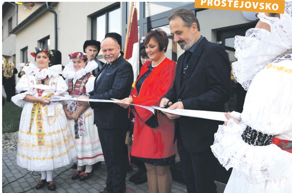
Část prací na sokolovně pokryla nová krajská dotace na opravu sportovišť.

Obyvatelé Tištiny se mohou těšit z opravené sokolovny. Ta bude sloužit nejen pro sportovní vyžití, ale také ke společenským a kulturním akcím. Náročnou rekonstrukci staré budovy z části financoval Olomoucký kraj. V letech 2017 a 2018 investoval do projektu zhruba čtyři a půl milionu korun.