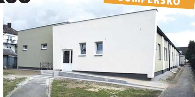
Letošní úprava kuželny zahrnovala i zateplení fasády.

Kuželkáři ze Zábřeží budou už za pár měsíců hrát v nové kuželně. Od minulého roku budovu v areálu městského stadionu spravují dělníci. Zbývá poslední ze tří etap.