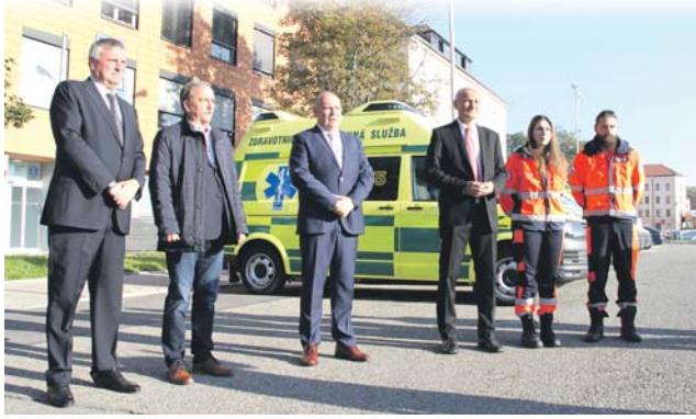
Dohromady hejtmánství letos a v příštích dvou letech pořídí třicet nových sanitek za 61 milionů korun.

D eset nových sanitek si 5. října převzala záchranná služba Olomouckého kraje. Moderně vybavené automobily zamíří na Olomoucko, Přerovsko, Prostějovsko, Jesenicko a Šumperko.