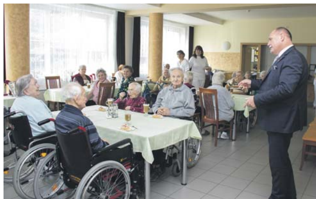
Olomoucký kraj na starší obyvatele nezapomíná. Aktuálně pro ně připravil rozsáhlý projekt Podpora aktivního života seniorů.

O podporu mezigeneračních vztahů se postarají neformální setkávání a společné trávení volného času mezi seniorskou a mladou generací a dále pak aktivity, které se zaměřují na propojování institucí pro odlišné věkové skupiny. Příkladem mohou být mezigenerační říjnová procházka a talentová soutěž ve zpěvu a recitaci pěveckých dvo-