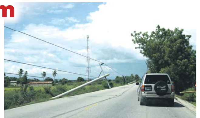
Dvoučlenný tým vyslaný na Haiti Arcidiecézní charitou Olomouc zažil zemětřesení.

Na co všechno musí být tým připraven? „Kdykoliv nás mohou překvapit různé demonstrace a blokády. Na-