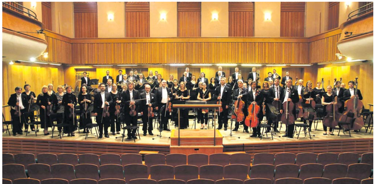
Každoroční říjnová vystoupení olomouckých filharmonií jsou tradicí sahající do roku 2009.