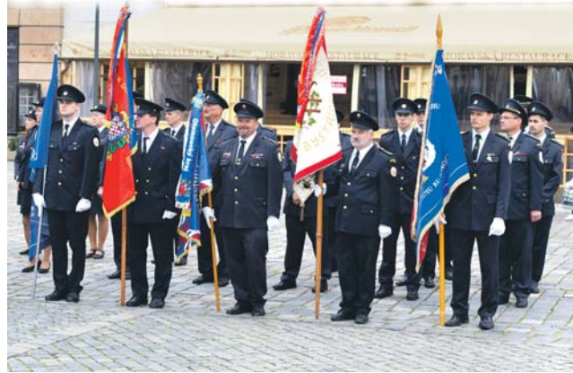
Dobrovolní hasiči udržovali kulturní a společenský život na vesnicích za všech režimů.

Horní náměstí v Olomouci bylo v sobotu 22. září plné hasičů. Naštěstí tam nevyjeli k zásahu, ale kvůli připomínce 100. výročí založení Československa. Na místě se prezentovaly dobrovolné sbory z celého Olomouckého kraje.