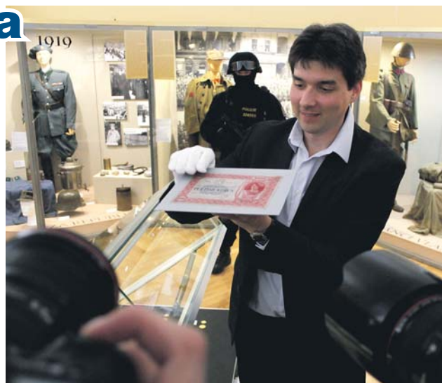
Součástí výstavy je také pětitisícová bankova z roku 1919.

Druhá z výstav je věnována dílu a životnímu odkazu jednoho z našich nejvýraznějších a nejvšestrannějších výtvarných umělců první poloviny 20. století, Vojtěcha Preissiga. Ten je znám zejména jako tvůr-