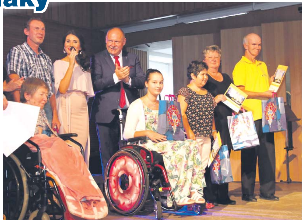
Hendikepovaní umělci soutěžili například ve zpěvu, hudbě nebo tanci.

Diváci mohli letos sledovat nejen prvotřídní pěvecká, hudební nebo taneč-