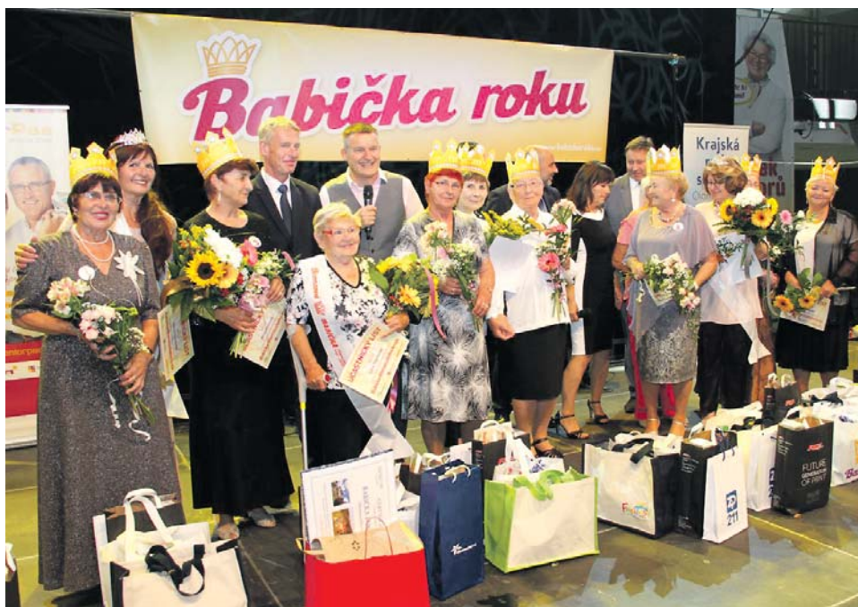
Dvanáct letošních finalistek. O krajskou soutěž babiček je každý rok velký zájem.