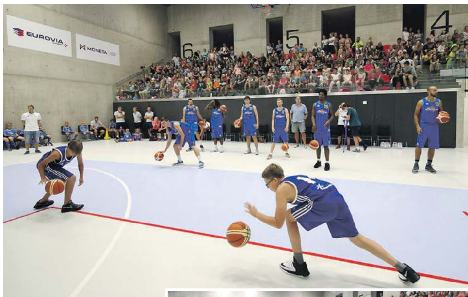
Národní sportovní centrum Prostějov může hostit turnaje v basketbalu, tenisu a volejbalu.

Třípodlažní objekt haly, který vyrostl na okraji Prostějova vedle zimního stadiónu, ukrývá sportoviště pro řadu disciplín. Konat se tu mohou také volejbalové, basketbalové či tenisové turnaje. Nechy-