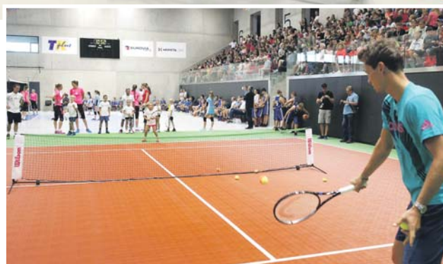
Otevření nového prostějovského sportovního centra se zúčastnil i světový tenista Tomáš Berdych.