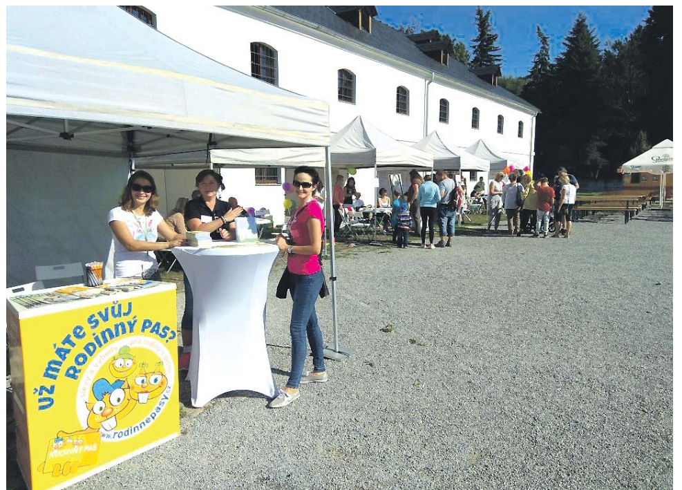
Akce věnovaná pěstounům měla velký ohlas. Pořadatelé napočítali na 450 zájemců.

Návštěvníci si mohli prohlédnout výstavu zaměřenou na pěstounství, zhlédnout filmy s tematikou náhradní rodinné péče, zapojit se do rodinné hry o ceny, poslechnout si hudební vystoupení nebo zhlédnout pohádku pro děti. Velkým zájem byl o besedy s pěstouny, kterých se mohli lidé zeptat na vše, co je zajímalo. Stejně tak byli dospělým návštěvníkům