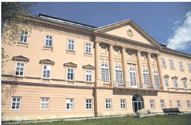
Se stavbou domů v Drahanovicích a Měrotíně začne hejtmanský příští rok.

Předloni se z Nových Zámků přemístilo prvních sedmáct klientů. Hejtmanský pro ně zakoupil a přestavělo budovy v Července, Drahanovicích a Uničově. (red)