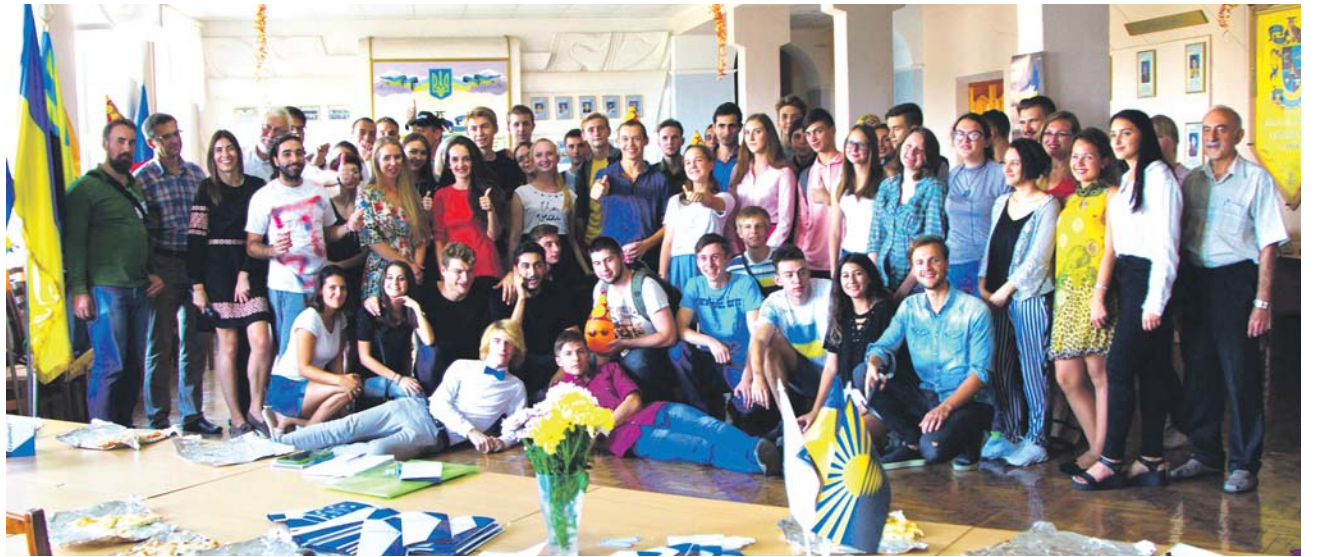
Členové přerovské organizace Czech Youth Association se účastnili prvního projektu Erasmus+ na Ukrajině.

V průběhu projektu byli mladí zástupci ze šesti evropských zemí ubytováni ve městě Kramatorsk, které se po obsazení Doněcku stalo hlavním městem dané oblasti. „Bohatý program obsahoval řadu přednášek a diskuzí s novináři, univerzitními profesory, zástupci neziskového sektoru i návštěvu místní mise OBSE. Zde pak proběhlo detailní se-