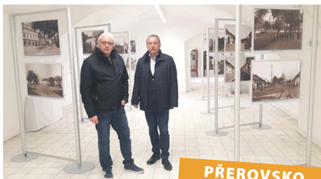
Na tovačovském zámku je k vidění vývoj města od počátku 20. století do čtyřicátých let.