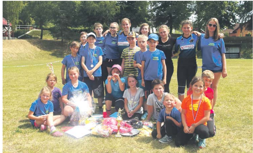
Ve sboru dobrovolných hasičů v Sudkově sportují i téměř dvě desítky dětí. Jedna z dorostenek to dotáhla až na mistrovství republiky.

Pro záchranu nešťastníka se nakonec musel použít člun. Statečné dobro-