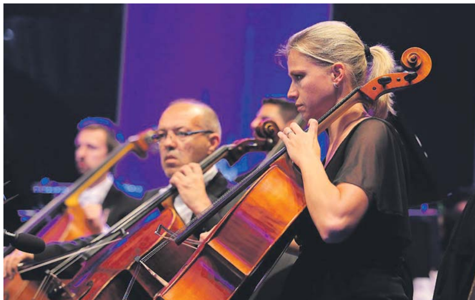
Sobotní vystoupení Košické státní filharmonie a hostů ukončila záhy průtrž mračen.

Sobotní vystoupení Košické státní filharmonie a jejich hostů ukončila po půl hodině průtrž mračen. Ačkoli hudebníci vystupovali pod přístřeškem