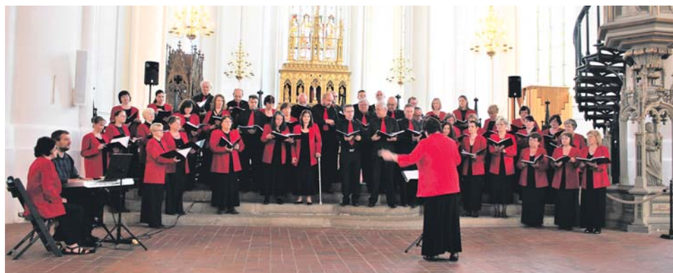
Sbor Collegium vocale Olomouc na německém turné.

Olomoucký pěvecký sbor Collegium vocale zazpíval na koncertním turné v Německu. Umožnila mu to mezinárodní výměna sborů. Češi nyní připravují návštěvu německého sboru Bremer Kantorei St. Stephani, který spolu s nimi zazpívá na přelomu září a října koncertů v Olomouckém kraji.