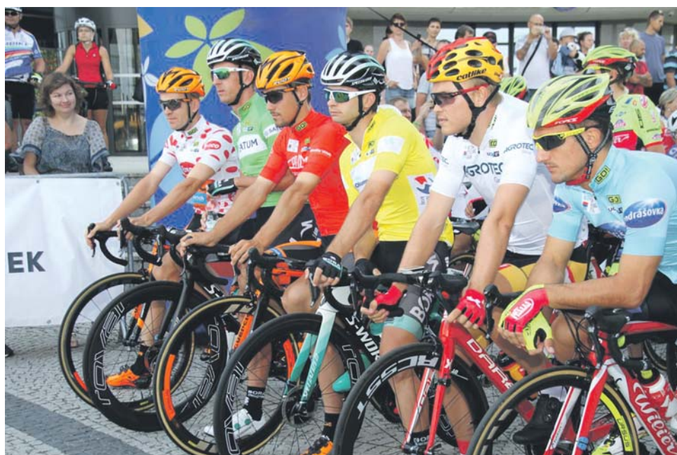
Účastníci Czech Cycling Tour na startu před krajským úřadem v Olomouci.