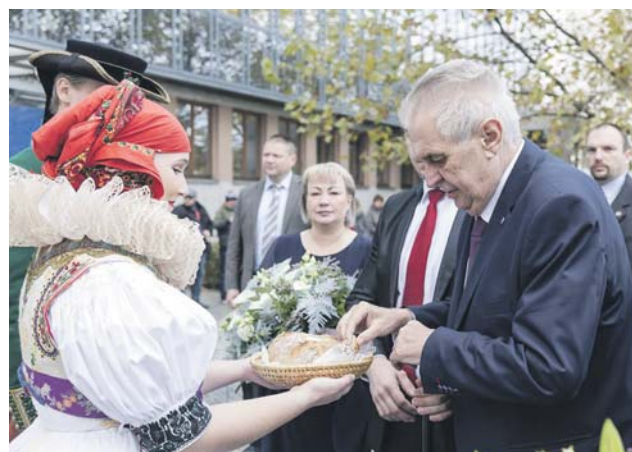
Olomoucký kraj uvítá prezidenta už po šesté.

lidé například v šumperském okrese i na Prostějovsku, ale také na Jesenicku nebo přímo v Olomouci. V plánu je i návštěva obce Luboměř pod Strážnou, kde získal Miloš Zeman ve druhém kole voleb 90 procent hlasů občanů. Během pobytu se také prezident republiky už tradičně setká i s podnikateli a významnými osobnostmi regionu. Návštěva prezidenta skončí na severu kraje, kde budou hejtmáni Olomouckého a Moravskoslezského kraje jednat o mezikrajské spolupráci.