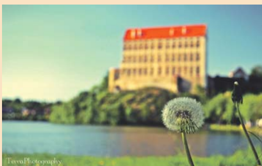
Plumlovský zámek.