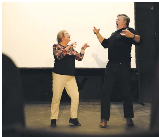
Lekce potrvají od podzimu celý rok.

První lekce začíná 20. září, roční kurzovné stojí 1 500 korun. (red)