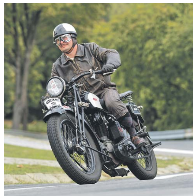
Ve Šternberku burácely i historické motorky.

Závody Ecce Homo Historic se ve Šternberku jezdí už více než deset let. Lidé na nich mohou pozorovat výkony řidičů cených historických automobilů a motocyklů z různých období. Soutěžní trať měří necelých pět kilometrů, široká je přitom vždy minimálně sedm metrů. (red)