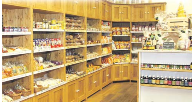
Cílem krajské dotace je zachovat na venkově základní služby.

M alé vesnické obchůdky zejíci prázdnou a určené k prodeji. Smutnou realitu některých míst v našem regionu chce řešit Olomoucký kraj. Nově totiž plánuje dotační projekt, který by ztrátové prodejny na venkově pomohl zachovat při životě.