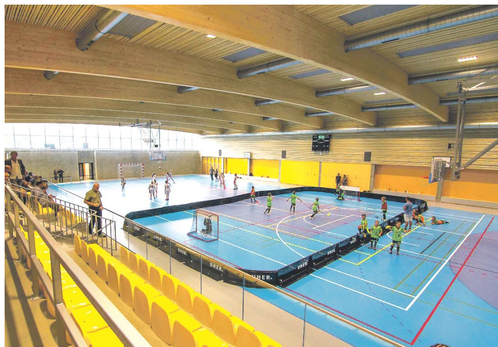
V září otevřená hala zabírá dva a půl tisíce metrů čtverečních.

Kraj investoval do stavby nového sportoviště v Lipníku nad Bečvou osmnáct miliónů korun.