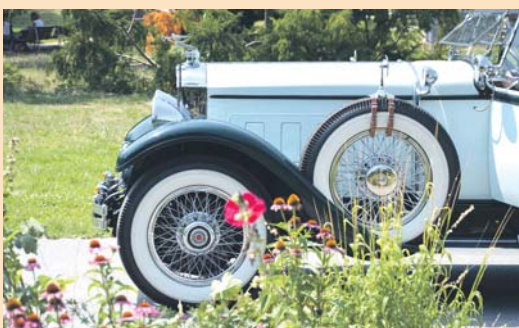
Vůz Packard 1929.