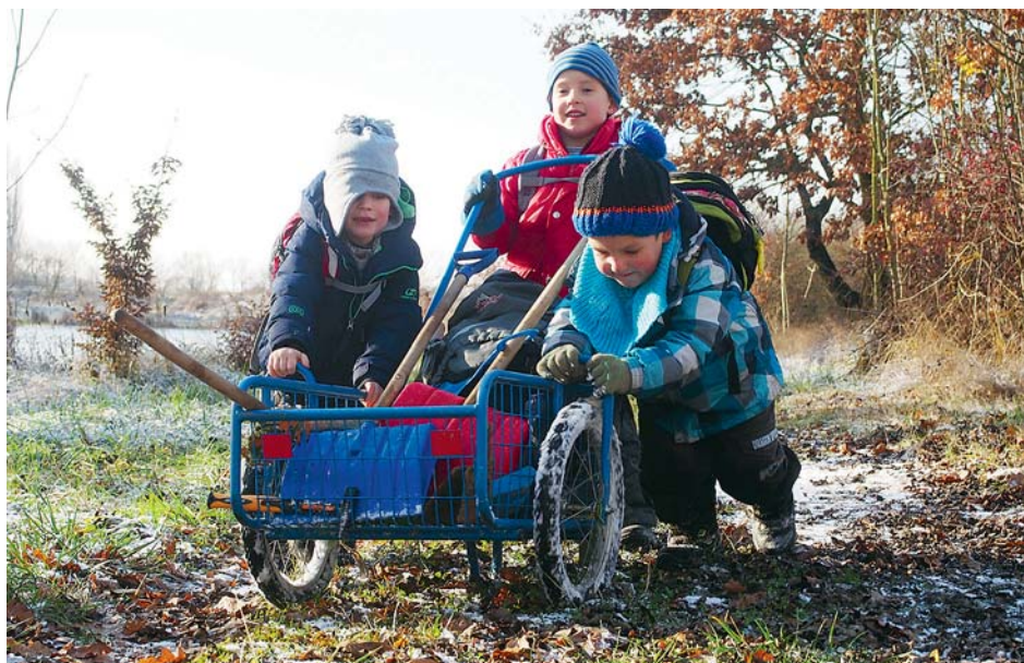
■ Návrat z dopolední výpravy.

B ažinka je „lesní mateřská školka“ pro děti od 3 do 6 let. Klub vznikl z iniciativy rodičů a pedagogů, kteří proto založili v roce 2013 občanské sdružení Rozvišť, které je nyní zapsaným spolkem. Cílem bylo vytvořit přátelské, komunitní prostředí vhodné pro zdravý vývoj dětí předškolního věku. Bažinka k dosažení svého cíle využívá nejen krásné prostředí CHKO Litovelské Pomoraví, na jehož hranici se nachází její zázemí nebo přilehlé pozemky Centra ekologických aktivit města Olomouce – Sluňákov, ale z velké míry je to respektující přístup tamních průvodců a inspirace původními myšlenkami Marie Montessori (především její princip „Pomoz mi, abych to dokázal sám.“).