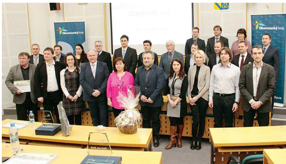
■ Zástupci všech zapojených měst a obcí při přebírání cen Zlatý erb v sídle Olomouckého kraje.

Její web zaujal porotu přehledností i dostupností informací. Cenu za nejlepší elektronickou službu získal Lutín, který lidem už deset let nabízí posílání zpráv z obecního rozhlasu na e-mail. V současnosti toho využívají na dvě stovky odběratelů. »red