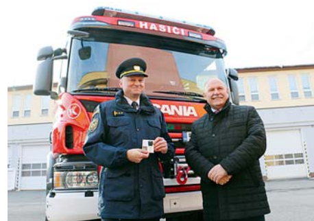
■ Hasiči cisternu převzali z rukou hejtmana 19. února.