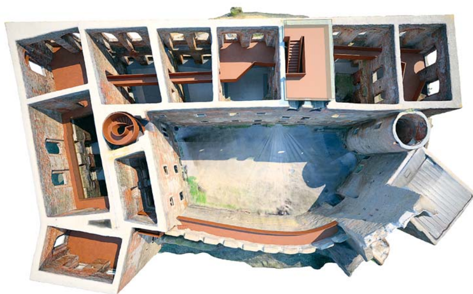
■ Vizualizace horního pohledu na palác hradu Helfštýn po rekonstrukci – vzniknou kovové pochozí lávky a galerie, část objektu bude zastřešena. Připravuje se nová expozice uměleckého kovářství.

Krajská rada se ve svém programovém prohlášení zavázala pokračovat v rekonstrukci areálu zámku v Čechách pod Kosířem a na záchranných pracích na hradě Helfštýn. Zámecký areál v Čechách pod Kosířem spadá pod Vlastivědné muzeum v Olomouci, které je příspěvkovou organizací kraje. Revitalizace zámeckých zahrad a rekonstrukce objektu započala v roce 2011