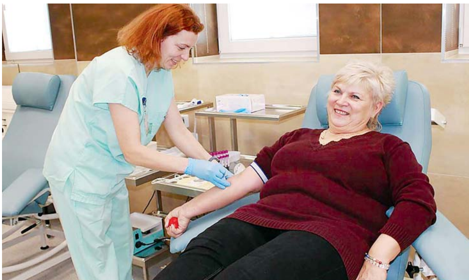
■ Díky modernizaci a změně dispozičního uspořádání objektu mají dárce i personál mnohem větší komfort během samotných odběrů a vyšetření.

Během rekonstrukce došlo ke kompletní výměně oken, vhodnějšímu rozložení pracovišť a zvýšení počtu odběrových lůžek ze čtyř na šest a pořízení nového vybavení. Po dobu stavebních prací fungovalo oddělení v náhradních prostorách.