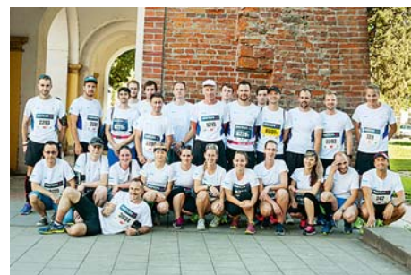
■ Zaměstnanci Koyo běželi olomoucký půlmaraton, registrace poplatky hradila firma.