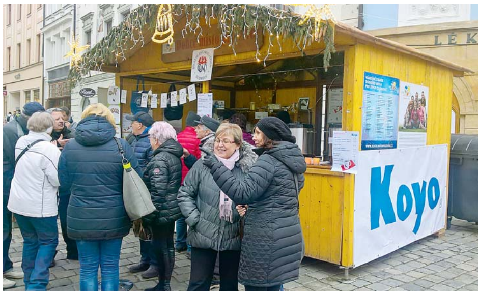
■ Stánek Dobrého místa pro život na náměstí v Olomouci, kde zástupci společnosti vařili punč. Výtežek za celý den putoval na Oblastní unií neslyšících.

S polečnost Koyo Bearings Česká republika s.r.o. sídlí v Olomouci a je součástí japonské nadnárodní JTEKT Corporation. Olomoucký závod na výrobu ložisek byl založen v roce 2001, dnes zaměstnává 530 kmenových zaměstnanců. Během své existence obdržel řadu významných ocenění včetně pětinasobného titulu zaměstnavatel Olomouckého kraje. Dvakrát se stal dodavatelem pro auto roku v ČR, v roce 2014 obdržel ocenění Společnost přátelská rodině, v roce 2016 národní cenu Odpovědná firma České republiky, v roce 2017 cenu za 2. nejlepší personální projekt v ČR a certifikaci Bezpečný podnik.