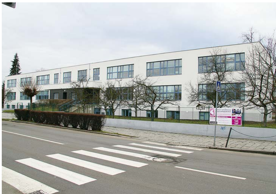
■ Budova Gymnázia Jana Blahoslava a Střední pedagogické školy v Přerově byla postavena v roce 1933. Má zajímavou historii a je kulturní památkou.

vštěvuje více než osm stovek studentů. Vedení vzdělávacího zařízení teď připravuje projekty, v jejichž rámci