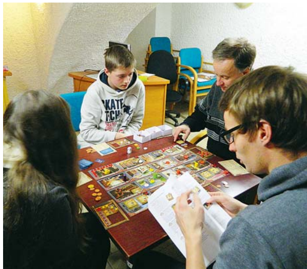
■ Knihovny už nejsou jen půjčovnami knih, ale i místem setkávání lidí se společnými zájmy. Například Knihovna města Olomouce má i vlastní Klub deskových her.

„Peníze na zajištění regionální funkce knihoven představují další smysluplnou formu podpory, kterou Olomoucký kraj směřuje do oblasti kultury,“ informoval náměstek hejtmana František Jura, který smlouvy o podpoře knihoven za Olomoucký kraj podepsal. Finance pomohou udržet chod zhruba pěti stovkám obecních a sedmi městským knihovnám. Nejvyšší příspěvek obdrží Vědecká knihovna v Olomouci, která regionální funkci knihoven koordinuje. »red