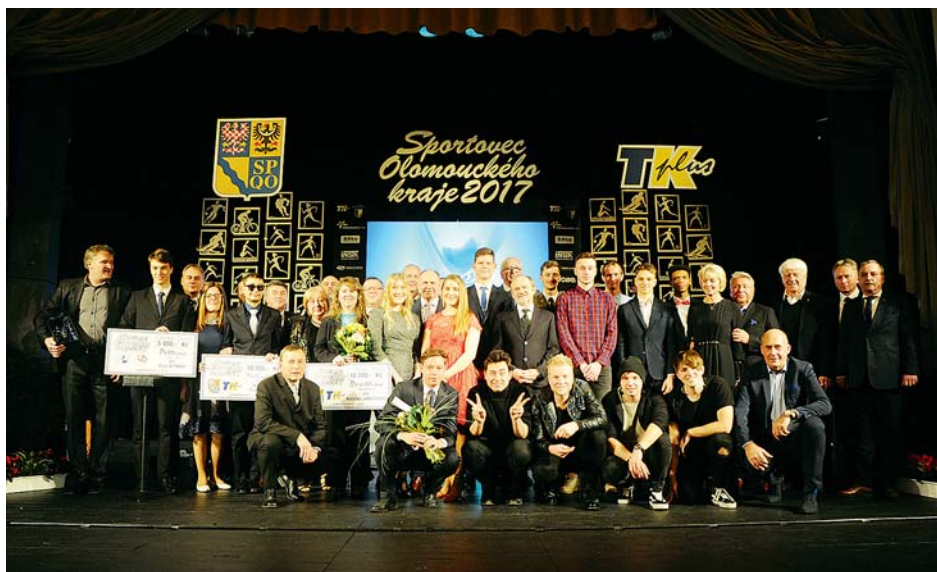
■ Ocenění sportovci Olomouckého kraje při slavnostním přebírání cen v prostějovském divadle.

U ž posedmnácté udělil Olomoucký kraj ceny nejlepším sportovcům regionu. Loňskou vítězku – tenistku Petru Kvitovou, vystřídala jiná tenistka – Lucie Šafářová. Ta se ale nemohla zúčastnit slavnostního předání cen 7. února v prostějovském divadle, protože se s fedcupovým týmem připravovala na další zápasy v Praze.