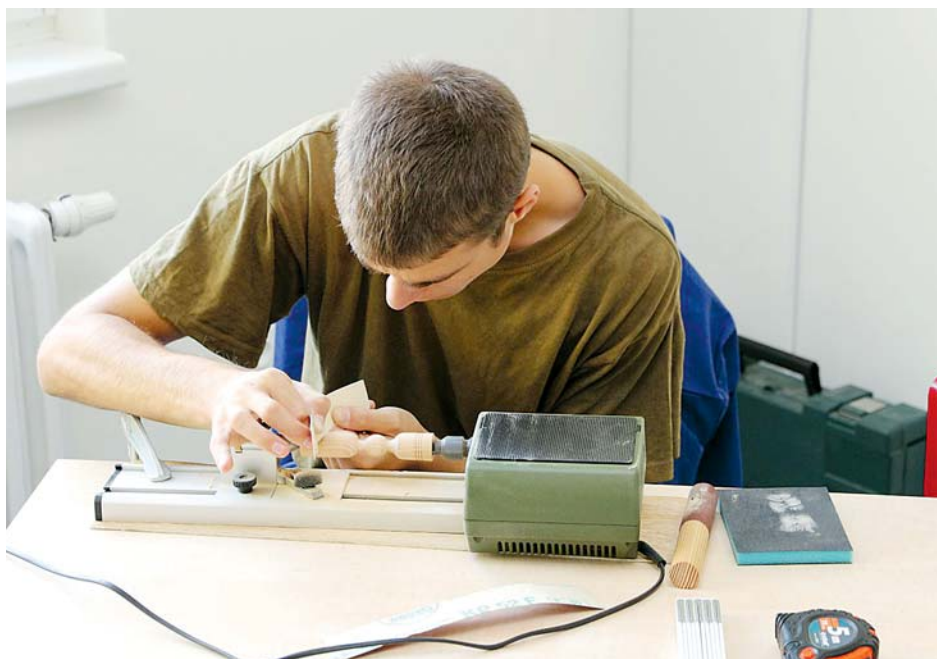
■ Podmínky udělení stipendia se liší v závislosti na tom, zda jde o učňovský nebo maturitní obor. Výše odměny se odvíjí například od prospěchu, chování a šikovnosti žáků v praktické výuce.

Výběr střední školy ovlivní nejen následujících několik let studia, ale do značné míry celý život. Při výběru profese by se měli žáci zajímat nejen o samotné studium, ale především o budoucí uplatnění na trhu práce. I v našem kraji totiž dlouhodobě existuje nepoměr mezi požadavky trhu práce a studijními preferencemi mladých lidí. Na jedné straně tak školy produkují absolventy oborů, kteří mohou mít problém s nalezením práce v daném oboru, a na straně druhé v některých odvětvích dlouhodobě chybí kvalifikovaná pracovní síla. Olomoucký kraj proto už osmým rokem poskytuje žákům vybraných oborů motivační