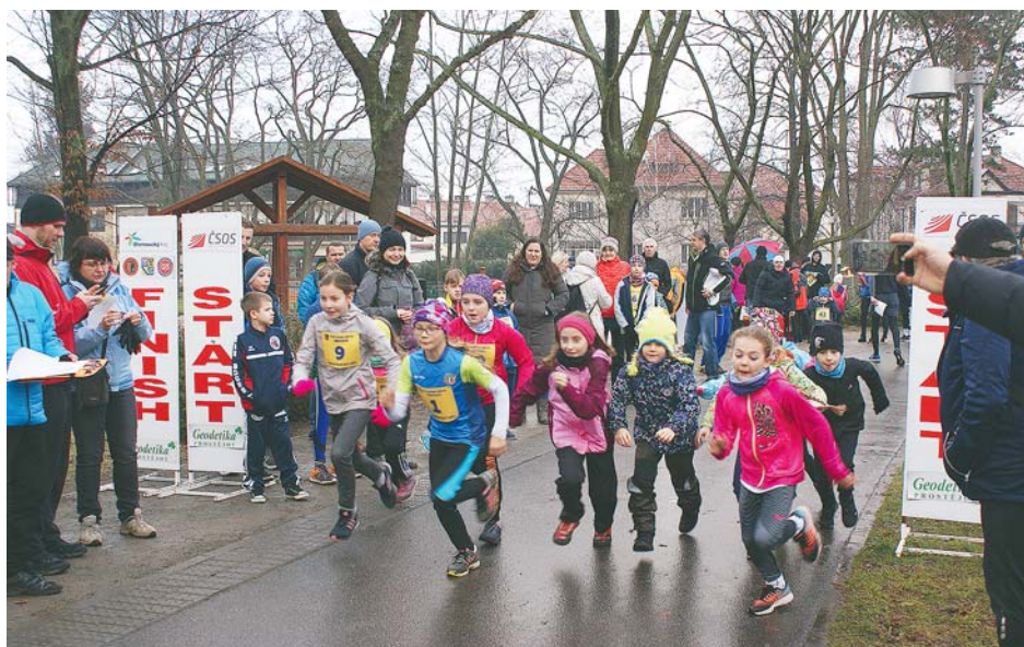
■ Letos poprvé kraj připravil cílené dotační programy pro všechny sportovce.

Dotace z krajského rozpočtu jsou poskytovány v souladu s prioritami krajské samosprávy a ve shodě se záměry Rady Olomouckého kraje pro období 2016–2020. Cílem poskytování dotací je rozvoj Olomouckého kraje a uspokojování všestranných potřeb jeho obyvatel. „Dotační programy v rozpočtu na rok 2018 jsou proti schválenému rozpočtu roku 2017 vyšší o zhruba 59 milionů korun. Snažíme se, aby nabídka dotačních titulů odpovídala současně poptávce,“ přiblížil plánování krajských dotací hejtmán Ladislav Okleštěk. Velmi důležitým aspektem je pak zjednodušení systému dotací a postupu k jejich získání. Už nastavený je také zjednodušený a transparentní proces schvalování dotací – vše s cílem usnadnit žadatelům veškeré úkony spojené s podáním žádosti o krajskou dotaci. S dostatečným předstihem jsou připravené k nahlédnutí i vzorové smlouvy pro všechny typy žadatelů. Podstatnou změnou je zmírnění podmínek pro poskytová-