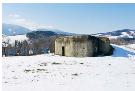
■ Vojenské bunkry patří k významným lákadlům v regionu.