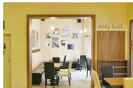
■ Kinokavárna a dětský koutek je součástí kina od roku 2011.