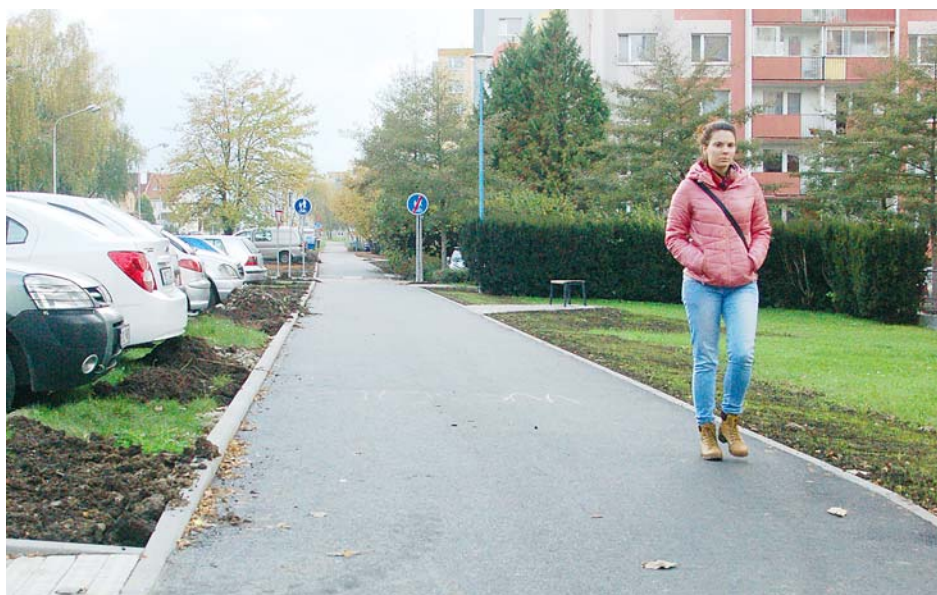
■ Na stavbu smíšené stezky přispěl loni kraj částkou 1,2 milionu korun například i město Olomouc.