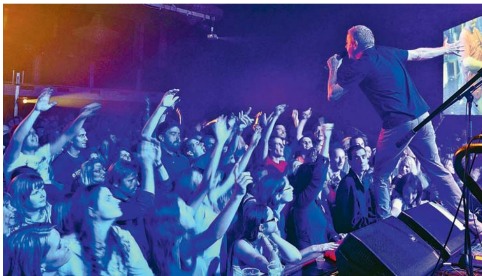
■ Bez finanční podpory Olomouckého kraje by se řada koncertů, festivalů a jiných společenských akcí nekonala. Na snímku tradiční Džemfest v Šumperku.