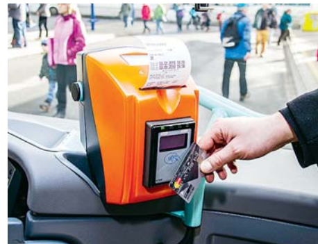
■ Bezkontaktní placení mohou využít lidé v Prostějově, Šumperku, Zábřehu a Přerově.

Cestující už mohou ve všech autobusech objednávaných Olomouckým krajem platit kartou. Bezkontaktní karty zároveň slouží jako nosiče časových jízdenek, například týdenní