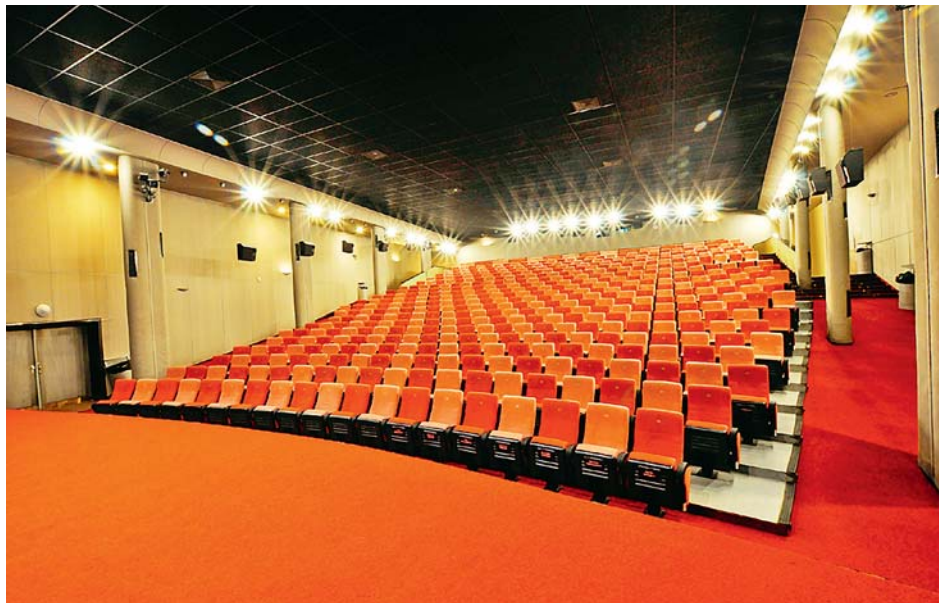
■ Kino Metropol je poslední klasické jednosálkové kino v Olomouci.

K ino Metropol, poslední klasické kino v Olomouci, se nachází v samém centru města, a to již od roku 1933. Od té doby mnohokrát změnilo své jméno, ale v žádném případě ne své poslání, bavit návštěvníky všech věkových kategorií prostřednictvím promítání klasických filmových projekcí a pořádání živých kulturních akcí.