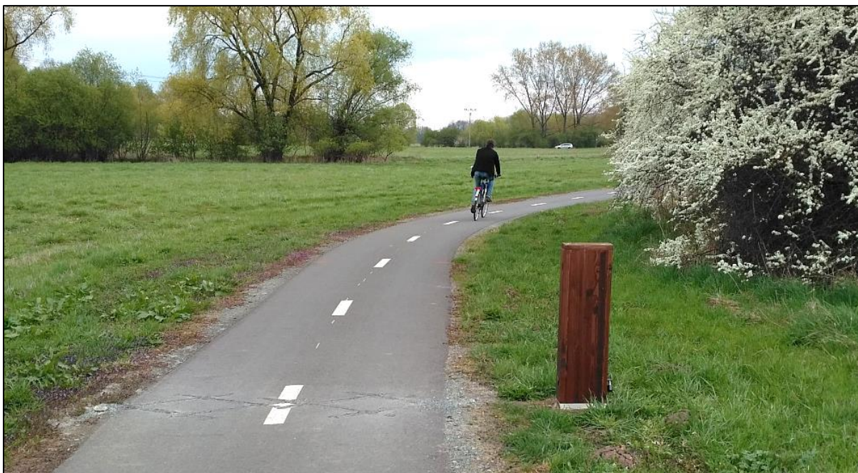
Foto: Ukázka sčítače v lokalitě Horka nad Moravou