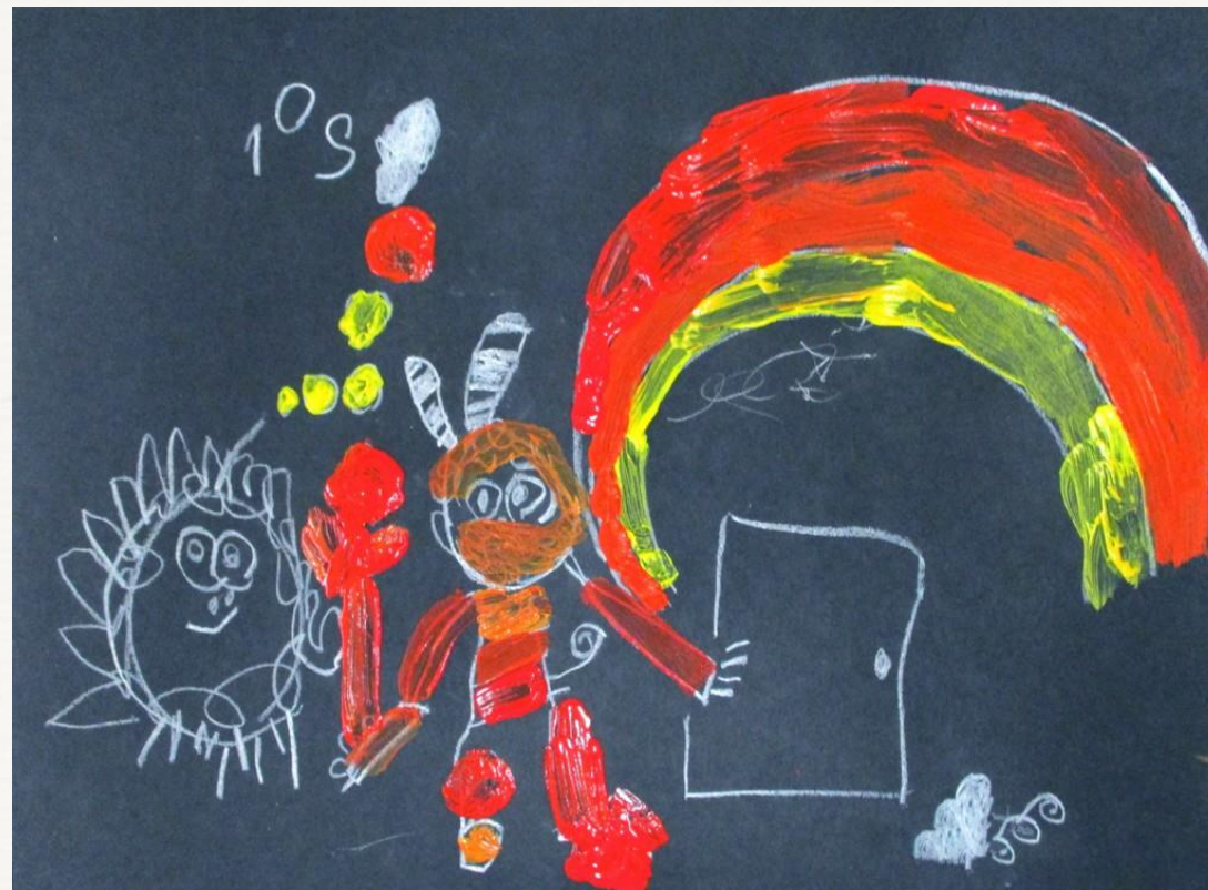
Dílo „Čert v pekle“.

Autor: Chlapec s diagnózou Aspergerův syndrom, 11 let