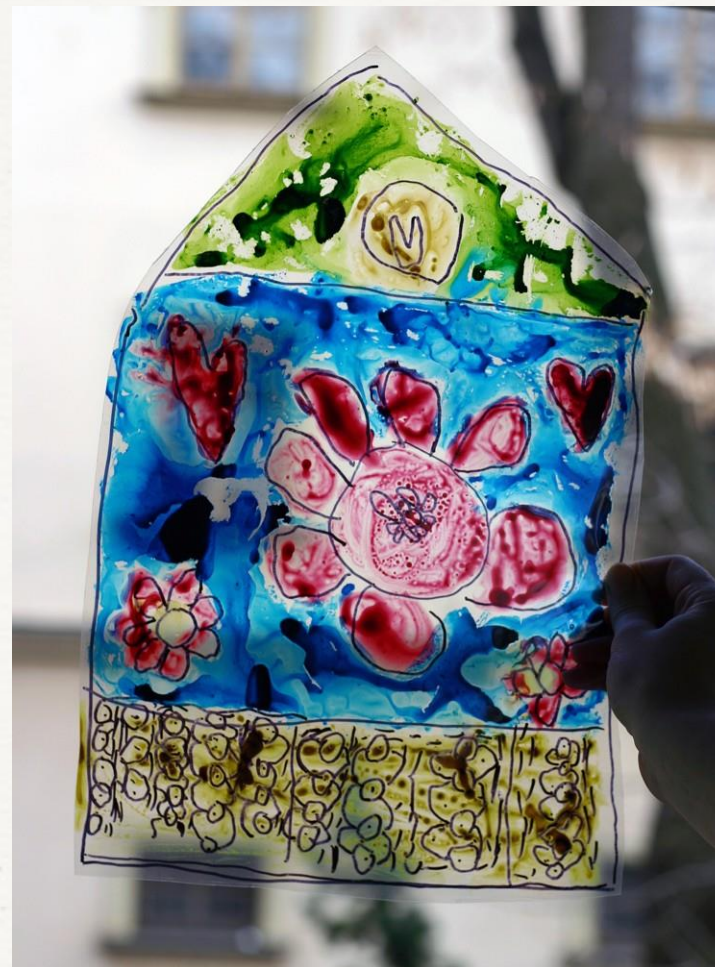
„Vitráž gotického okna“. Materiál: celofán, tuše, lamino. Autor: Dívka s diagnózou dětský autismus s expresivní dysfázií, 5 let