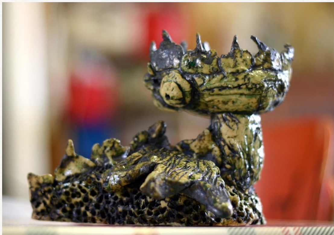
Keramický svícen ve tvaru draka. Materiál: keramická hlína, oxid mědi, glazura. Autor: Chlapec s diagnózou Aspergerův syndrom, 6 let