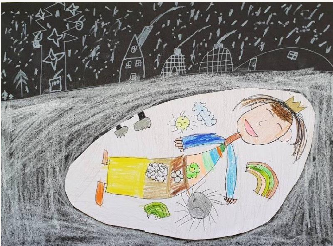
Obrázek s názvem „ Spící jarní víla “.

Materiál: pastelky, centropen, bílý lihový fix a giocondy.