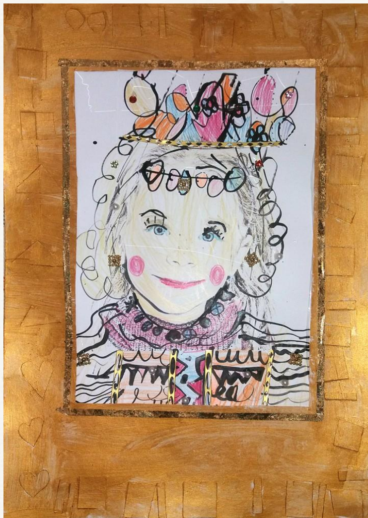
Výtvar s názvem „ Já královna “. Materiál: tuš, tempera, fixy a fotografie dítěte (vpravo porovnání s hotovým výrobkem dítěte bez postižení). Autor: Dívka s diagnózou dětský autismus s expresivní dysfázií, 5 let