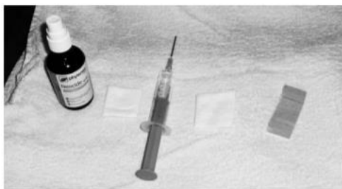
Ukázka předmětového procesuálního schématu