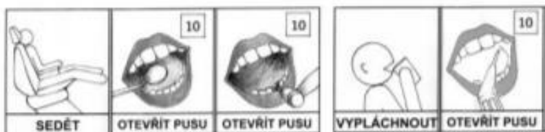
Ukázka procesuálního schématu ošetření zubů