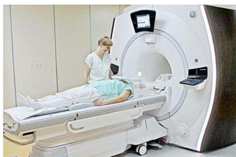
■ Nová magnetická rezonance v přerovské nemocnici začala sloužit pacientům v regionu na začátku roku.

Od prvního ledna začal v kraji leteckou záchrannou službu zajišťovat nový provozovatel – Slovenská firma ATE. Původní obavy ze starých typů vrtulníků Agusta se nenaplnily a během roční služby splnily veškeré požadavky na rychlý a bezpečný převoz pacientů a záchranářů. Od začátku svého působení do konce listopadu absolvovaly vrtulníky z olomoucké základny bezmála 450 vzletů na území Olomouckého, Zlínského a Pardubického kraje. Začátkem dubna také převzala Zdravotnická záchranná služba Olomouckého kraje osm nových sanitních vozů. Kraj na jejich pořízení uvolnil 24,5 milionu korun.