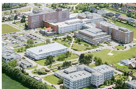
■ Pro hospicovou a paliativní péči vznikne v prostějovské nemocnici 25 specializovaných lůžek.

Oddělení hospicové a paliativní péče vznikne přestavbou starého objektu lůžkového prostoru nemocnice, projekt