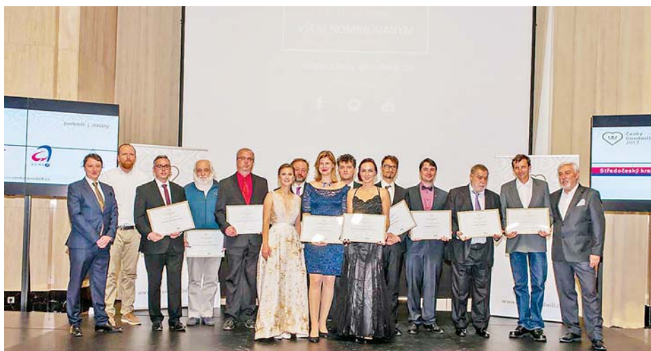
■ Kompletní sestava oceněných firem i jednotlivců, kterých si lidé váží.