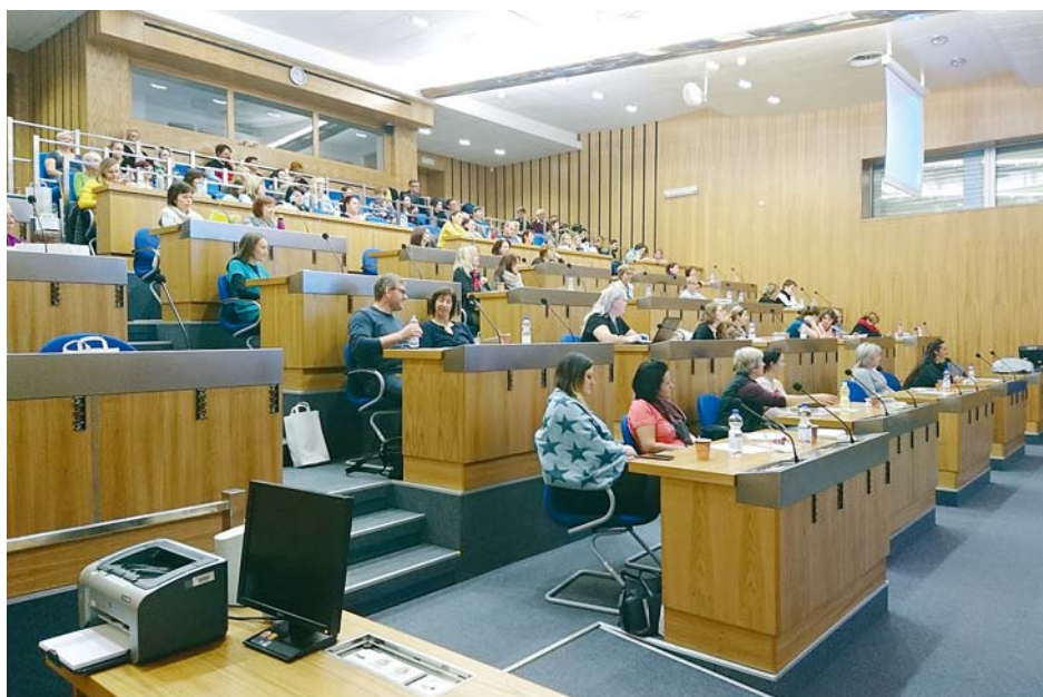
■ Konference o Alzheimerově nemoci se účastnila více než stovka odborníků i laiků.

Cyklus přednášek a referátů byl součástí projektu Podpora aktivního ži-