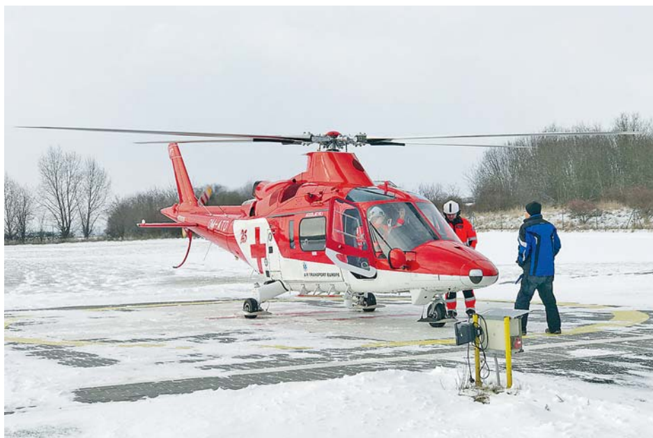
■ Od ledna zajišťuje po dobu čtyř let leteckou záchrannou službu v kraji nový provozovatel – slovenská firma ATE.

Na začátku roku byla dokončena dostavba specializovaného oddělení pro nemocné tuberkulózou v léčebném ústavu Paseka. Celkové náklady vyšly na téměř 32 milionů korun, 25 milionů z této částky hejtnanství získalo formou dotace od ministerstva zdravotnictví.