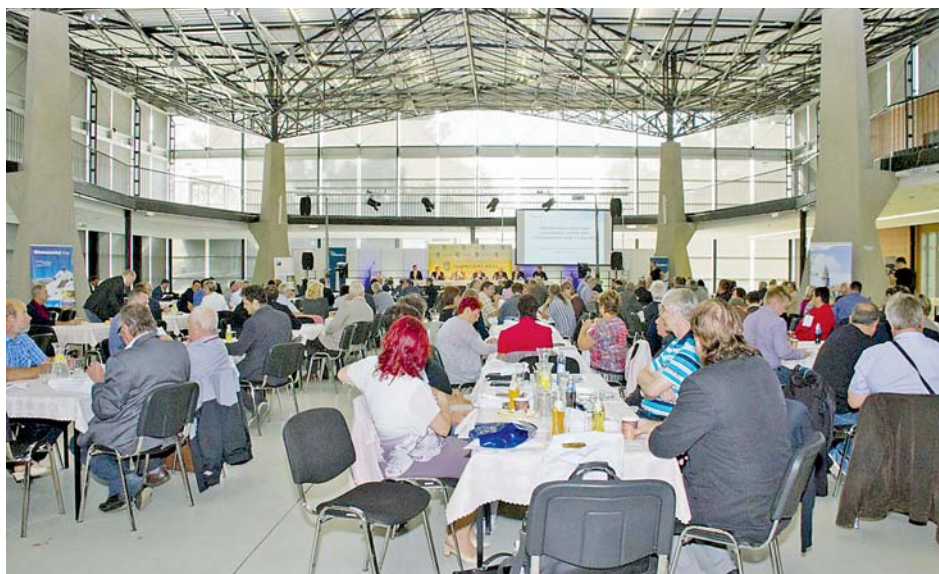
■ Konference samospráv se zúčastnily na dvě stovky starostů. S vedením kraje diskutovali také o odpadovém hospodářství, kotlíkových dotacích a dalších aktuálních tématech.