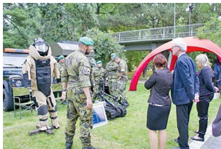
■ V rámci Road show se na výstavišti prezentovaly všechny složky Integrovaného záchranného systému Olomouckého kraje. Nechyběla ani armáda či vězeňská služba.

Už čtvrtou debatu na téma zajištění obrany a bezpečnosti Olomoucké-