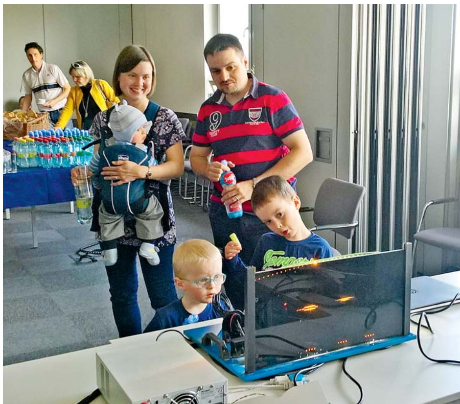
■ V rámci firemní akce „Co dělá můj táta“ se na pracoviště dostanou i rodinní příslušníci.

VH: Ano to určitě. Už v rámci soutěže jsme měli nemalé plány na posun v této oblasti a ocenění nám dodalo kuráž do všeho se pustit a začít