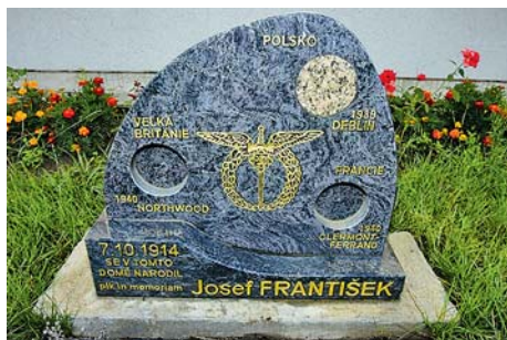
■ Památník Josefa Františka v Otaslavicích

Co bylo impulzem pro vznik mikroregionu Předina a jaké byly jeho cíle? Stejně jako u jiných mikroregionů předcházela jeho vzniku snaha o společné řešení projektů, na které by jednotlivé obce samy nedosáhly. Mezi logické souvislosti patří geografická blízkost, spojení kulturními a historickými tradicemi a také společnými problémy.