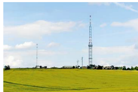
■ Pohled na kopec Předina s vysílačem vysokým 156 metrů

Mikroregion jako takový svoji funkci splnil, nemáme v plánu žádné konkrétní projekty. Zrušení mikroregionu ale není na pořadu dne. Třeba po dalších volbách, až se vedení mikroregionu obmění, najdou se nové nápady, co by se dalo společnými silami vylepšit. »red