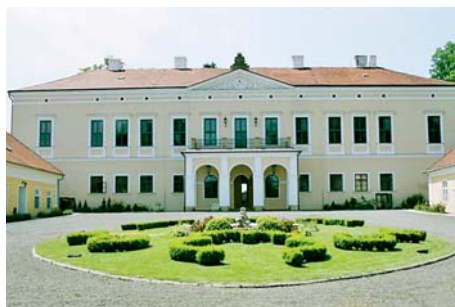
■ Zámek v Brodku u Prostějova

Co považujete za největší úspěch, kterého jste v mikroregionu dosáhli? V roce 2005 se nám díky podpoře Ministerstva pro místní rozvoj podařilo zrealizovat výstavbu několika dětských parků. Věříme, že je to jeden z prostředků, jak udržet mladé rodiny na venkově. Jako významnou podporu cestovního ruchu na Hané vnímáme vznik naučné stezky Předinou za poznáním, kterou navrhli studenti Střední průmyslové školy oděvní v Prostějově. Její délka je 45 kilometrů a má 15 zastavení. Určena je převážně pro cyklisty. V rámci Programu obnovy venkova byla zakoupena komunální technika pro údržbu veřejných prostranství v obcích mikroregionu a současně ozvu-