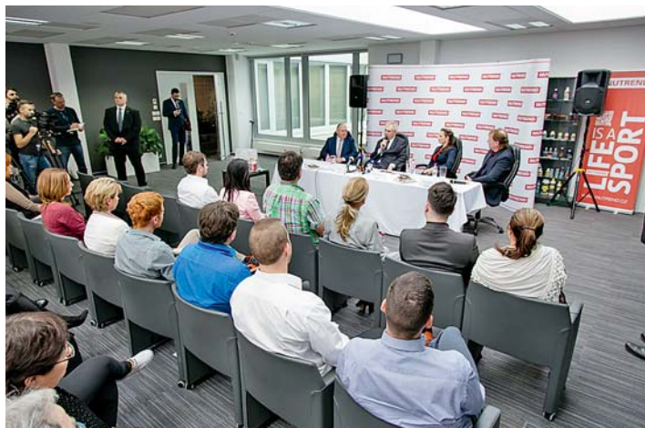
■ Při každé návštěvě některého z podniků si Miloš Zeman nenechal ujít setkání s jeho zaměstnanci.

Během prvního dne se prezident setkal s krajskými zastupiteli a vybranými starosty. Ve Chválkovicích navštívil významného tuzemského výrobce sportovní výživy, společnost Nutrend D. S. Pondělní program hla-