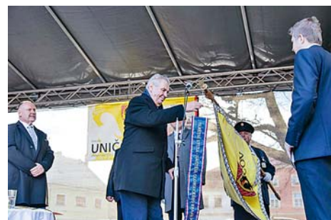
■ V Hněvotíně, Šternberku, Uničově i v Konici připnul na městské prapory památní stuhy prezidenta republiky.