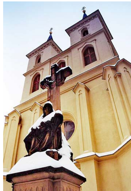
■ Kostel sv. Michala v Otaslavicích