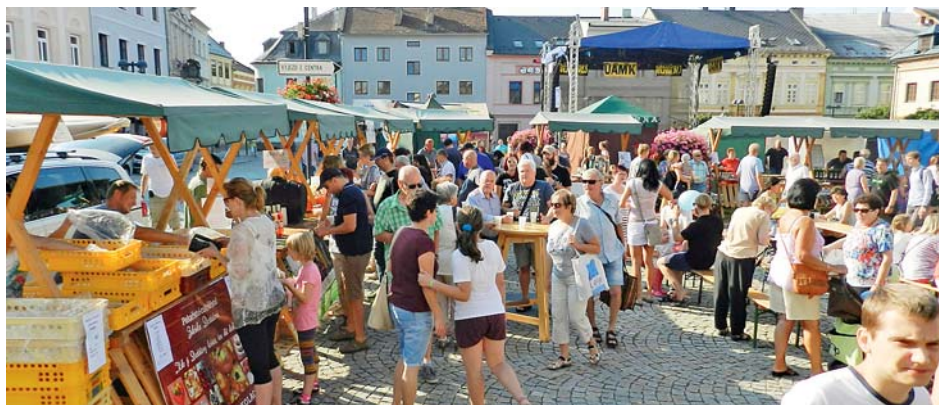
■ Venkovské trhy v centru města Šternberk jsou jednou z oblíbených pravidelných akcí.