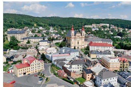
■ Letecký pohled na historickou část města Šternberk.

Podařilo se dohodnout na společné propagaci cyklotras v mikroregionu,