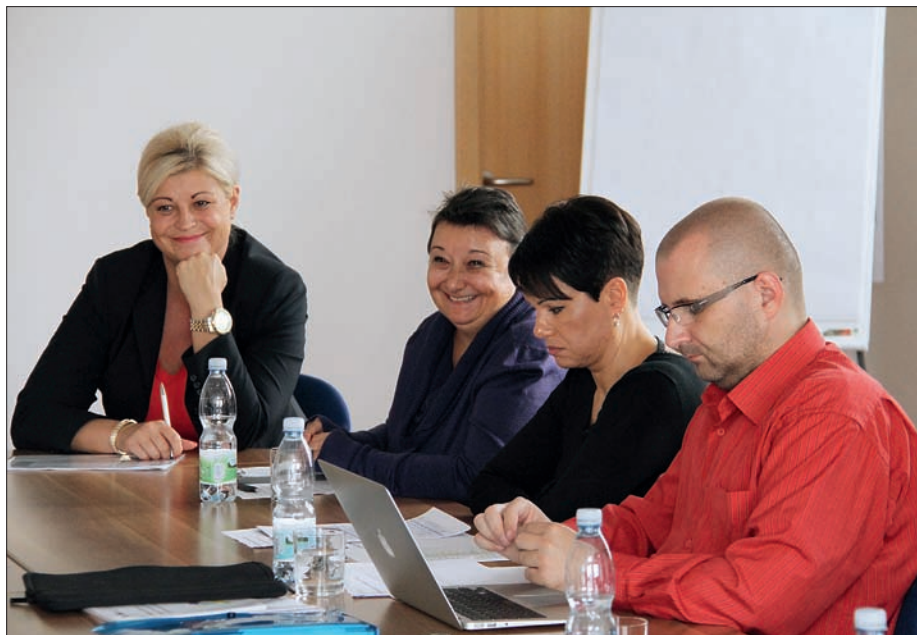
Kulatý stůl na téma sociální služby, 20. září 2013

Otevřela se témata skládkování a navazujících strategických dokumentů např. pro obce, čištění vody, zpřírodnění a protipovodňové ochrany na řece Bečvě, nástroje Olomouckého kraje pro myslivecká sdružení i ekologická výchova a vzdělávání. Na závěr pan Krátký poděkoval za dosavadní činnost Olomouckého kraje v oblasti „Natura 2000“.