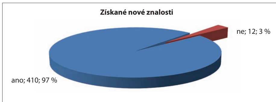
Graf č. 3

12 účastníků uvedlo, že na semináři nové znalosti a dovednosti nezískali – tj. 3 % .