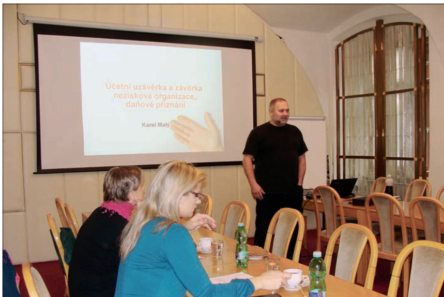
Účetní závěrka a daňové přiznání NNO, 23. října 2014