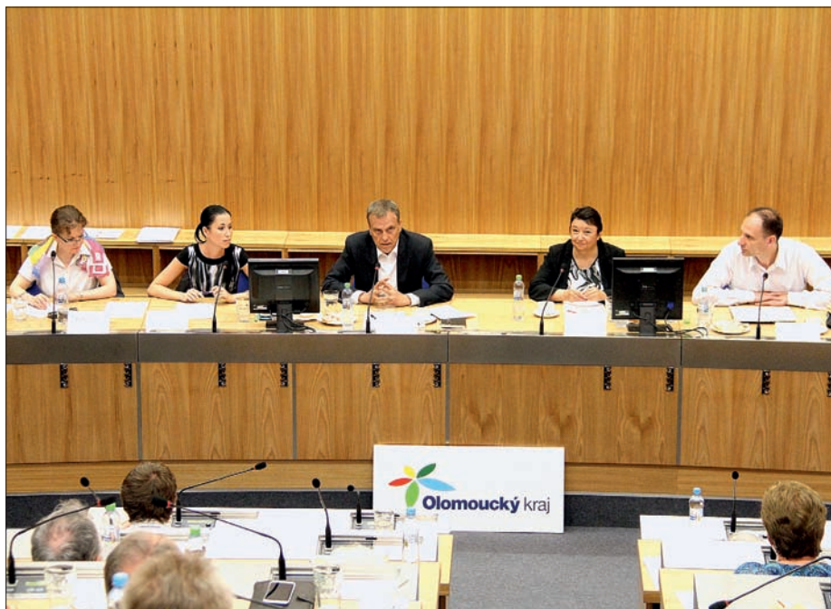
Zahajovací konference o spolupráci kraje s neziskovými organizacemi, 18. června 2013

spolupráce s neziskovými organizacemi. Jejím obsahem byla přímá spolupráce s NNO, pomoc, poradenství a servis organizovaný přímo krajským úřadem. Olomoucký kraj tak opustil praxi zprostředkované spolupráce s neziskovým sektorem a otevřel cestu přímé komunikaci s jednotlivými neziskovými organizacemi.