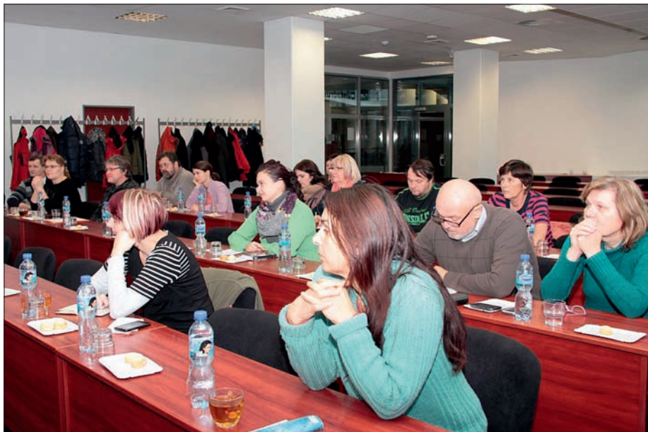
Diskuzní workshop o sociálním podnikání, 27. listopadu 2015