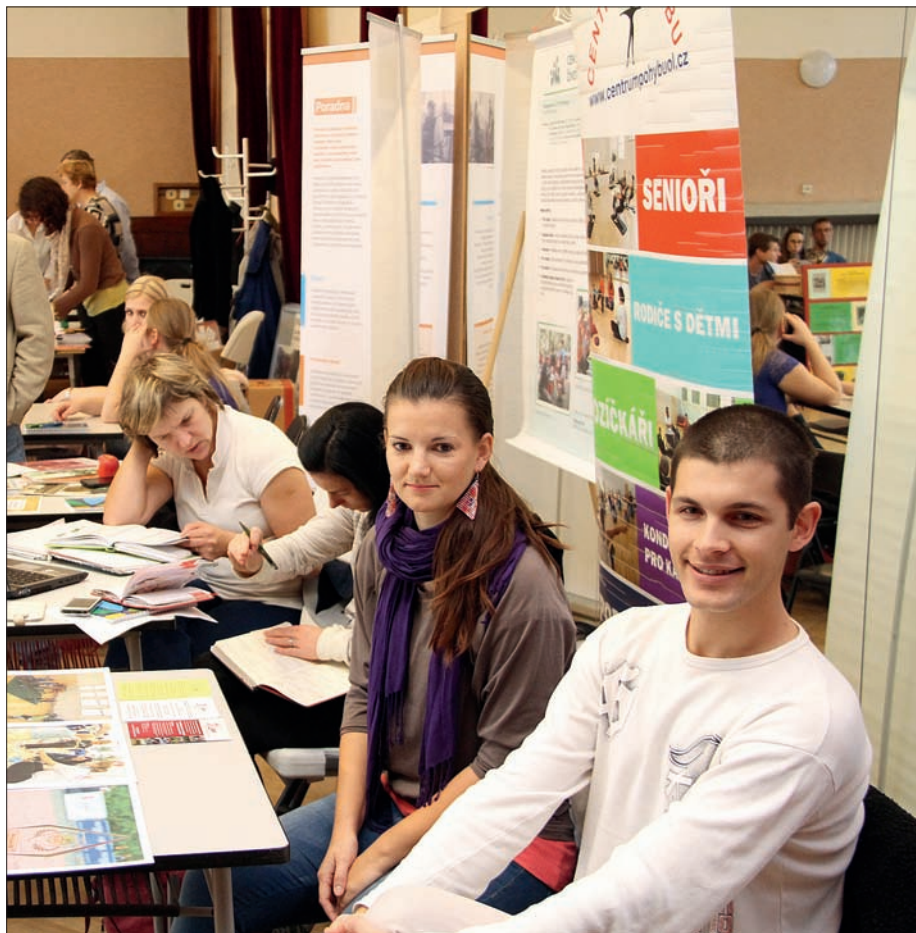
Veletrh neziskových organizací, 29. října 2013

V květnu Rada Olomouckého kraje diskutovala s prostějovskými NNO, v září se konalo setkání v Šumperku a v listopadu si rada vyhradila čas na zástupce NNO na Jesenicku.