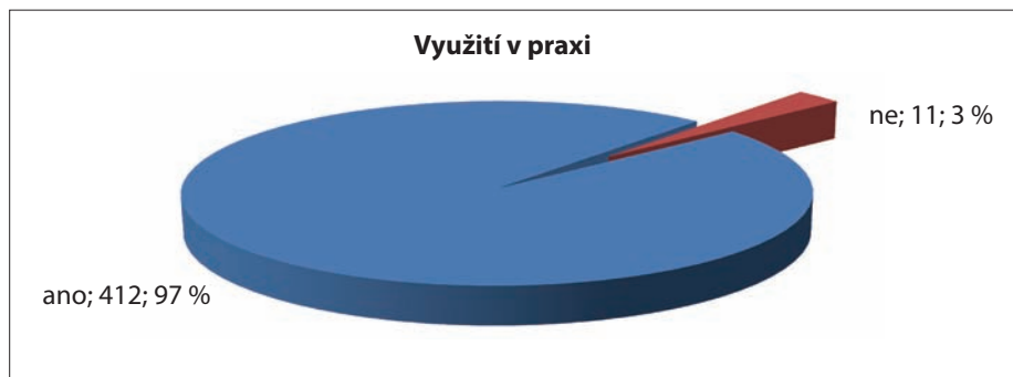
Graf č. 2

11 účastníků uvedlo, že získané vědomosti v praxi nevyužijí – tj. 2,5 % .