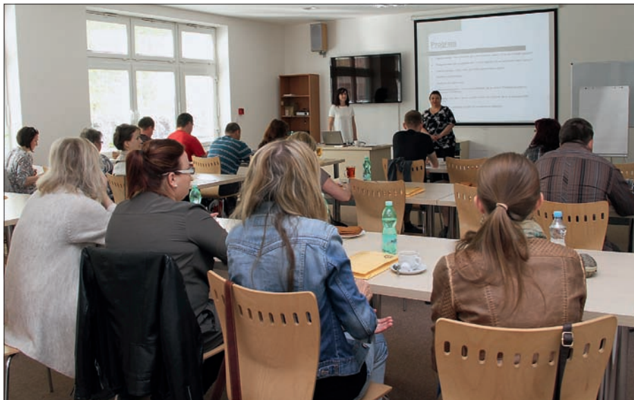
Mediální propagace NNO, 19. května 2015

Základem servisu je zájmové profesní vzdělávání zaměstnanců, členů orgánů a stakeholderů 2 NNO . Olomoucký kraj tyto aktivity přímo organizuje a financuje. Téměř každý měsíc probíhá ve velkých městech kraje seminář na téma potřebné k profesionálnímu řízení neziskové organizace. Jsou vybíráni odborníci z řad lektorů, kteří sami působí v NNO, a zaručují tak provázanost teorie s praxí.