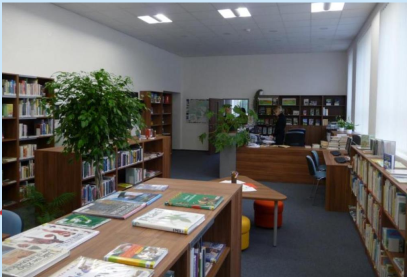
Brána do Jeseníků