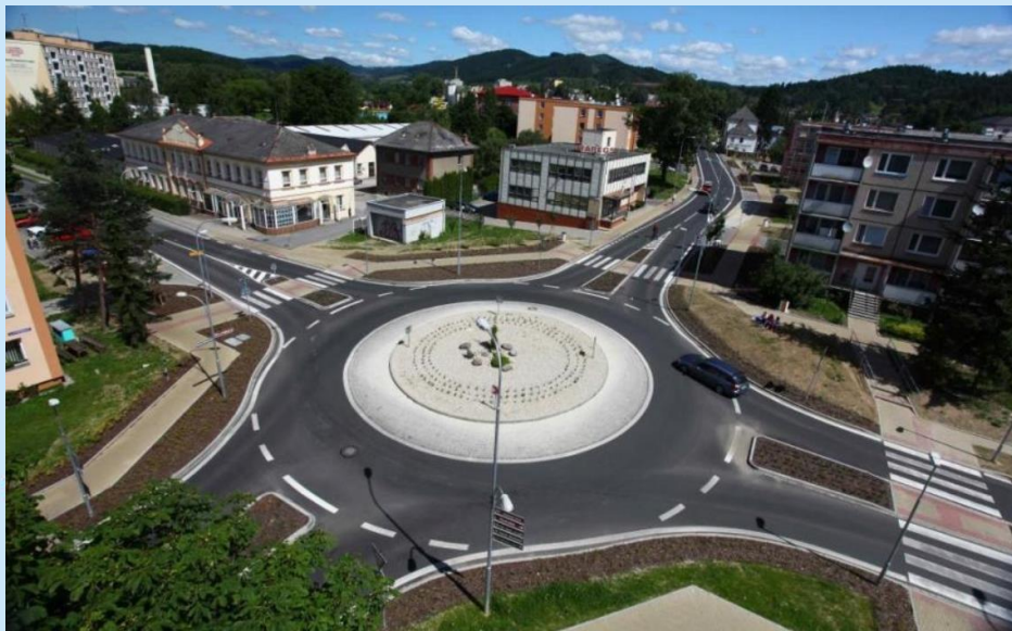
Revitalizace ulice Jiřího z Poděbrad Šumperk