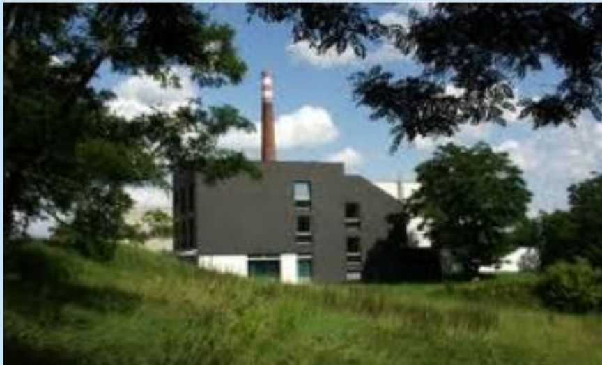
Lázeňský dům BALNEA