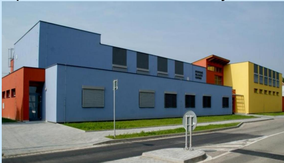
Sportovně relaxační centrum Nezamyslice