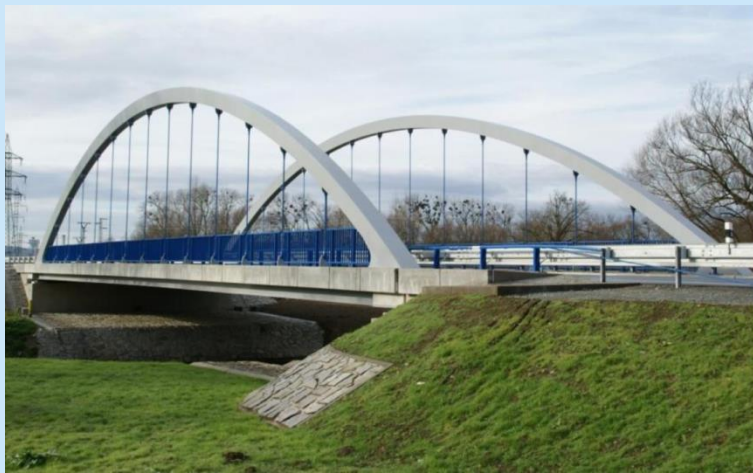
Mohelnice – Stavenice