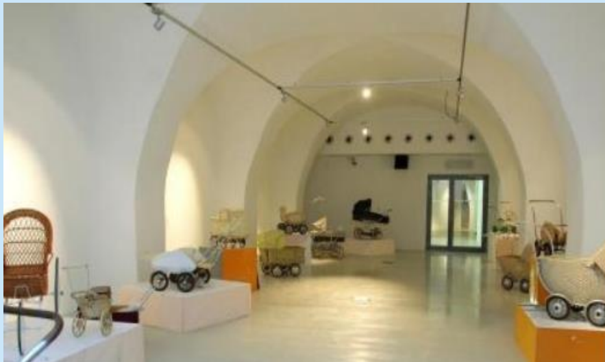
Expozice času Šternberk