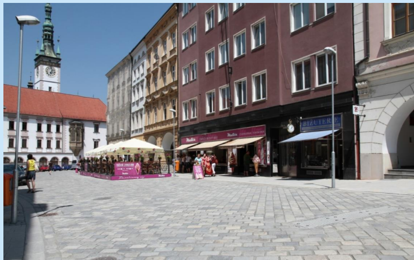
Dolní náměstí – rekonstrukce