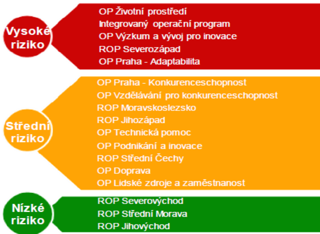
Obr. 1 – Rizikovost operačních programů „semafor“ k 30. červnu 2014

Dle odhadů ČR nevyužije 50 mld. Kč v programovém období 2007-2013.