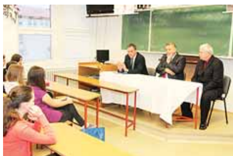
Prvním bodem návštěvy byla beseda se studenty.