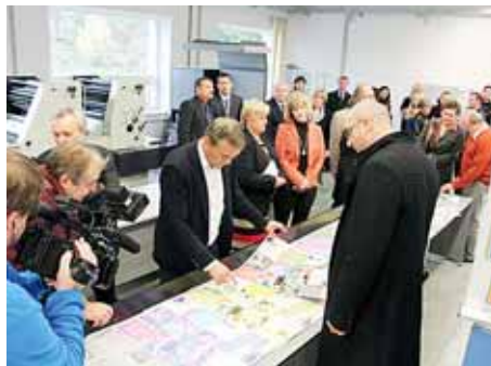
■ Střední škola polygrafická v Olomouci modernizovala dílny za 7 milionů korun.

Nejen v pozici hejtmana, ale především jako občana kraje Jiřího Rozbořila. Díky zpětné vazbě a podnětům od lidí z obcí a měst regionu zůstávám nohama pevně na zemi a vím, že se nejde v každé situaci rozhodovat pouze podle čísel a nelze za vším vidět jenom zisk.