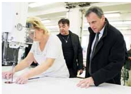
Radní navštívili i největšího zaměstnavatele na Konicku, firmu Moděva.

Další zastávkou na pravidelných výjezdních zasedáních Rady Olomouckého kraje bylo Konicko. Výjezdní jednání Rady Olomouckého kraje probíhají již třetí volební období. Radní se při cestách seznamují s problémy jednotlivých regionů a informují své tamní partnery o důležitých rozhodnutích krajské samosprávy. Krajští radní navštívili Konicko 27. listopadu. Kromě setkání se starosty a místostarosty okolních obcí si radní naplánovali i diskusi s podnikateli, návštěvu největšího místního zaměstnavatele a prohlédli si Základní školu a gymnázium města Konice. Součástí