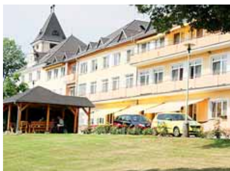
■ Domov pro seniory Radkova Lhota