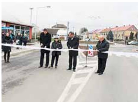
■ V kraji prošlo rekonstrukcí řada silnic.

Stejně jako ozdravení financí je ale nutné ozdravovat i mezilidské vztahy. Přestože není člověk ten, který by se zavděčil lidem všem, věřím, že dialog a naslouchání je pořád mojí silnou stránkou.