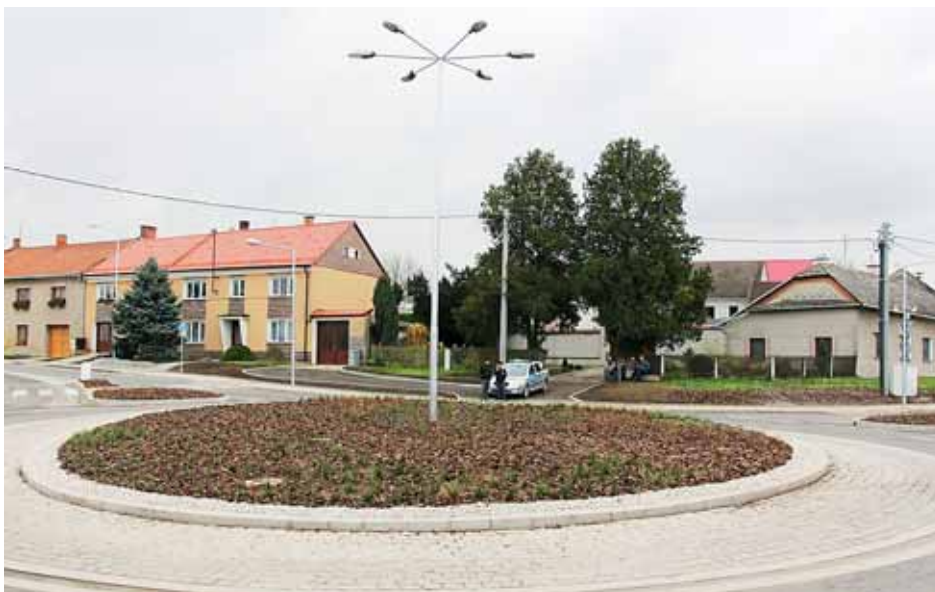
■ Nová kruhová křižovatka výrazně zvýšila bezpečnost provozu v obci.

Nová kruhová křižovatka v centru obce má výrazně zklidnit dopravu a zajistit bezpečnější přecházení chodců přes silnici a plynulejší provoz. Silnice přes Hněvotín je spojnici mezi Olomoucí a Lutínem a Slatiněm. Denně tudy projede přes sedm tisíc aut. „Díky opravené silnici a vybudování kruhového objezdu dojde k výraznému zvýšení bezpečnosti dopravního provozu a také ke zlepšení životního prostředí v obci. Jsem rád, že se nám jednotlivými rekonstrukcemi silnic a křižovatek daří postupně zlepšovat podmínky pro všechny účastníky silničního provozu v našem kraji,“ uvedl hejtman olomouckého kraje Jiří Rozbořil, který se jako zástupce investora zúčastnil otevření nové silnice.