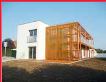
Vincentinum má nové byty strana 6