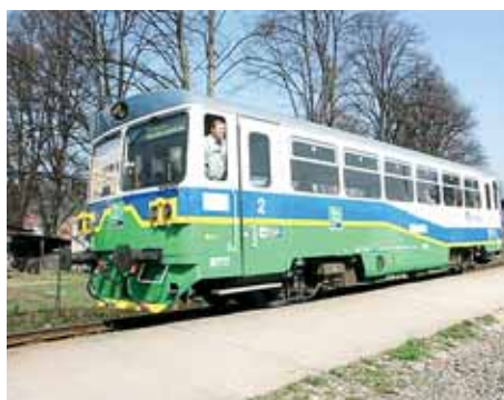
■ Motorová jednotka Železnice Desná