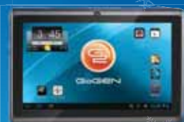
dotykový tablet GoGen

Regionální Deníky, to jsou informace z Vašeho okresu i kraje včetně regionálního sportu, kultury a zábavy.