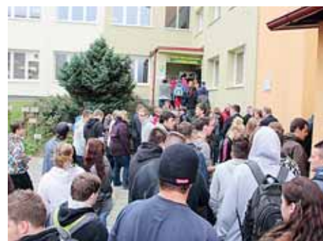
■ Střední škola gastronomie a farmářství v Jeseníku ušetří díky zateplení budovy.

V příštím roce budeme i nadále podporovat čtyři důležité pilíře a zásadní oblasti, kam patří zdravotnictví, školství, sociální služby a také zachování dopravní obslužnosti. Se stejnou intenzitou se zaměříme také na úspěšnou podporu a propagaci učebních oborů i středních odborných škol. Co bych si sám osobně přál nejvíce, bylo dosáhnout snížení nezaměstnanosti obyvatel kraje. Rád bych, ve spolupráci s firmami, krajskou hospodářskou komorou i dalšími subjekty, našel úspěšnou cestu k tomuto cíli. Stejně jako vysoká nezaměstnanost je mým osobním tématem i řešení špatné dopravní situace v Přerově, spojené s dostavbou dálnice D1 a také neutěšený stav kolem státní komunikace R35.