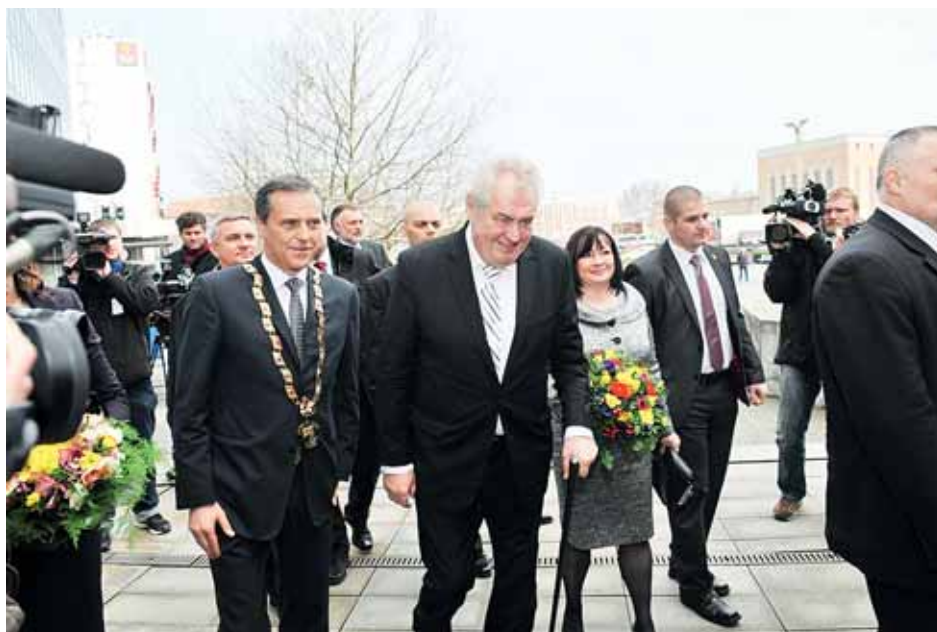
■ V březnu navštívil Olomoucký kraj prezident Miloš Zeman.

Co se týče letošního roku, realizovala Správa silnic Olomouckého kraje stav-