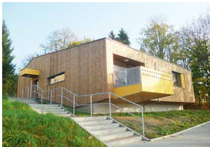
■ Domov se zvláštním režimem ve Šternberku zaujme i svojí architekturou.

Ve Šternberku bude nově poskytována sociální služba „domovy se zvláštním režimem“. Nové bydlení zde najde celkem 12 uživatelů ve 2 domácnostech na Opavské ulici. Posláním domova se zvláštním režimem je poskytovat přiměřenou podporu a péči dospělým osobám, které mají sníženou soběstačnost z důvodu mentálního postižení v kombinaci s duševním onemocněním. Poskytování této služby je přizpůsobeno individuálním a specifickým potřebám osob s problémovým chováním, tak aby mohly prožít co nejspokojenější život. Dalších šest klientů v jedné domácnosti najde stejné služby v obci Lužice. Jejím poslá-