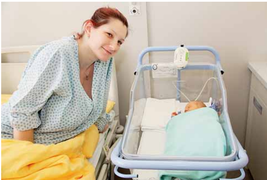
■ Porodnice je vlajkovou lodí šternberské nemocnice a pro narození potomka si ji vybírají matky z celé republiky.

„Porodnice ve Šternberku vždy měla a má vynikající pověst a její služby využívají pacientky z celého Olomouckého kraje. Proto jsem rád, že rekonstrukce proběhla v poměrně krátké době. Věřím, že nyní, po vylepšení podmínek