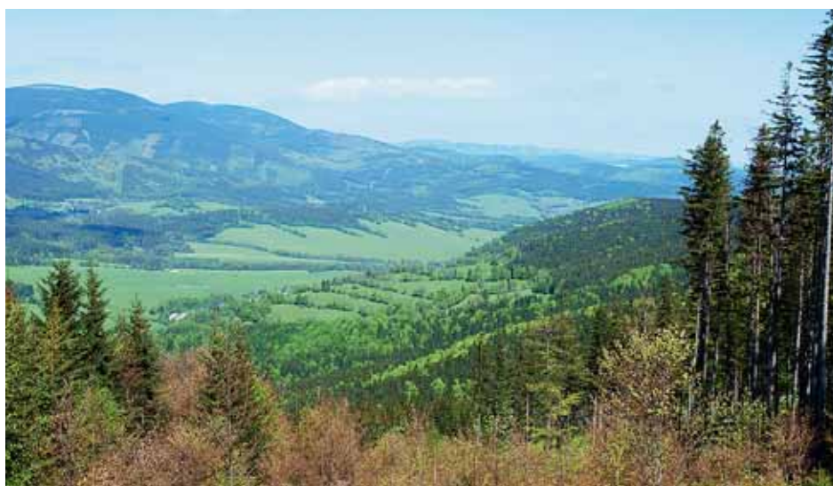
■ Pohled na údolí Bělé

Obce se stále snaží plnit stanovené cíle. Jednou ze základních aktivit MRJ je tzv. Dohoda o akcích společného zájmu, na základě které přispívají společně např. na provoz běžeckých tras na Jeseníku, na provoz Informačního centra Jesenicka apod. Velmi důležitým krokem pro obce mikroregionu bylo vypracování nové Strategie rozvoje mikroregionu Jesenicko 2007–2013. I díky takto zpracované strategii zaznamenáváme každoročně