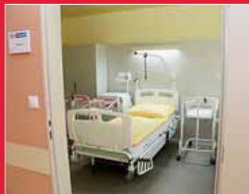
Šternberská porodnice v novém strana 4