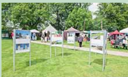
■ Zahájení 6. ročníku výstavy v květnu 2014 na pražském Vyšehradě