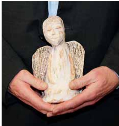
■ Cenu, sošku v podobě anděla, vyrobily děti ze Základní umělecké školy v Kroměříži.

„Ocenění už ve svém názvu obsahuje to, co by se mělo stát určitě normou v každodenním životě. Sladění rodinného a pracovního života a nastavení příznivých pracovních podmínek,“ dodala k výsledkům letošního kola soutěže náměstkyně hejtmana pro sociální oblast Yvona Kubjátová. Soutěž Společnost přátelská k rodině je projekt Sítě mateřských center o. s. zaměřený na motivaci zaměstnavatelů k uplatňování rovných příležitostí a zavádění opatření pro sladování rodinného a pracovního života jejich zaměstnanců. Důraz je kladen na rodinu v každé