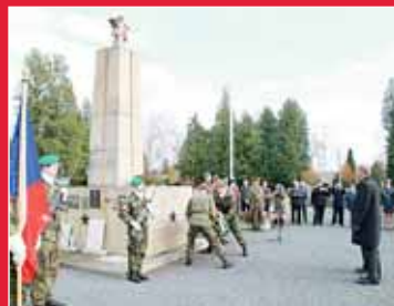
11. 11. Den veteránů strana 3