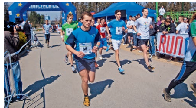
Soutěžit budou studenti středních škol.