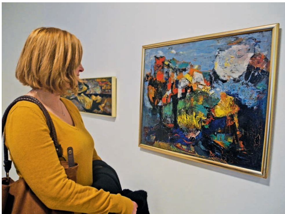
V současné době si mohou návštěvníci prohlédnout tvorbu Ludmily Padrtové.

Do prvních dvou měsíců roku muzeum soustředí zahájení hned tří výstav v olomouckém Muzeu moderního umění. Od 23. ledna je k vidění retrospektiva první dámy české abstrakce Ludmily Padrtové. Tvorbu pozapomenuté a znovu objevené umělkyně přibližuje prostřednictvím více než 20 obrazů a 120 kreseb z let 1951–2013. O dva týdny později, 6. února, se návštěvníkům otevře retrospektiva krále českého komiksu Káji Saudka. „Bude to dosud nejrozsáhlejší přehlídka