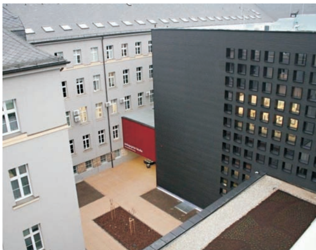
Dostavba si vyžádala 200 milionů korun.

Olomouc • Moderně vybavenou aulu, laboratoře, učebny i data-centrum nové generace získala Pedagogická fakulta Univerzity Palackého v Olomouci v dostavbě hlavní budovy na Žižkově náměstí. Nový objekt za zhruba 200 milionů korun byl ve středu 22. ledna slavnostně otevřen, studenti a pedagogové ho naplno využijí od letního semestru. „Dosud fakulta sídlila v objektech původně určených pro jiné účely, hlavní budova navíc nedostačovala kapacitně a neodpovídala našim potřebám. Dostavba nám otevírá prostor nejen pro mnohem kvalitnější výuku i výzkum, ale i pro hlubší spolupráci