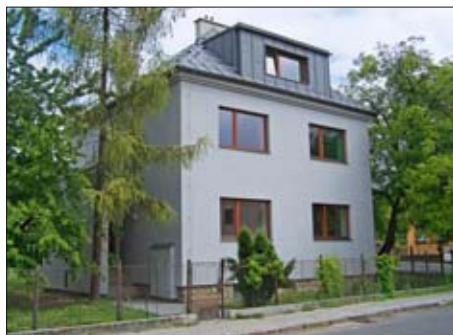
Chráněné bydlení v Revoluční ulici