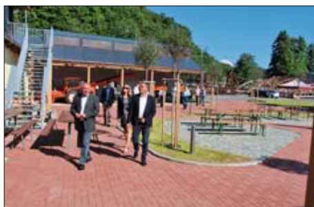
Otevření expozice silničních mostů