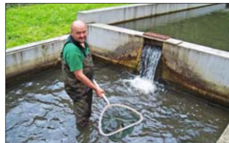
Kontrola rybí násady

V Domašově vzniklo v roce 2011 i školící i školicí a ubytovací středisko v budově pstruží líhně. Toto zařízení bylo vybudováno a vybaveno z příspěvků Olomouckého kraje a slouží pro aktivity rybářských kroužků nebo výkon praxe studentů rybářských škol. Cílem projektu bylo hlavně rozšíření znalostí o chovu ryb mezi rybářskou mládeží i veřejností a objasnění významu vysazování ryb do volné přírody, ale i propagace pstruží líhně v rámci olomouckého regionu. Školící středisko by neexistovalo bez podpory Olomouckého kraje, který zařadil projekt mezi Vý-