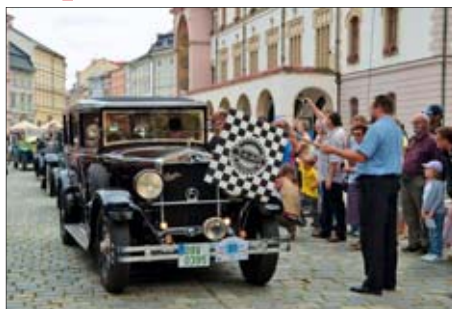
Tradiční soutěž připravil Olomoucký klub historických vozidel – SKAM Olomouc.

Na akci se představí vozy vyrobené před rokem 1939. Letošní ročník je zaměřen na automobily a motocykly československé předválečné produkce. Na startu bude více než padesát historických kousků. Mimo tradičních značek Aero, Praga, Škoda a Tatra tentokrát bude mít své početnější zastoupení také jinonický Walter, brněnská Zbrojovka, ale také automobily Wikov, které se vyráběly v Prostějově. Jízdy se zúčastní i zvukné zahraniční značky, mezi nimiž má pro mnohé jistě nejvyšší zvuk Rolls Royce. Na své si ale přijdou i milovníci jedné stopy, ti budou moct obdivovat více než dvacítku historických motocyklů např. ČZ, Jawa, Praga či Eska, anglická mota značek