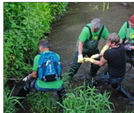
Společné čištění řeky Bystřice

Asi největším úspěchem je trvalá spolupráce obcí mikroregionu, vzájemná podpora a porozumění jak na úrovni vedení obcí i mezi občany. Od toho se odvíjí i úspěšná realizace velkých projektů jako jsou právě cyklostezky a v minulém roce vybudovaná síť varovného a vyznaménacího systému pro obce. Není možné vyjmenovat všechny úspěšné akce realizované v mikroregionu, je ale zřejmé, že za čtrnácti let fungování tohoto sdružení se jeho tvář radikálně změnila k lepšímu.