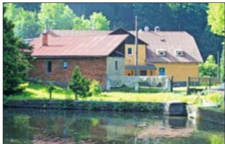
Pstruží líheň Domašov nad Bystřicí.

■ Pstruží líheň, která vznikla v roce 1946 v bývalém statku v Domašově nad Bystřicí, se dnes věnuje nejen odchovu ryb, ale i vzdělávání dětí, mládeže a široké veřejnosti. Místní rybářský spolek má dnes téměř 850 členů, obhospodařuje 24 ha pstruhových vod a zajišťuje produkci lososovitých ryb pro mnoho ostatních rybářských organizací na severní Moravě.