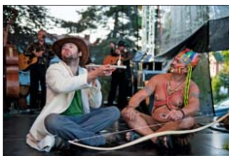
Lidová veselice Hanácké pupek světa