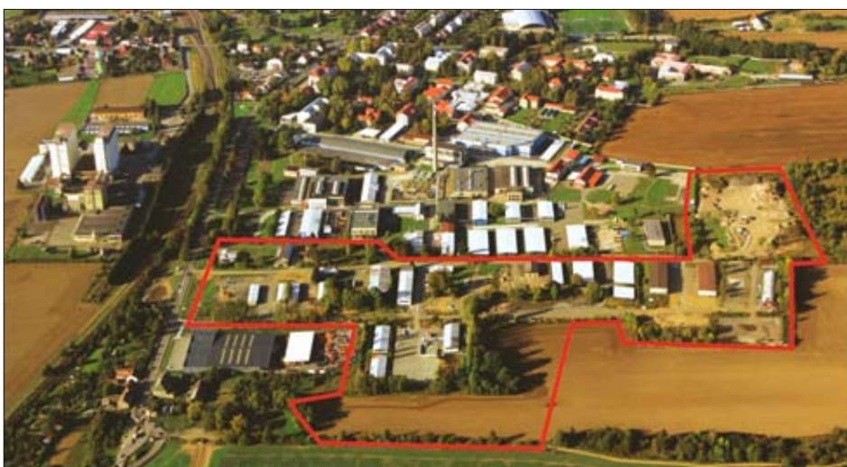
Podnikatelská zóna Šternberk

Akci pořádá agentura CzechInvest společně se Sdružením pro zahraniční investice – AFI pod záštitou ministra průmyslu a obchodu Jana Mládka. Cílem akce je ocenit důležité investiční počiny, které pomáhají České republice růst. Ceny za podnikatelské nemovitosti se udílely ve třech kategoriích – průmyslová zóna roku, nemovitost roku a brownfield roku. Brownfieldem roku se stala právě Podnikatelská zóna Šternberk, která vyrostla v areálu bývalých kasáren. V loňském roce byl tento projekt v národním kole 7. ročníku soutěže Evropské ceny za podporu podnikání 2013 oceněn druhým místem a následně byl Evropskou komisí vyhlášen národním vítězem Evropské-