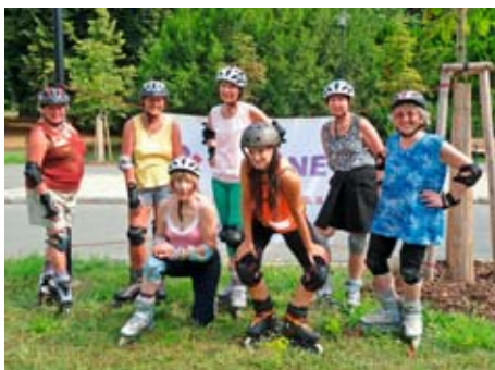
Jedna z aktivit loňského projektu Senioři bez hranic

V minulých ročnících se aktivit účastnilo vždy více než 600 seniorů a mnozí vyzkoušené aktivity navštěvovali i dále v průběhu školního roku. „Senioři mohou také poznat zázemí bowlingových drah i kamerového systému Městské policie Olomouc a osobně se potkat se