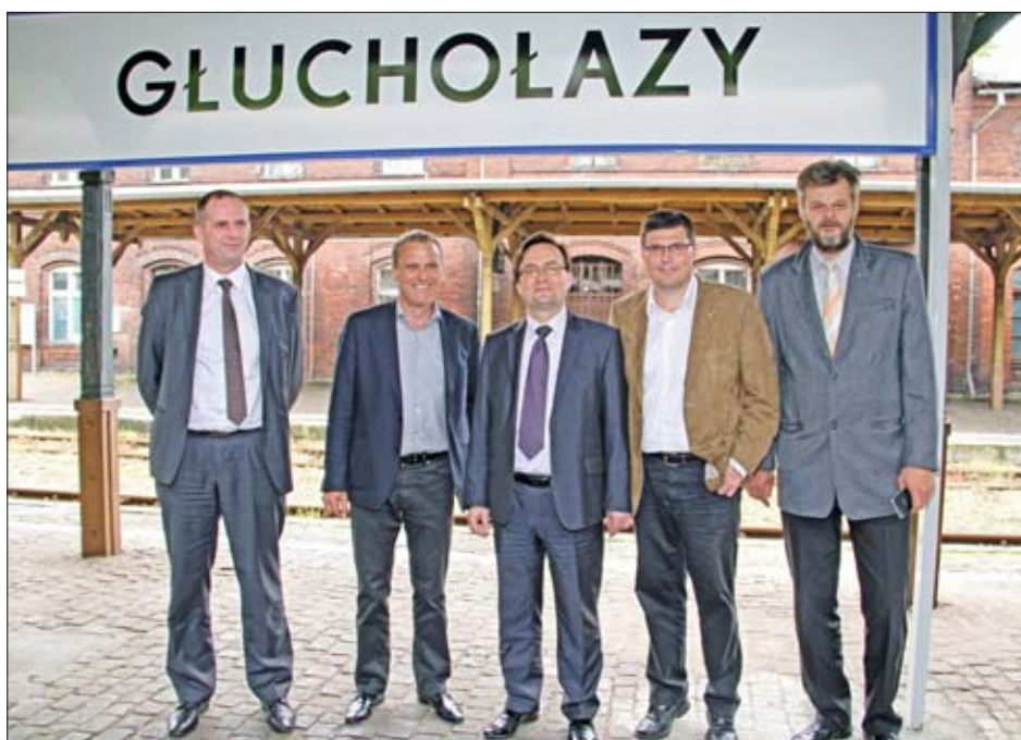
Společné jízdy po železniční trati se zúčastnili zástupci Olomouckého i Moravskoslezského kraje, Ministerstva dopravy, Českých drah, i zástupce Opolského vojvodství.

▪ Železniční trať vedoucí z Jeseníku do Krnova částečně prochází polským územím a řadu let je její provoz ztrátový. Úsek je ve špatném technickém stavu a kraje za jeho použití platí neúměrně vysoké poplatky. Vedení Olomouckého kraje proto iniciovalo jednání s Ministerstvem dopravy a Moravskoslezským krajem o záchraně provozu na této trati. Provoz vlaků na trati Jeseník – Krnov přes polské Glucholazy převzaly Olomoucký a Moravskoslezský kraj v roce 2012. Důvodem bylo rozhodnutí státu odstoupit od své objednávky spojů. V únoru letošního roku zástupci Moravskoslezského kraje informovali vedení olomouckého hejmanství o rozhodnutí ukončit svou objednávku vlaků na trati k 15. 6. Později prodloužili termín, během něhož jsou ochotni na úhradu ztráty z dopravy participovat, do prosince 2014. „Po dlouhodobém vyjednání s Ministerstvem dopra-