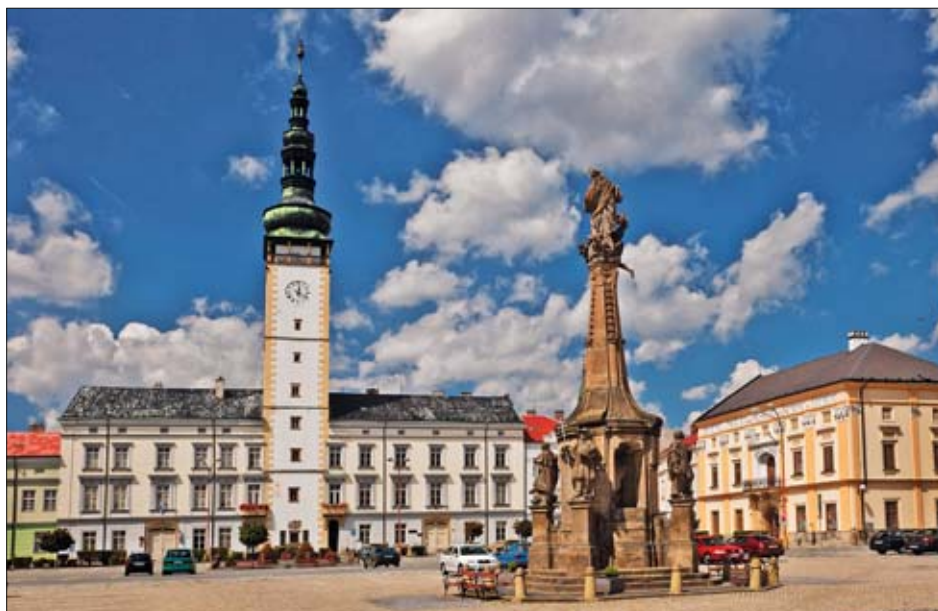
Jedním z cílů zájezdu je i město Litovel.