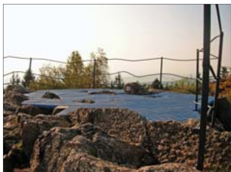
Vrchol hory Bradlo s vyhlídkou

Co bylo impulzem a za jakým cílem vznikl mikroregion Uničovsko?