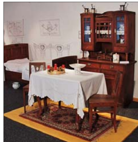
Malovaný nábytek, 19. století