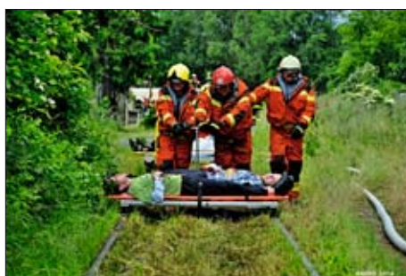
Cvičení RAFEX 2014.

▪ Více než tři stovky cvičících se v Přerově účastnilo největšího taktického cvičení všech složek integrovaného záchranného systému v Olomouckém kraji. Simulovaná nehoda vlaku převážejícího kyselinu sírovou s osobním vlakem měla prověřit součinnost všech zasahujících složek – od hasičů přes zdravotníky až po celní úřad či bezpečnostní radu kraje. Ve fiktivní zemi, po desetidenních deštích, které způsobily záplavy, podemlela voda železniční trať. Projíždějící osobní vlak narazil do vagonu převážejícího kyselinu sírovou. Zranilo se při tom 90 osob. Záchranáři tak museli