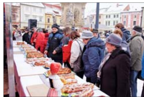
Vánoční jarmark v Uničově