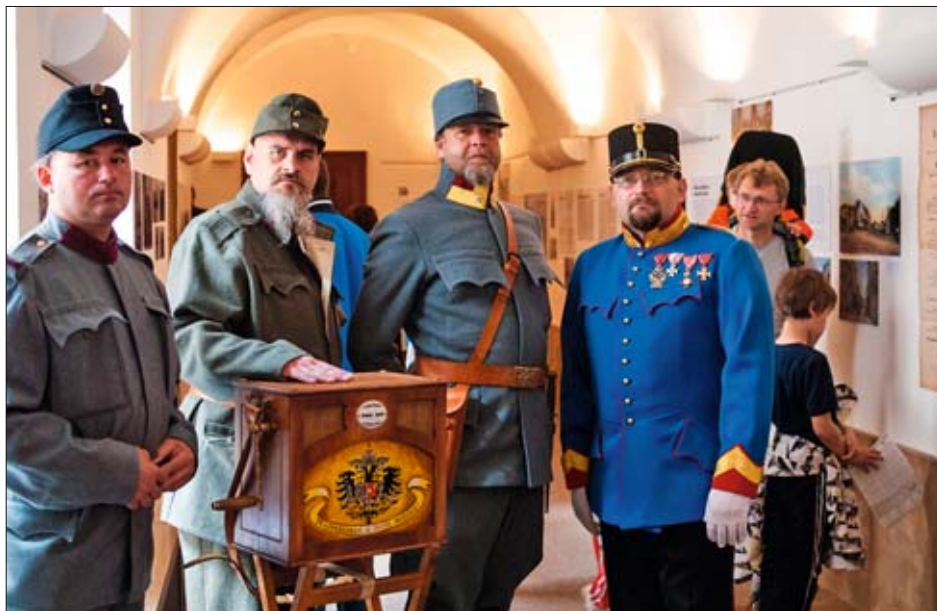
Atmosféra zahájení výstavy 10. května