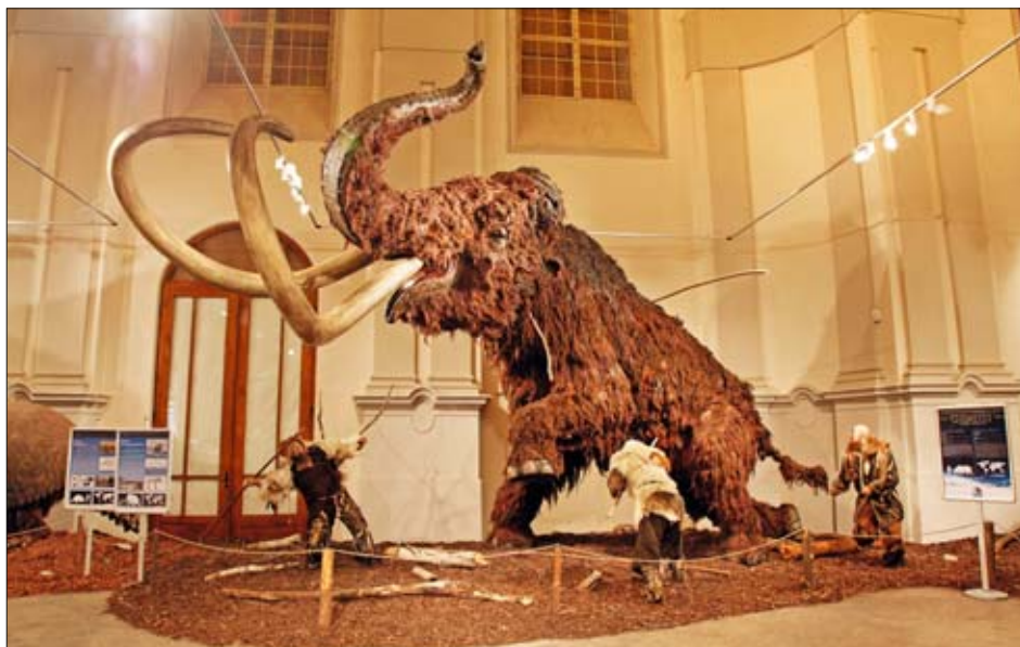
Jedním z největších exponátů je čtyřmetrový mamut

Na ploše větší než 650 m 2 tak mohou návštěvníci podniknout výpravu do minulosti staré více než 10 000 let a seznámit se s největšími tvory, kteří v tehdejších dobách obývali kontinenty a mnozí z nich i území České republiky. V plné kráse a životní velikosti se zde představuje 18 vyhynulých zvířat z doby ledové z různých koutů světa, jejichž modely byly vytvořeny v souladu s nejnovějšími vědeckými poznatky. Při realizaci této unikátní expozice spojili své síly paleontologové, modeláři a výtvarníci. Mezi největšími vystavenými modely dominují čtyři metry vysoký mamut a šest metrů dlouhý pozemní lenochod megatherium z Jižní Ameriky. Zajímavý je také příbuzný