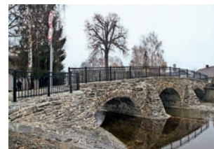
Kamenný klenbový most v Dlouhé Loučce, starý asi tři sta let, je kulturní památkou.

Historický most v Dlouhé Loučce prošel rekonstrukcí