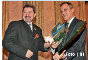
Hejtman (vpravo) dostal soubor starých map.