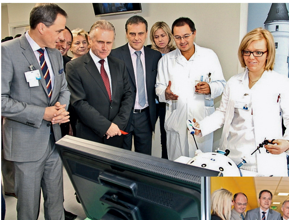
Delegace si prohlédla novou zdravotnickou techniku.