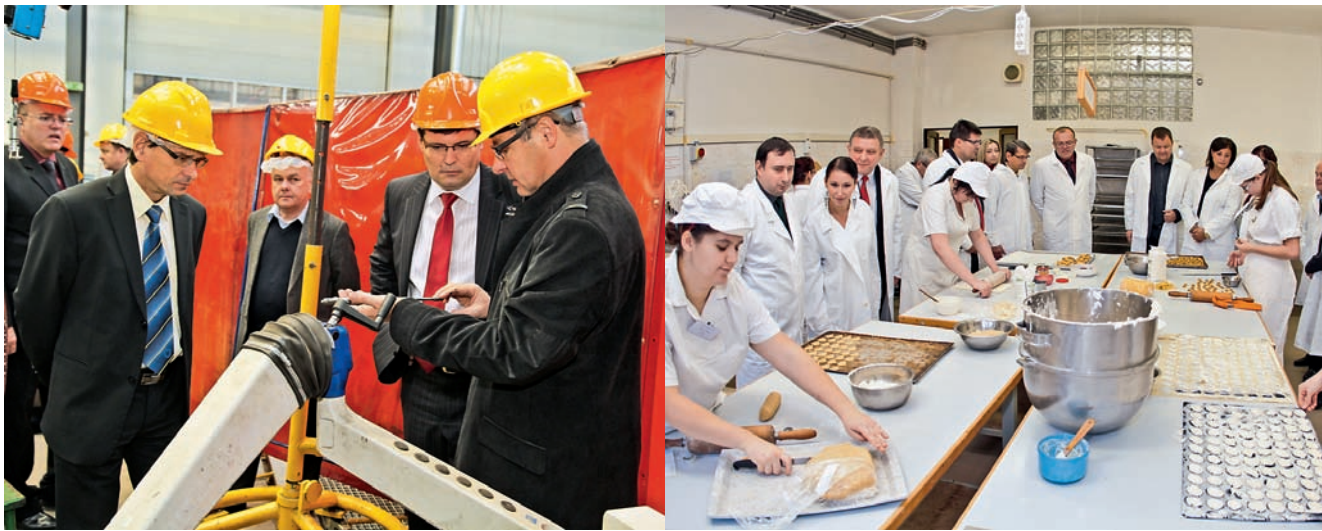
Radní zavítali do Ondřejovické strojírny (vlevo) a do střední odborné školy gastronomie (vpravo).