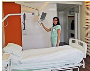
Moderní pokoje jsou vybaveny polohovatelnými lůžky.