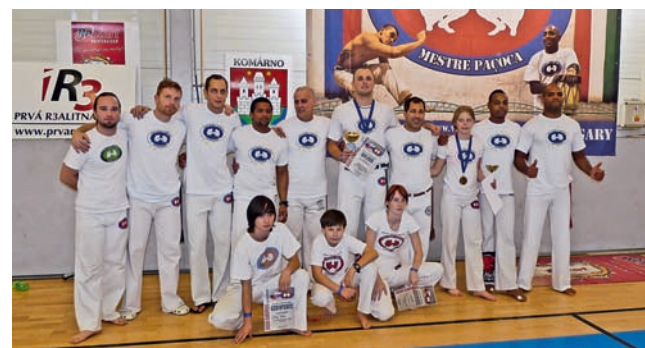
Olomoučtí sportovci byli na Slovensku úspěšní.