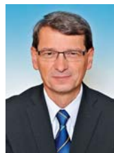
Mgr. Radovan Rašák, náměstek hejtmána

Mgr. Rašák se narodil v roce 1958 v Kojetíně. Vystudoval Přírodovědeckou fakultu Univerzity Palackého v Olomouci, obor učitelství, kombinace matematika - tělesná výchova. Jeho profesní kariéra započala na školách v Přerově, kde zastával pozici učitele či zástupce ředitele. Politicky se začal angažovat v roce 1997, kdy se stal členem ČSSD. V roce 1998 se stal zastupitelem města Přerov, v roce 2002 členem Rady města Přerova. Od roku 2008 je náměstkem hejtmána a členem Rady OK. Bydlí v Přerově, je ženatý, má dvě děti.