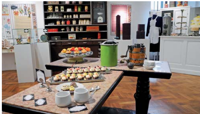
Sladkosti lákají návštěvníky k ochutnání.

nočně vyzdobeným hradem, na hradním nádvoří bude k vidění živý betlém a vánoční dílna pro děti. Zámek v Plumlově láká na netradiční prohlídky se scénkami a adventními zvyky 15. a 16. prosince. Víkendové prohlídky nazdobeným hradem se konají v prosinci také ve Šternberku, pravé hanácké Vánoce pak lidé poznají 15. prosince v Hanáckém skanzenu Příkazy. Sváteční čas v Olomouckém kraji je bohatý i na řadu výstav. Tradice předvánoční doby si zájemci připomenou na výstavě Advent ve Vodní tvrzi ve Vlastivědném muzeu Jesenicka, která je otevřená do konce prosince. Na mnoha místech jsou k vidění betlémy vyrobené z různých materiálů. Papírové betlémy mohou návštěvníci obdivovat ve Vlastivědném muzeu v Šumperku, tradiční výstava betlémů je otevřená do 6. ledna také v Muzeu Komenského v Přerově. Slavný dřevěný mohelnický betlém bude vystaven v kapli kostela sv. Tomáše z Cantenburry na Štědrý den po skončení půlnoční mše. Lidé si mohou od 1. prosince v ateliéru řezbáře Jaroslava Beneše v Lošticích prohlédnout i známý loštický dřevěný betlém s více než 190 figurami. | JO