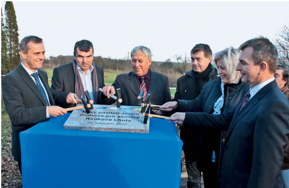
Nový pavilon by měl být dokončen do června roku 2014.

Radkova Lhota • Celkem 79 klientů s Alzheimerovou chorobou najde azyl v novém pavilonu Domova pro seniory v Radkově Lhotě na Přerovsku. Stavbu nové budovy zahájil ve