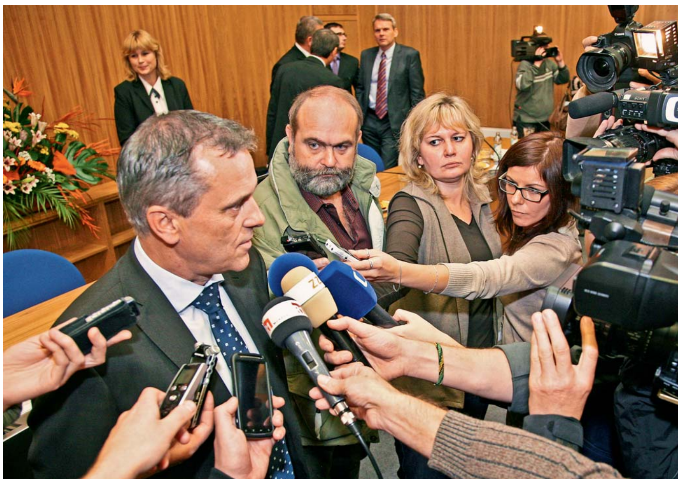
Nový hejtman Olomouckého kraje Jiří Rozbořil

Olomouc • Olomoucký kraj od 19. listopadu řídí Jiří Rozbořil (ČSSD). Zastupitelstvo jej zvolilo novým hejtmanem, když pro něj hlasovalo 35 z 55 jeho členů. „Jsem připravený pracovat ve prospěch všech občanů Olomouckého kraje,“ konstatoval Jiří Rozbořil bezprostředně po svém zvolení. Zastupitelé zároveň hlasovali o složení krajské rady pro čtvrté volební období. V Radě Olomouckého kraje zasednou zástupci České strany