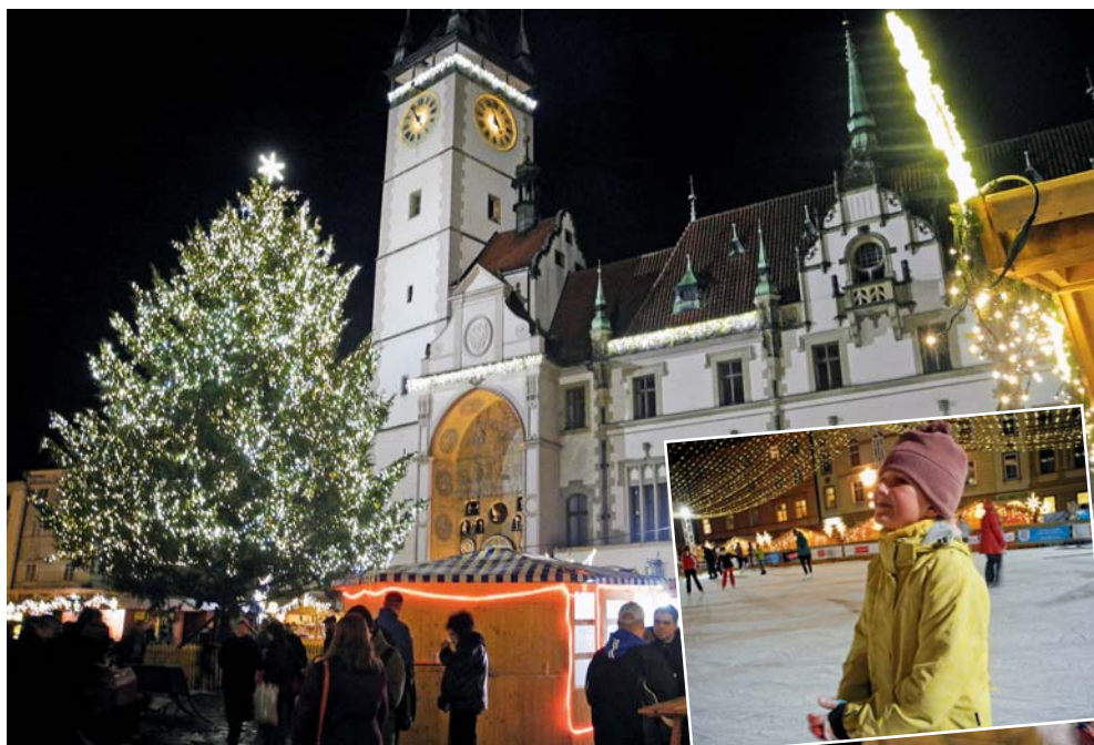
Olomoucké vánoční trhy nabízejí kulturu, bruslení i oblíbené punče.

Olomoucký kraj • Vyzdobená města, vůně vyhlášených místních specialit i oblíbeného punče a tradiční řemeslné výrobky patří k adventnímu času v Olomouckém kraji. Pravou sváteční atmosféru zažijí návštěvníci na vánočních trzích, jarmarcích, hradech i zámcích.