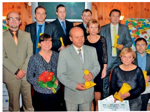
Představitelé oceněných měst a obcí.