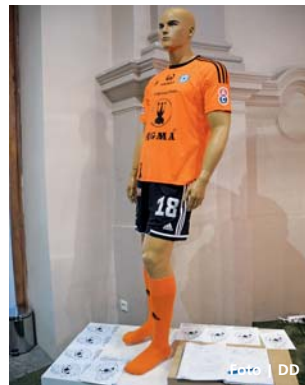
K vidění jsou i dresy slavných hráčů.

Olomouc • Největší výstavní sál Vlastivědného muzea v Olomouci je zcela zaplněn fotbalovými poklady. Velká fotbalová výstava, která od zahájení zaujala návštěvníky z Olomouce i z mnoha dalších míst celé republiky, pokračuje až do 6. ledna. Exponáty pocházejí z několika soukromých sbírek či z Národního muzea v Praze. K vidění jsou například desítky dresů slavných fotbalistů s autogramy, originální míče z různých mistrovství či kopačky známých hráčů, včetně supermoderních futuristických bot, které pak při prvním tréninku na noze fotbalisty praskly. V další rovině ovšem výstava dovoluje díky obsáhlým komentářům a dosud nevystavené kolekci autogramů českých i světových legend, zabrousit až do zakladatelských časů fotbalu. Návštěvník se může dozvědět třeba to, jak silný pozitivní vliv může mít fotbal na politiku a dokonce i na válku. Ještě jiný pohled nabízí expozice, věnovaná třiceti letům SK Sigma Olomouc v první lize. Je rozhodně příjemné připomenout si spanilé jízdy Hanáků v evropských soutěžích, kdy olomoucký tým pod vedením legendárního Karla Brücknera vyprávil nejen renomovaný evropský klub. | TZ