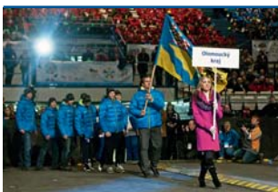
Zimní olympiáda skončila úspěšně. Foto | Archiv

Olomouc • Nadějní házenkáři klubu TJ STM Olomouc stále obsazují přední místa velkých turnajů. Dvě družstva starších a jedno družstvo mladších mini-házenkářů tvoří jednu velkou partu a předvádí bojovnou hru, na kterou se dá s obdivem dívat. V lednu obsadily na třech turnajích dvě 1. místa, jedno druhé a jedno třetí místo mezi kvalitními házenkářskými družstvy. | PZ