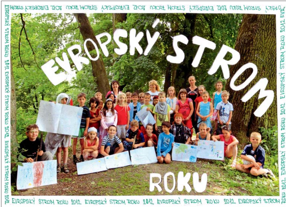
Alej má šanci stát se Evropským stromem.

Skalička • Dubovo-lipová alej ve Skaličce z Přerovska je českým kandidátem v boji o titul Evropský strom roku 2012. Je