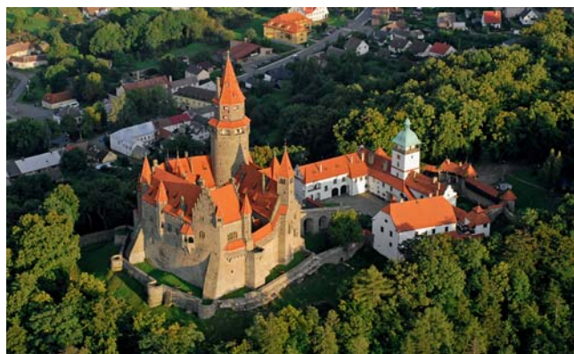
Hrad Bouzov se dočká osvětlení.