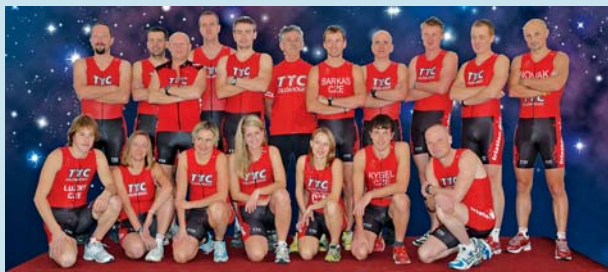
Olomoučtí závodníci získali stříbrnou medaili.