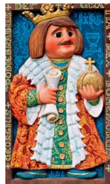
Jiří z Poděbrad

Prostřednictvím obchodníků z Poláčkovy knížky se návštěvníci seznámí nejen s vybavením i zbožím dobového koloniálu, cukrárny, obchodu s textilem a řeznictvím, ale mohou také navštívit výroční trh nebo hokynářství. Smyslem expozice je přiblížit dětem i dospělým, z jakých základů a pod jakými vlivy se rozvíjel obchod a do jaké míry se udržely rodinné i prvorepublikové tradice až do dnešní doby. 1 MB