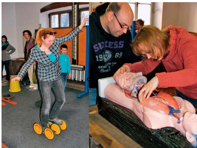
Putovní výstava zaujme všechny generace.

Olomouc • Interaktivní, zábavná a vzdělávací výstava pro všechny generace je až do 25. března připravena ve Vlastivědném muzeu v Olomouci. Návštěvníci si mohou například posedět na hřebících, vyzkoušet pevnost rukou, otestovat vlastní čich, zjistit citlivost svého sluchu, poznat rychlost své reakce i sílu svého stisku. V nabídce je také luštění zvukového pexesa či možnost seznámit se s Brailovým písmem. Putovní výstava zahrnuje na šest desítek interaktivních exponátů, které jsou určeny k vyzkoušení, k vyřešení nebo k soutěžení, takže platí heslo „dotýkat se exponátů je příkazáno“. Díky expozici si malí a velcí mohou ověřit, jak fungují lidské smysly – i to, jak nás někdy klamou. Změřit si lze frekvenci svého sluchu, hlasi-