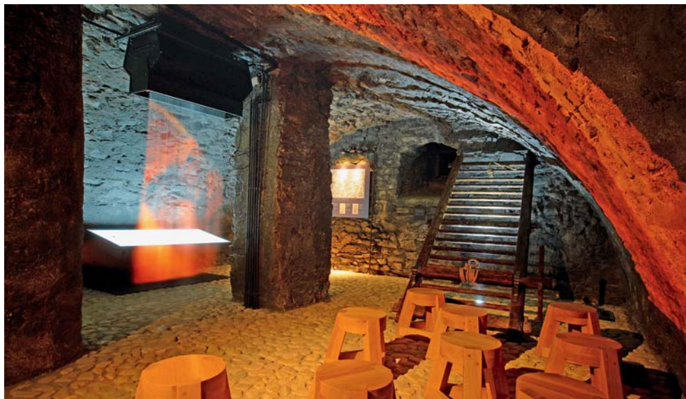
Unikátní expozice se nachází ve Vodní tvrzi.

Jeseník • Vlastivědné muzeum Jesenicka ve Vodní tvrzi v Jeseníku slavnostně otevřelo novou expozici čarodějnických procesů na Jesenicku v 17. století. „Bylo zrekonstruováno sklepení Vodní tvrže za účelem umístění stálé