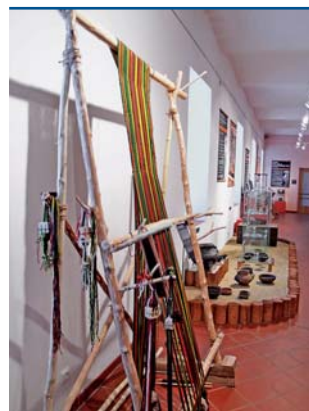
Vertikální stav