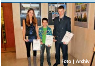
Vítězové ligy taekwondo.