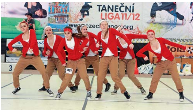
Mistr ČR a celkový vítěz české extraligy v hip hopu – „Angels“ z TŠ LOLA´S DANCE Olomouc.

„Doufali jsme, že se nám podaří zopakovat úspěchy z předchozích let. Povedlo se, neuvěřitelného úspěchu jsme dosáhli v kategorii juniorů, když jsme celkově v extralize sál obsadili hned první 4 místa žebříčku a na MČR v Prostějově pak 4 tituly