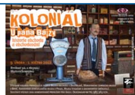
Kolonial: Expozice přiblíží vývoj obchodování.