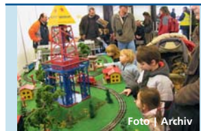
Výstava zaujme malé i velké návštěvníky.