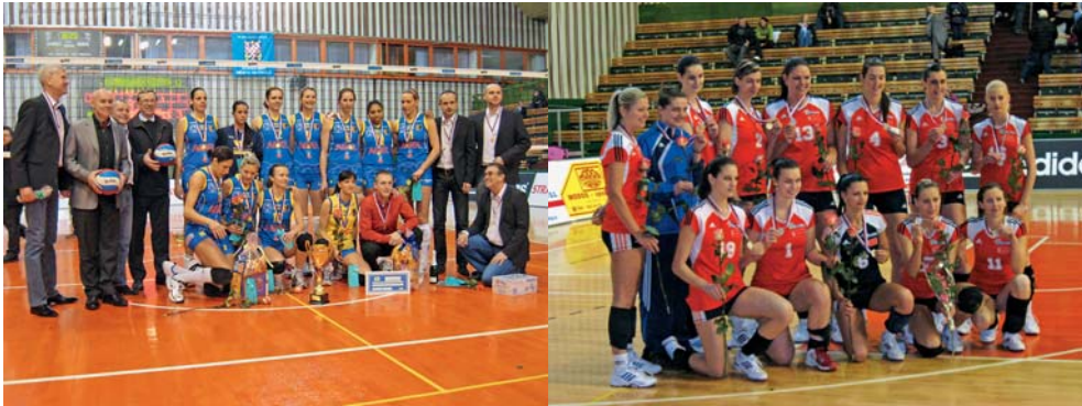
Dva soupeřící týmy – Prostějov (vlevo) a Olomouc.

Domácí tým přitom v úvodu zaskočil vysokého favorita a čtyřnásobného držitele trofeje především odvážným servisem a překvapivě vedl 10:7, 16:14 a ještě 17:16. Až do stavu 19:19 držely Olomoučanky s protivníkem krok i naději na dílčí úspěch, potom ale Prostějov zrychlil a zpřesnil hru a ovládl koncovku první sady. V dalších dvou setech sice vysokoškolačky vždy na za-