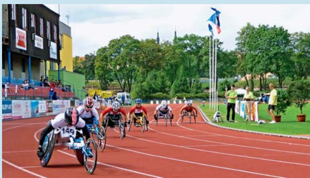
Vozíčkáři se utkali v Olomouci