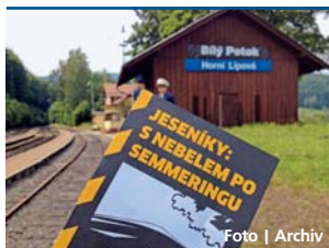
Nádraží v Horní Lipové alias Bílém Potoku