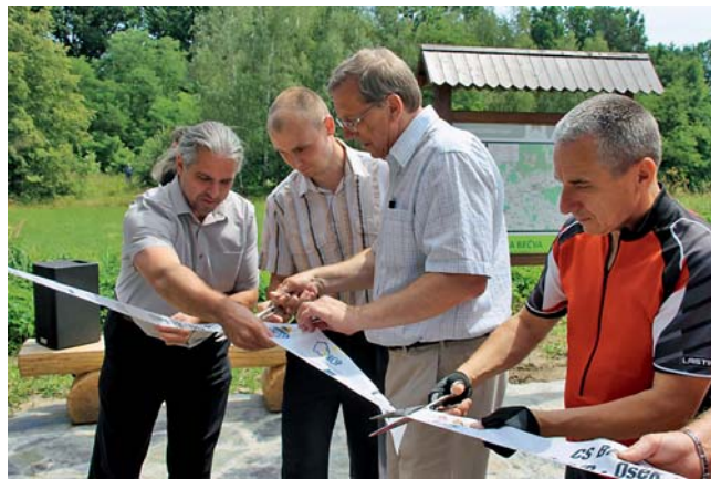
Slavnostní přestřižení pásky.