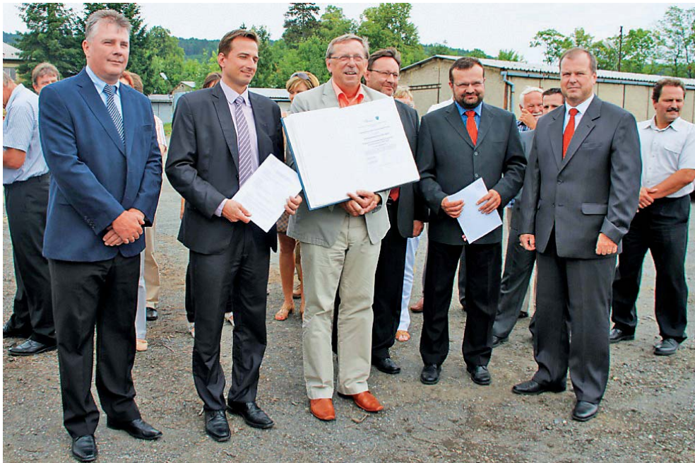
Představitelé Olomouckého kraje a města Šternberk se sešli přímo v areálu průmyslové zóny.