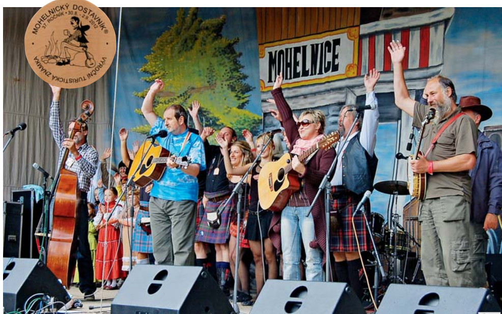
Mohelnický dostavník patří mezi nejlepší festivaly svého druhu.