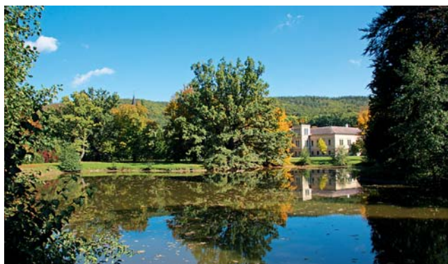
Zámek nyní prochází rozsáhlou rekonstrukcí.