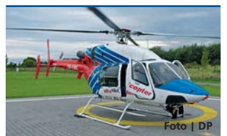
Vrtulníky budou mít nový hangár.