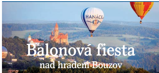
Lety balonem zprostředkují překrásné výhledy.

ními zvířaty, v rámci své skupiny či úzké rodiny tak, jak jim je dáno. Zároveň chceme s ohledem na bezpečnost odbourat uměle vytvořené bariéry mezi zvířaty a lidmi,“ uvedl vedoucí marketingu olomoucké zoo Luděk Richter. Zmizí tak podle něj klasické oplocení, mezi nekonfliktními druhy zvířat se budou cestující pohybovat přímo, od méně bezpečných druhů je oddělí kamenné nebo hliněné valy. Kromě jízdy vláčkem chystá zoo také okruh pro pěší turisty. „Safari bude sice přístupné výhradně prostřednictvím vláčku a ve vybrané dny a čas i autem. Pěší však mohou kolem jednotlivých částí safari procházet po obchůzkové trase,“ konstatoval Luděk Richter. V safari vzniknou nové přístřešky a přírodní prvky, v areálu zoo přibude také nové občerstvení. „Tento projekt je nejen časově rozsáhlý, ale v mnoha směrech znamená pro zoologickou zahradu a zvířata v ní chovaná další životní kapitolu. Ačkoliv se výrazně proměňuje rozlehlá plocha stávajícího areálu zahrady, její provoz zůstává zachován,“ dodal ředitel zoo Rado- mír Habáň. | DD