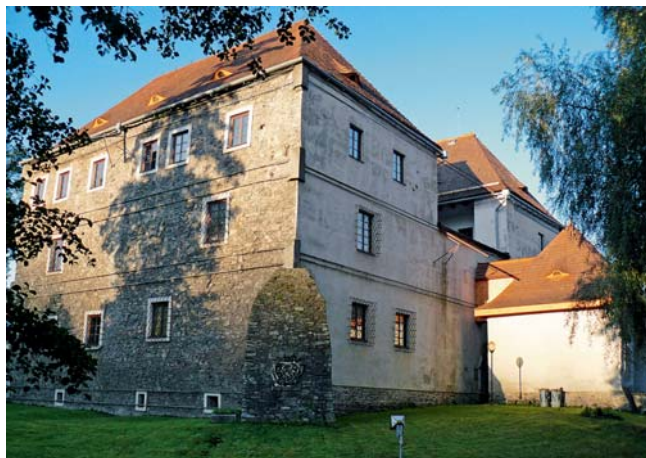
Vodní tvrz v Jeseníku

nutnost nahrazení zastaralých dlouhodobých expozic novými instalacemi, které by vedle odborné úrovně dokázaly zaujmout i návštěvníky. V roce 2005 získala Expozice fauny a flóry Jesenicka 3. místo v soutěži Gloria musealis. Nová Expozice historie Jesenicka byla v roce 2011 nominována na cenu Grand Prix architektů, další dlouhodobá výstava Čarodějnické procesy na Jeseníku obsadila v roce 2012 druhé místo v soutěži Gloria musealis. Stejně potěšitelný je i stoupající zájem veřejnosti o činnost muzea, svědčí o tom jeho zvyšující se návštěvnost, v roce 2003 navštívilo muzeum pouhých 7 806 návštěvníků, naproti tomu v roce 2011 počet návštěvníků dosáhl čísla 26 473. Muzeem je