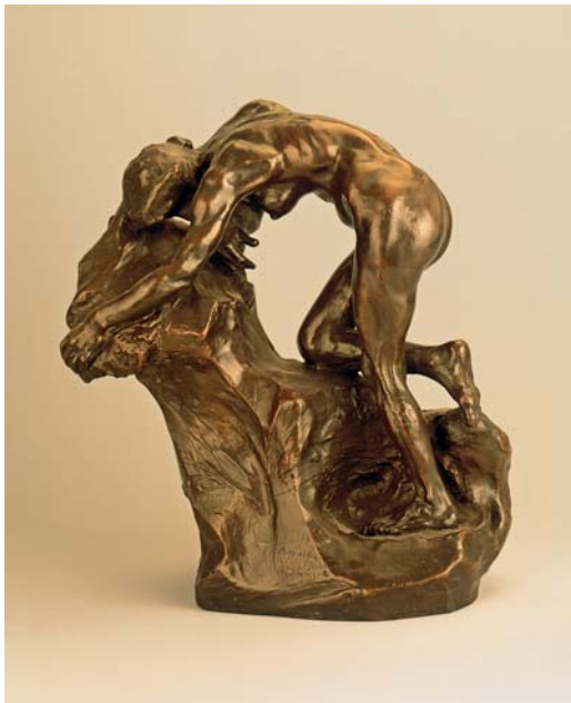
Josef Mařatka – Opuštěná Ariadna, bronz

Olomouc • Vývoj výtvarného umění od nejstarších dob do současnosti mohou zájemci spatřit v Muzeu umění Olomouc. Výstava nazvaná Od Tiziana po Warhola se koná u příležitosti 60. narozenin muzea a potrvá do konce března příštího roku. Divákům představí výtvarnou kulturu od antiky až do těchto dnů. Procházku mezi stovkami skvostů ze sbírek, o