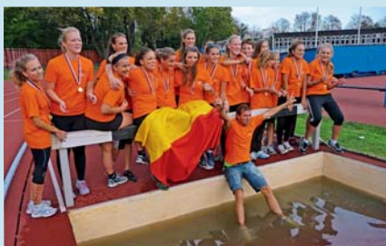
Atleti předvedli skvělé výkony.