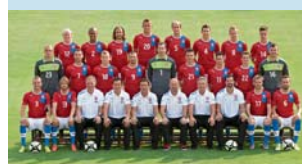
Fotbalový tým