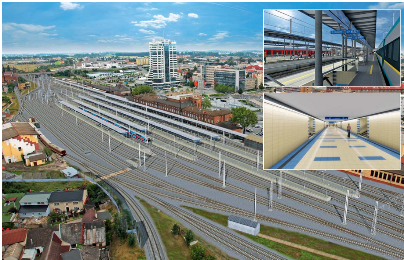
Železniční stanice v Olomouci dostane novou podobu.

Olomouc • Ještě letos by měla začít rozsáhlá rekonstrukce železniční stanice v Olomouci. Vyžádá si investici za zhruba 3,1 miliardy korun a potrvá tři roky. Zhruba 83 procent nákladů pokryje dotace z fondů Evropské unie. V současné době probíhá výběrové řízení na zhotovitele