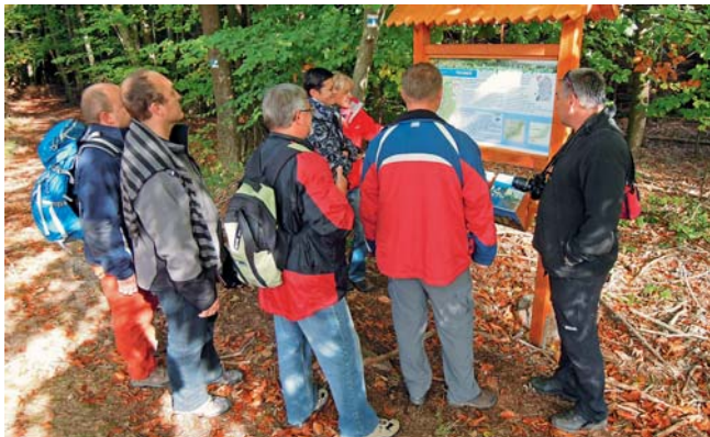
Naučná stezka vede z Nové Hradečné do Libiny.