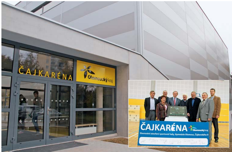
Studenti a sportovci mohou nyní využívat nové sportovní zařízení.

Olomouc • Novou sportovní halu s víceúčelovým hřištěm za 66,5 milionu korun slavnostně otevřeli olomoucký hejtmán Martin Tesařík (ČSSD) společně s radními kraje, členy Českého klubu olympioniků, sportovci a zástupci škol z regionu. Název