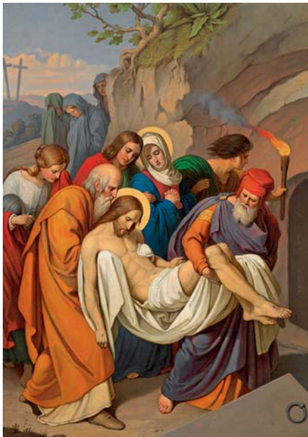
Josef Fühlich – Kladení Krista do hrobu, olej