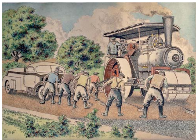
Výstava zachycuje stavbu a údržbu silnic.

Vikýřovice • Pro své příznivce připravili pracovníci Muzea silnic ve Vikýřovicích letos předposlední výstavu, tentokrát vloženu na cestářské a silniční téma. Expozice „Putování časem aneb Cestáři náš, těžkou práci máš!“ prostřednictvím vlastních muzejních sbírkových předmětů zavede návštěvníky na silnice a mosty Čech, Moravy a Slezska a ukáže práci těch, kteří je stavěli, opravovali a udržovali. Řada vystavených exponátů tak může vysvětlit otázky s cestami, silnicemi a mosty souvisejícími. „Příkladem může být známá písnička „Cestářská“. Snad každý ji zná, je o cestáři žijícím na silnici do