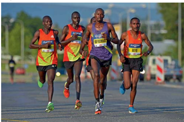
Závod obdržel mezinárodní známku.

Olomouc • Olomoucký 1/2Maraton získal výjimečné ocenění v podobě stříbrné známky kvality Mezinárodní asociace atletických federací (IAAF Silver Road Race Label). Závod se tak zařadil po bok světových běžeckých měst jako je Madrid, Rotterdam, Ósaka nebo Řím, které pro rok 2012 získaly stejné ocenění. Každý rok IAAF vyhodnocuje úroveň jednotlivých závodů a na základě splnění kritérií známky přiděluje. Federace tak hlídá úroveň jednotlivých závodů a běžcům i partnerům závodů zaručuje vysoký standard akcí. Závodů jsou rozděleny do třech