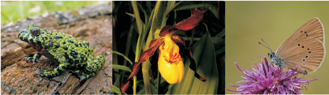
Mezi ohrožené druhy živočichů a rostlin patří mj. kuňka ohnivá, střeževník pantoflíček či modrásek bahenní.

Olomouc • Nový webový portál pomůže jak zájemcům při hledání přívody, jak i práce ve specifickém oboru, tak zaměstnavatelům při výběru externích spolupracovníků do své firmy. Výhodou pro obě strany je rychlá dostupnost údajů, jejich aktuálnost a pracovitý systém referencí. Portál www.externiste.cz obsahuje databázi externistů, od profesionálů, odborníků, studentů až po živnostníky, kteří hledají přívody nebo brigádu. Každý, kdo chce nabídnout své schopnosti a dovednosti, se zde může bezplatně zaregistrovat. Pro firmy, které hledají externí spolupráci specialisty nebo třeba potřebují jen poradit, jsou Externisté.cz efektivní cestou k jejich nalezení. To vše zcela zdarma a bez registrace. DD