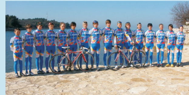
Cyklisty čeká nová sezóna.