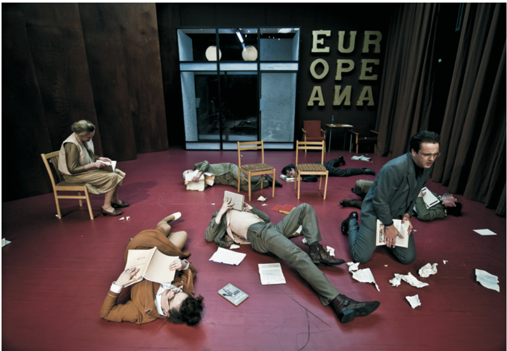
Návštěvníci se mohou těšit také na adaptaci současné prózy Europeana.