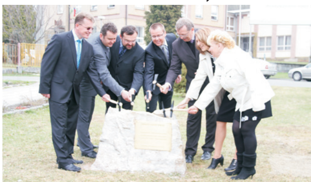
Poklep základního kamene.

Olomoucký kraj • Novou kanalizaci v délce přesahující 30 kilometrů získají obce Hrabišín, Dlouhomilov a Brníčko na Šumpersku. Stavba, která byla slavnostně zahájena 12. dubna, si vyžádá náklady ve výši 235 milionů korun. Většinu z této sumy zaplatí Evropská unie, dotaci 12 milionů korun obcím poskytne Olomoucký kraj. Projekt počítá i se zvýšením kapacity čistírny odpadních vod v Leštině, kam kanalizace povede.