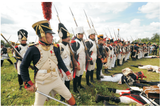
Velký Týnec ožije napoleonskými slavnostmi.

Velký Týnec • V táborové ležení s přestřelkami i velkými bitvami se v rámci Týneckých napoleonských slavností promění od 11. do 13. května Velký Týnec. „Jedná se o připomenutí dvouletého výročí události roku 1812, a to zejména Napoleonova tažení do Ruska, kterého se na francouzské straně účastnil také pomocný sbor rakouské armády pod velením knížete Schwarzenberga. V rakouské armádě tehdy sloužili vojáci z celého území tehdejšího Rakouského císařství, tedy i Češi, Moravané, Slezané, Slovinci a Maďaři. Zavzpomínáme na tyto muže,