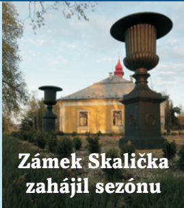
Zámek Skalička zahájil sezónu