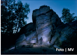
Jedním ze zastavení bude Bradlo.

lidé, kteří museli bojovat za císaře cizí země, někdy i několik tisíc kilometrů od domova,“ uvedl za pořadatele Pavel Grenar. Návštěvníci se mohou těšit na ukázky dobových vojenských jednotek, jejich výcvik a běžný život vojáků účastnících se tohoto tažení. Chybět nebudou ani bitvy, ukázky života šlechty a prostých vesničanů, dobová řemesla a jarmark. Slavností se aktivně zúčastní jednotky z mnoha zemí, role civilního obyvatelstva se zhostí členové několika folklorních souborů z Olomouckého a Zlínského kraje.