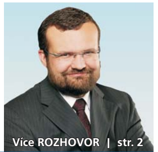
Více ROZHOVOR | str. 2

Letní zahradnická Flora nabídne dožínkovou slavnost i biblickou zahradu