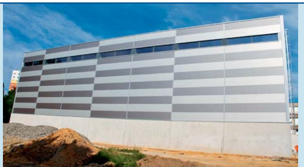
Hala bude mít špičkové parametry.