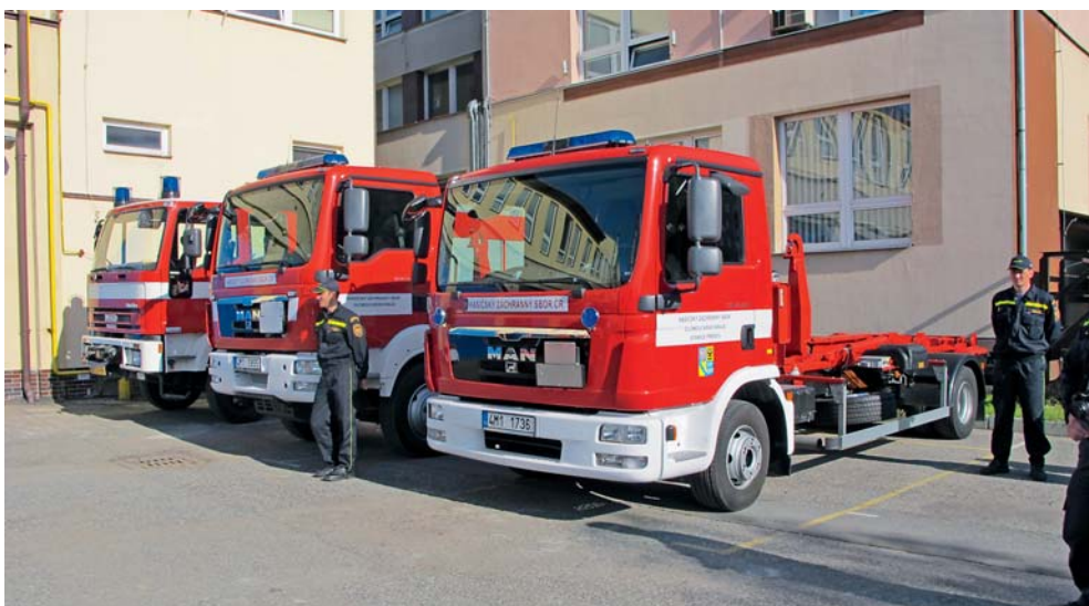
Složky integrovaného záchranného systému dostanou od kraje celkem 5 milionů korun.