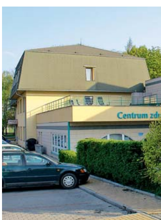
Centrum zdraví Bohuňovice slouží jako ubytovna a malý aquapark.

V přízemí budovy je situována vodní zóna s plaveckým a dětským bazénem s atrakcemi, malým dětským bazénem pro děti do 4 let – takzvanou „ledvin-