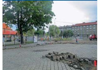
Stavební práce potvrzují do listopadu.