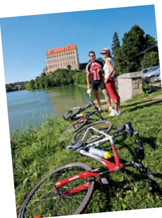
Tipů na výlet je v Olomouckém kraji skutečně hodně.

Atraktivní prohlídky přizpůsobené dětem přináší téměř všechny hrady a zámky v regionu a k návštěvě zve také zoologická zahrada na Svatém Kopečku u Olomouce s více než 400 druhy zvířat. Prázdninové měsíce jsou ideální rovněž pro pěší i cyklistické výlety. Na nenáročných cyklistických vyjíždkách jsou jako stvořené lužní lesy v CHKO Litovelské Pomoraví nebo cyklostezka Bečva. Rodiny s dětmi mohou vyzkoušet také novinku letošní sezony, půjčit si čtyřkolo a projet si historické centrum