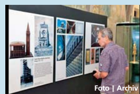
Výstava potrvá do konce září.