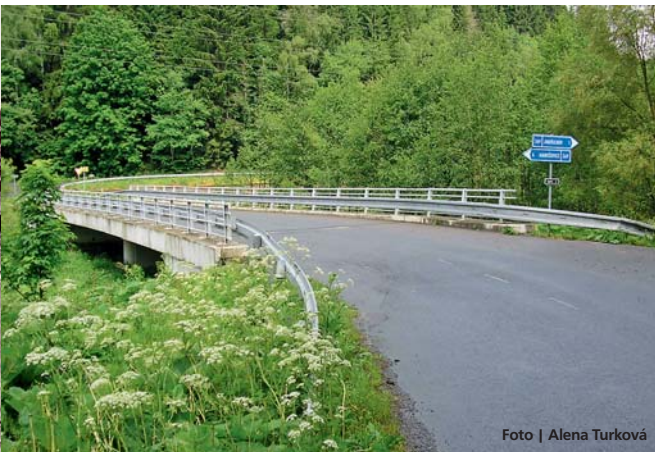
Nový most na místě zničeného – červen 2012

Mnohé fotografie prezentují stav silniční sítě šumperského okresu bezprostředně po povodni, současné záběry zachycují především nové mosty. Návštěvníci mohou