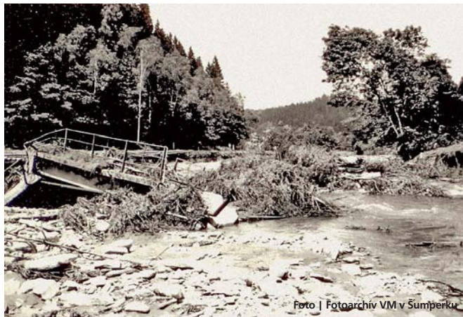
Most na silnici směrem na Pusté Žibřidovice v červenci 1997

Vikýřovice • Od ničivé povodně na Moravě v roce 1997 uplyne letos 15 let. Tato událost postihla 36 obcí šumperského okresu, zdevastovala 105 km 2 jeho území, vyžádala si 4 lidské životy a donutila přes tři a půl tisíce lidí opustit své do té doby bezpečné domovy.