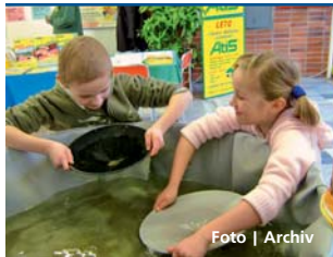
Veletrh propaguje turistiku a cestovní ruch.