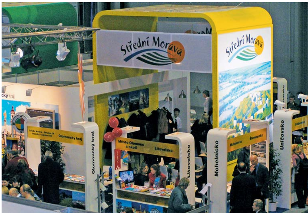
Expozice nabídne stejně jako v předchozích letech několik novinek z oblasti cestovního ruchu.

Brno • Expozice Olomouckého kraje představí novinky z oblasti cestovního ruchu od 13. do 16. ledna na brněnském veletrhu Regiontour 2011. Milovníci zimních sportů zde najdou nový zimní katalog s přehledem lyžařských tras v Jeseníkách a s vytipováním aktivit vhodných pro zimní dovolenou v Olomouckém kraji. K dispozici budou i informace o novém lyžařském areálu v Koutech nad Desnou, který je největším skiareálem na Moravě a jako první v republice se může pyšnit 6sedačkovou lanovkou. Expozice dále nabídne turistickou mapu kraje, cyklomapy Jeseníků a Střední Moravy či aktualizované vydání velmi oblíbených naučných stezek. Příznivci jízdy na kole se můžou těšit na nového cykloprůvodce, který jim komplexně představí 24 nejzajímavějších tras vedoucích Moravou a Slezskem. Brožura s názvem „Morava a Slezsko – cykloprůvodce“ je vydána ve třech jazykových mutacích, a to v češtině, polštině a němčině. Na stánku nebude chybět ani