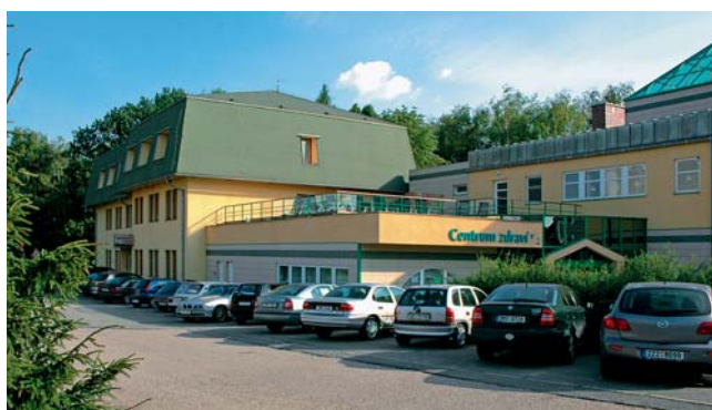
Vstup a ubytovna Centra zdraví

liónů korun opravila ubytovací křídlo budovy. Střechu nad hlavou zde tak aktuálně našli lidé postižení tehdejší povodní. „O rok později zastupitelstvo rozhodlo o rekonstrukci zbytku objektu na „Zdravotně rehabilitační centrum“ s výukovým bazénem. Celkové náklady včetně prvotního nákupu zdevastovaného objektu představovaly pro obec částku asi 52 miliónů korun. „Dle znalců mělo dokončené dílo reálnou hodnotu přibližně dvojnásobnou. Obec vložila z vlastních prostředků 7 miliónů korun, zbylé finance činily různé dotace,“ informoval Jiří Petřek. Slavnostní otevření objektu se uskutečnilo v roce 2003. I po pěti letech bylo možno s hrstí konstatovat, že celý komplex byl ekonomicky zcela soběstačný a obec nemusela jeho provoz dotovat.