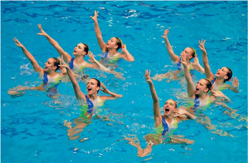
Hanácké akvabely měly obrovský úspěch.