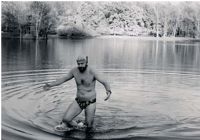
Snímky charakterizují každodenní život v Přerově.