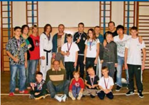
Škorpioni se v Pelhřimově neztratili.