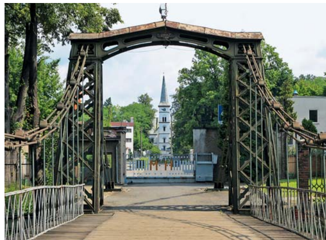
Visutý most na řece Mała Panew v Ozimku