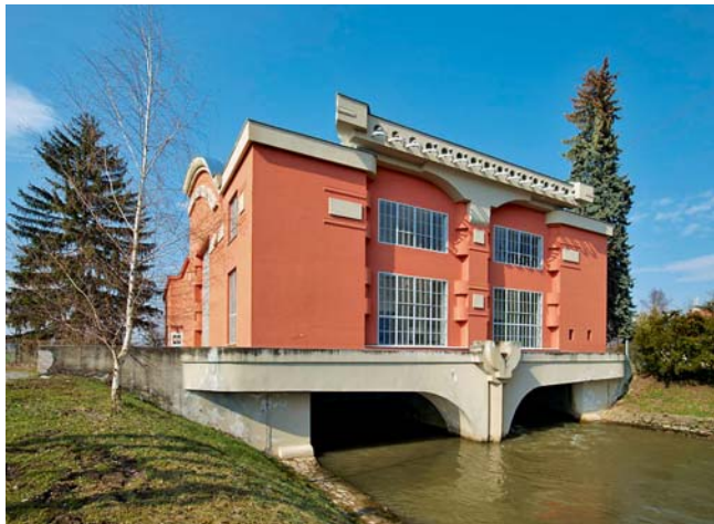
Hydroelektrárna v Háji u Třeštiny