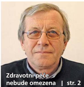
Zdravotní péče nebude omezena | str. 2