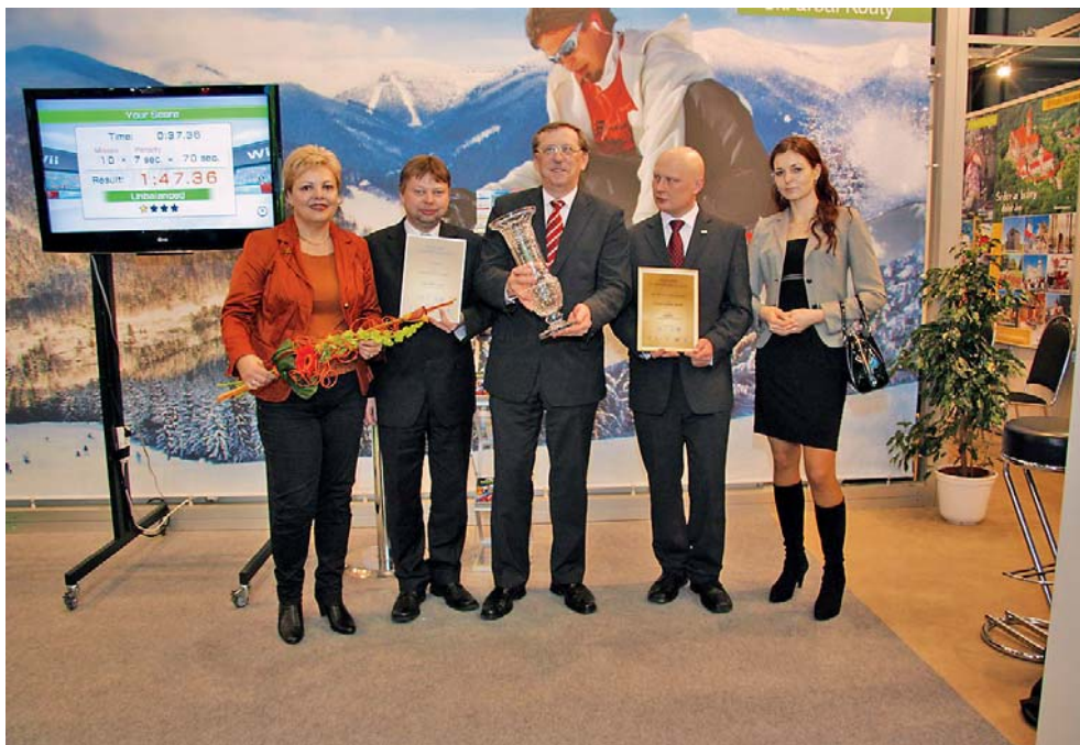
Olomoucký kraj získal na brněnském veletrhu Velkou cenu cestovního ruchu.

Velká cena cestovního ruchu vznikla spojením dvou prestižních soutěží Náš kraj a Grand Prix Regiontour. V minulosti byla soutěž otevřena pouze krajským úřadům, organizacím destinačního managementu, turistickým regionům, městům a obcím. Letos poprvé se do soutěžního klání zapojily i cestovní kancelá-