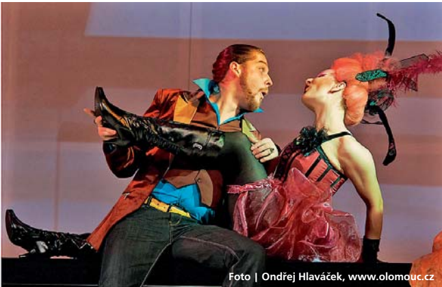
Shakespeara nabízí Moravské divadlo v novém provedení. bylo přijit o hlavu,” zdůraznil dramaturg. „Celou hrou prostupují dvě základní divadelní situace současně. Jednu bychom mohli nazvat „oko za oko“, tu druhou „něco za něco“. První je spjata se starozákonní odplatou,