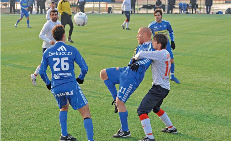
Hráči Sigmy předvedli dobré výkony. Kromě poháru získali i finanční ohodnocení.

Olomouc • Olomouc hostí finále poháru volejbalistek Olomouc, Prostějov. V hanáckém držení zůstane Český pohár volejbalistek. Do finále, které 14. února hostí Olomouc, totiž postoupily týmy SK UP Olomouc a VK Prostějov. Oba celky do boje o prvenství postoupily zcela zaslouženě, když deklasovaly své semifinálové soupeře. Vysokoškolačky si poradily se Slavii Praha 3:0 a 3:0 a ani Modřanky proti KP Brno neztratily jediný set. „Pokusíme se o zázrak. Myslím, že přijde hodně diváků a prostředí bude důstojné finále Českého poháru,“ řekl olomoucký trenér Jiří Teplý. | KT