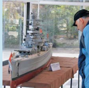
Výstava zaujme sběratele i modeláře.

O dva týdny později, ve dnech 17. až 19. března, se zase brány výstaviště otevrou veletrhu pa-