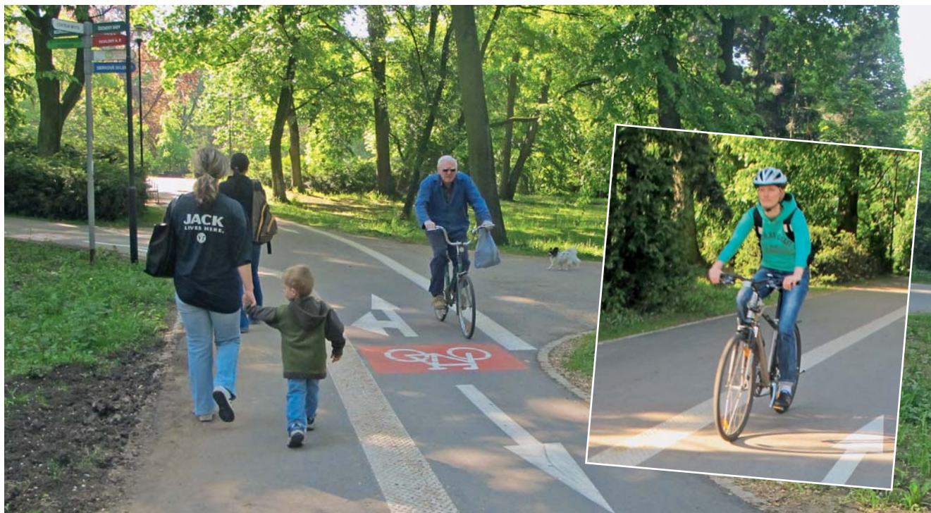
Lidé se mohou těšit na další cyklostezky.

Olomoucký kraj • Města a obce v Olomouckém kraji vybudují 7 nových cyklostezek. Kraj na výstavbu poskytne více než 6 miliónů korun.