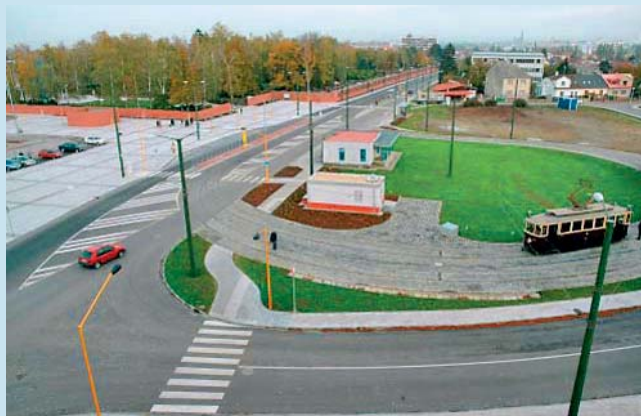
Krajské investice přispějí k bezpečnosti na silnicích.

Letos by mělo přes 500 tisíc korun získat město Jeseník. Peníze využije na vybudování nového přechodu pro chodce u hostince U Garáží a nových chodníků v ulicích Bezručova a Seifertova. V Prostějově vybudují přechod pro chodce a dva nové základy pro autobusy