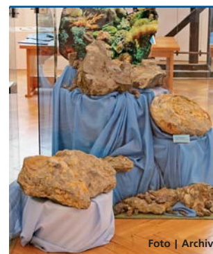
Tropický útes Čelechovice na výstavě