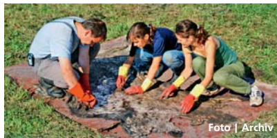
Chemických metod využívali také pravěcí kožuškové.

Přerov • Výstava na téma „Náš život s chemií“ bude od 20. května až do 18. září k vidění v historickém sále přerovského zámku. V pátek 27. května od 8 do 17 hodin je pro návštěvníky připravena