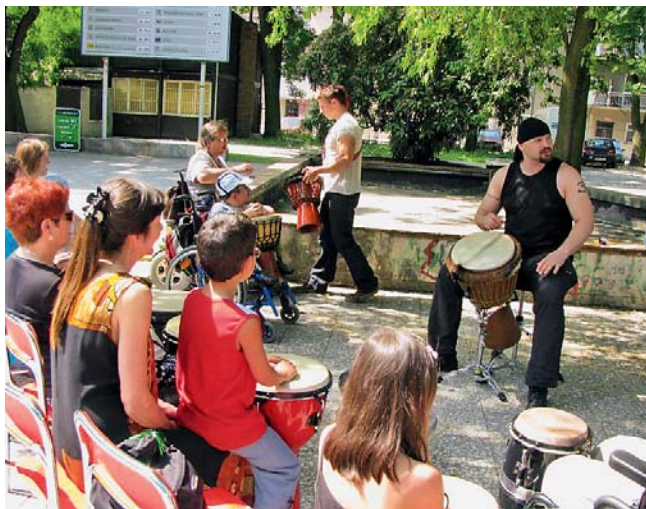
Výstava nabídnou kvalitní doprovodný program, chybět nebudou ani keramické dílny.

Olomouc • Výstava nazvaná Mezi námi – Dny zdravotně postižených se uskuteční na olomouckém Výstavišti Flora od 9. do 11. června. Poprvé jsou její součástí i Dny seniorů. Výstava nabídne zájemcům pomůcky, potřeby a služby pro handicapované, bezplatné odborné poradenství a chybět nebudou ani denní ukázky netradičních léčebných terapií se speciálně vy-