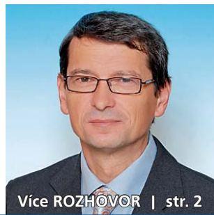
Vice ROZHŮVOR | str. 2