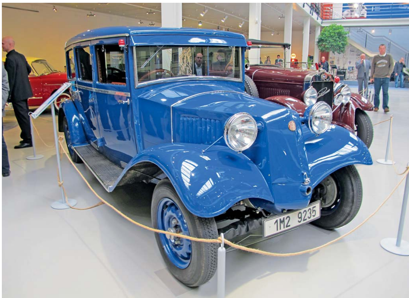
Největší soukromé muzeum historických automobilů v ČR – Veteran Arena – dostane příspěvek na provozní a reklamní výdaje.