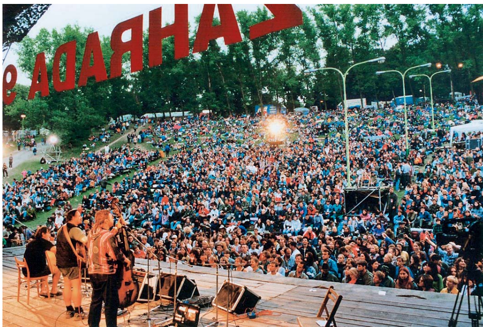
V Náměšti zahrají desítky skupin a sólistů.

Na festivalu se budou podle něj potkávat folkové legendy jako je například Žalman a spol., Jan Nedvěď, AG Flek, Cop, Jablkoň nebo Hradištan. První den bude patřit zejména Vlastovi Redlovi, který se vrací na podia s novou kapelou a jeho přáteli. Představí se i skupina Sto zvířat, písničkář Tomáš Klus nebo legenda Peter Lipa. Blues zastu-