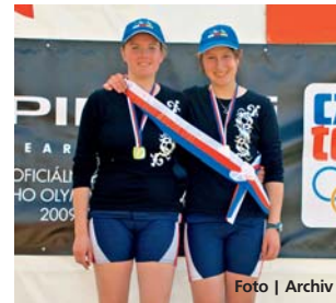
Veslaři zahájili sezonu úspěšně.