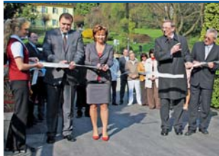
Nová lávka bude sloužit nejen lázeňským hostům.