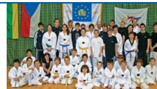
Škorpioni se v konkurenci prosadili.

V extralize startovaly i další dva hanácké týmy PVK Přerov a TJ Sokol Šternberk. Přerovanky nedokázaly navázat na vydařenou základní část a ve čtvrtfinále hladce podlehly Olomouci. Precheza tak hrála ve skupině o 5. až 8. místo a nakonec se musela spokojit se sedmou příčkou. Šternberský tým se od začátku soutěže pohyboval na dně tabulky a nakonec musel hrát kvalifikaci o extraligu. V nejvyšší soutěži se Sokol nakonec udržel a bude extraligu hrát i v příští sezoně. | ZK