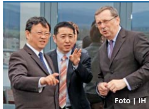
Čínskému velvyslanci se v Olomouckém kraji líbilo.