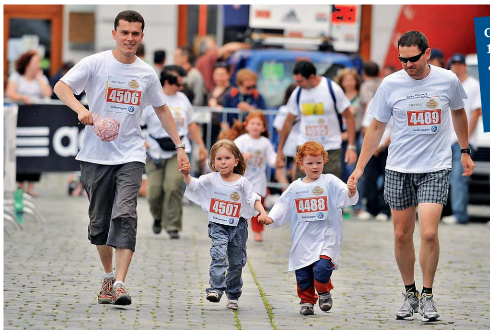
Běhu se mohou zúčastnit děti i rodiče.

Olomouc • Centrum moravské metropole v červnu opět ovládnou nadšení sportovci všech věkových kategorií. Zájemci se mo-