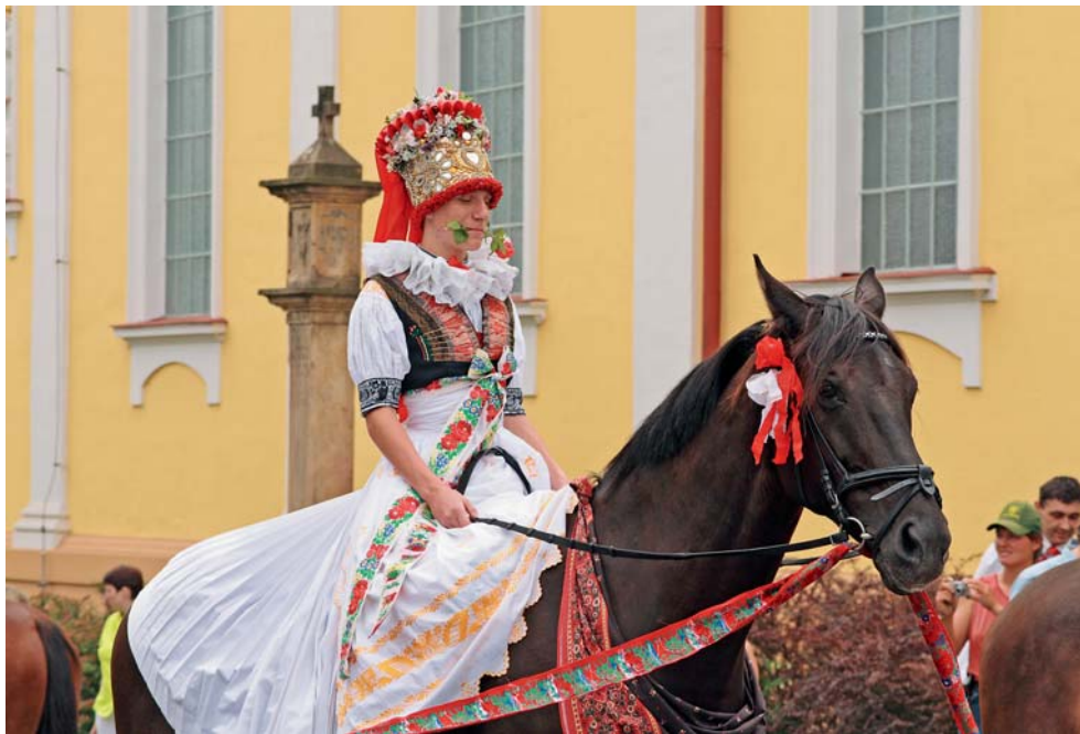
Hanáci se setkají v Doloplazích.