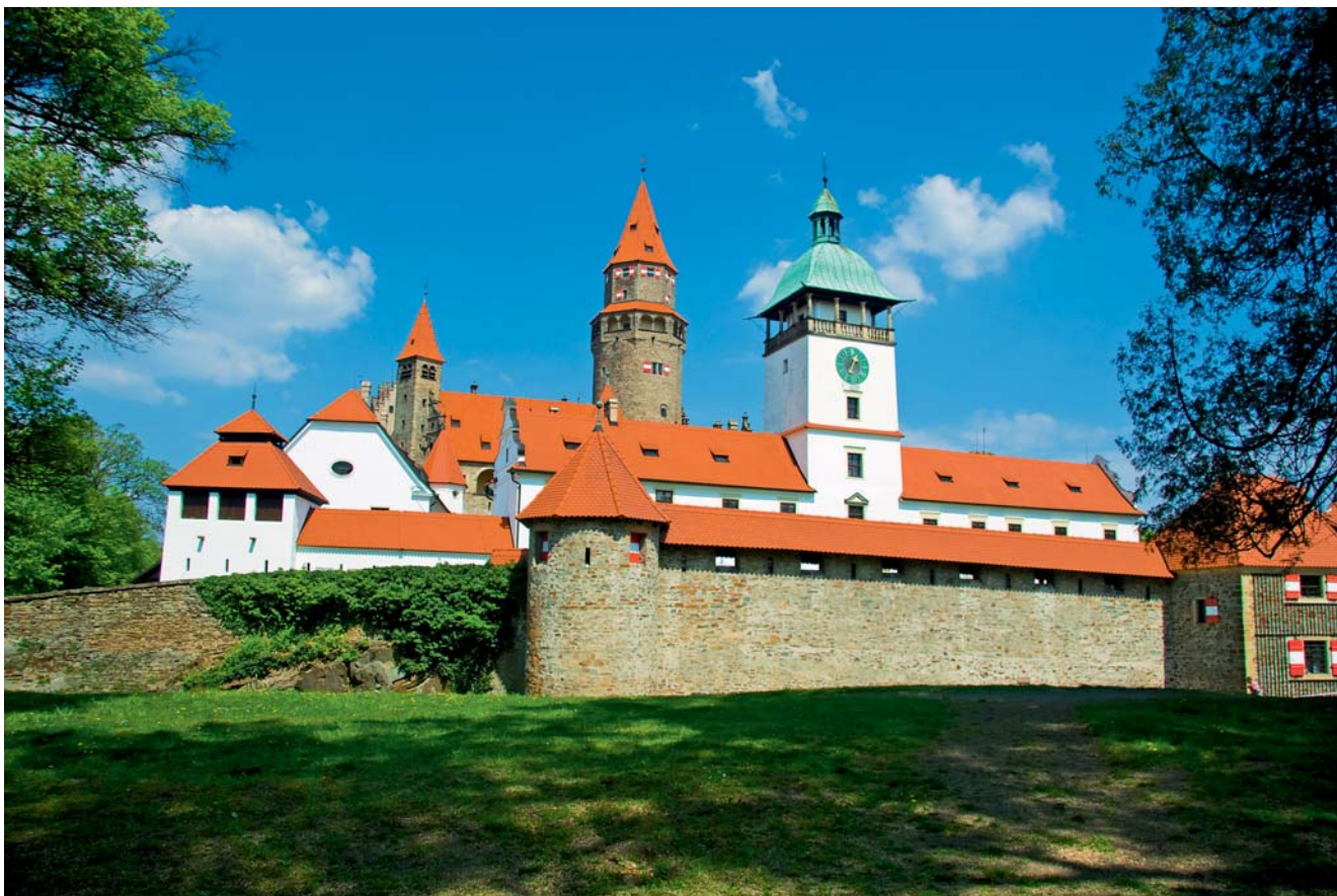
Turisté se mohou v příští sezoně těšit na nasvícený Bouzov.

Hrad Bouzov a přístupové cesty k němu budou od začátku návštěvní sezony příštího roku ve večerních a nočních hodinách slavnostně osvětleny