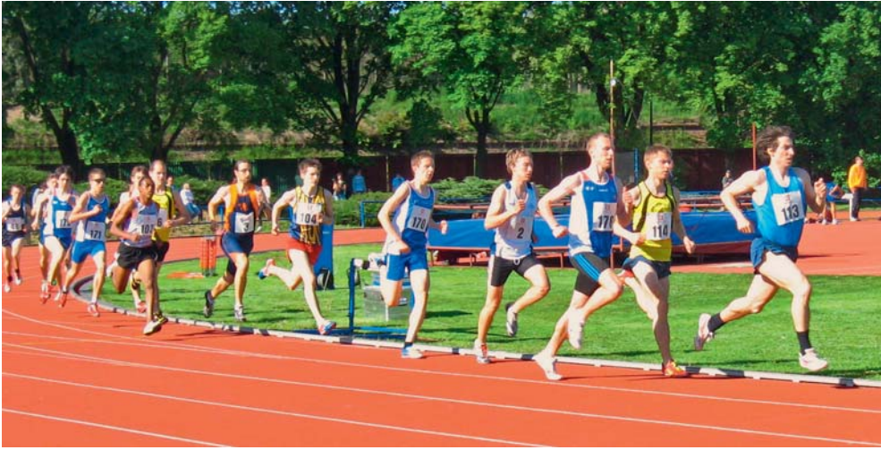
Do Olomouce přijeli nejlepší čeští závodníci.

Přerov, Jablonec nad Nisou • Olomoucká taneční škola M-Plus uspěla na mistrovství Moravy (MM) i na mistrovství České republiky (MČR). Na MM, které proběhlo v Přerově dosáhla ve street show na finálová umístění ve všech věkových kategoriích. Prvenství získala v dětské věkové kategorii i v mini, druhou příčku si vytancovali tanečníci hlavní věkové kategorie a třetí místo junioři. V Jablonci nad Nisou se pak na MČR utkalo 12 nejlepších souborů z celé republiky. Nejmenší tanečníci z M-plus dosáhli v kategorii street show na zlato, děti získaly čtvrté místo a junioři spolu s tanečníky v hlavní věkové kategorii dosáhli na pátou příčku. Všechny věkové kategorie tak postoupily na mistrovství světa a Evropy, které se uskuteční na podzim.