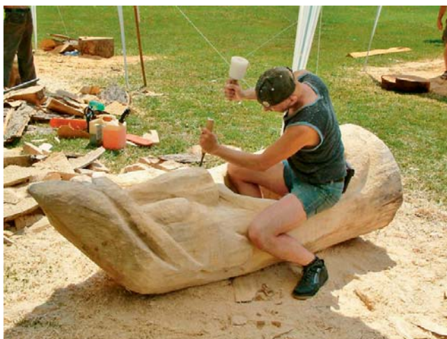
Festival zve na umění i dobrou zábavu.

Vlaské • Chalupa Pod Sviní horou v obci Vlaské bude od 18. do 23. července opět centrem uměleckého festivalu Zlaté ruce 2011. V panenské přírodě podhůří Jeseníků se pod širým nebem setkají tři desítky umělců z různých uměleckých oborů a milovníci umění a dobré zábavy. „Od pondělí 18. července představí svůj talent, jehož výsledkem budou až dvoumetrové dřevěné sochy, celkem devět řezbářů. Dvojice mladých studentů bude tvořit sochy z pórovitého materiálu a z rukou keramika vzejde socha v životní velikosti. Současně budou probíhat prodejní výstavy všech ostatních 18 umělců,“ uvedl za pořadate-