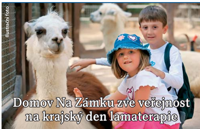
Domov Na Zámku zve veřejnost na krajský den lamaterapie

Soutěž Vesnice roku si klade za cíl vzbudit u obyvatel jednotlivých obcí nejen větší zájem o prostředí, ve kterém žijí, ale i o tradice a kulturní památky, které byly v některých případech řadu let opomíjeny. Obec na regionální úrovni soutěží o následující ocenění: 1. místo a Zlatá stuha – vítěz krajského kola 2. místo v krajském kole soutěže 3. místo v krajském kole soutěže Modrá stuha za společenský život Bílá stuha za činnost mládeže Zelená stuha za péči o zeleň a životní prostředí Oranžová stuha za spolupráci obce a zemědělského subjektu. Loňského ročníku krajského kola soutěže se zúčastnilo 36 obcí, Vesnicí roku 2009 se stala obec Víkyřovice. Vyhlášení vítěze celostátního kola se uskuteční 10. září u příležitosti konání mezinárodního festivalu dětských folklórních souborů Písní a tancem v Luhačovicích. I KL