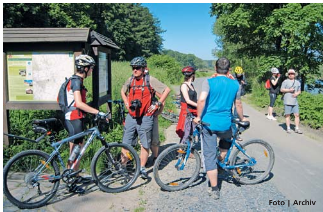
Cyklostezka Bečva je vhodná pro cyklisty, in-line bruslaře i vozičkáře.

Olomouc • Olomoucký kraj dá Mikroregionu Hranicko dva miliony korun na dokončení cyklostezky Bečva. Předpokládané náklady dostavby cyklostezky se pohybují okolo 9,6 milionů, při financování použije mikroregion také dotaci z Regionálního operačního programu Střední Morava. Cyklostezka by měla být dostavěna během příštího roku. Olomoucký kraj na stavbu cyklostezky Bečva poskytl v minulosti již 1,4 milionů korun. Cyklostezka Bečva, která vede z Velkých Karlovic přes Vsetín a z Horní Bečvy přes Rožnov