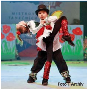
Prvenství získala formace mini.