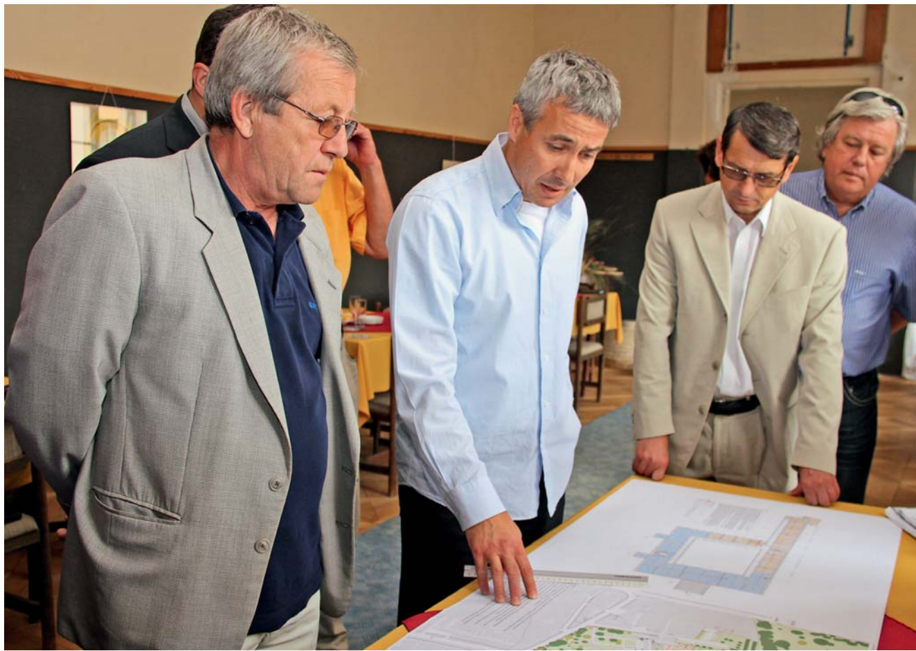
Radní diskutovali nad záměry dalšího využití zámku v Čechách pod Kosířem.

Čechy pod Kosířem • Plány budoucího využití byly hlavním tématem návštěvy členů Rady Olomouckého kraje v zámku v Čechách pod Kosířem.