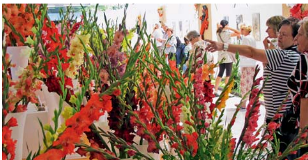
Letní Flora tradičně přiláká zájemce z celé republiky.

Časový harmonogram, info o předprodeji vstupenek, dopravní spojení, parkovací místa a řadu dalších informací na www.sternberskykopec.com . | AŠ