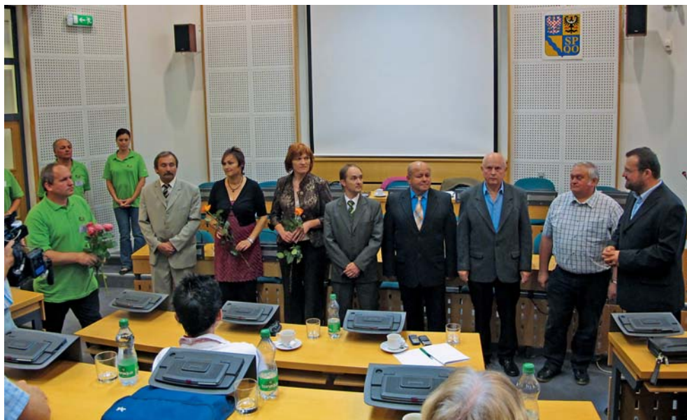
Soutěž Vesnice roku slaví jubilejní desáté výročí.