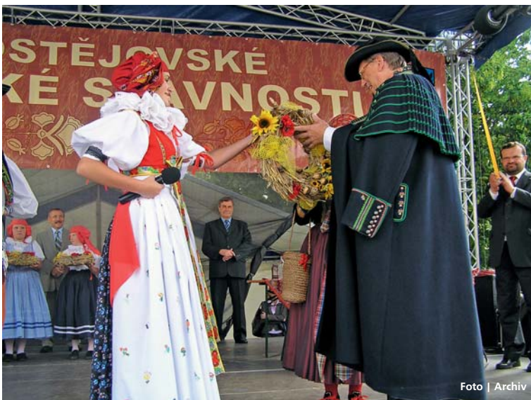
Prostějovské hanácké slavnosti patří mezi podpořené významné projekty.

stezka Bečva – částkou 300 tisíc Kč. Kraj rovněž podpořil již XXIX. ročník Prostějovských hanáckých slavností, jejichž součástí byly v předcházejících letech i krajské dožínky. Významným projektem se díky podpoře 100 tisíc Kč stane i bronzový model olomouckého opevnění z poloviny 18. století, jehož autorem je akademický sochař Jiří Žlebek. Model o rozměrech 7,5 krát 6 m bude součástí Muzea olomoucké pevnosti. Letos již zastupitelé rozdělili v tomto nejoblíbenějším dotačním titulu Olomouckého kraje přes 48 milionů Kč, a to mezi 102 úspěšných projektů. | PK