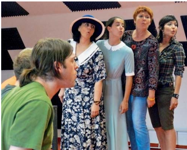
Festival zve na umění i dobrou zábavu.

Olomouc • Poslední srpnový týden bude v Olomouci patřit divadlu. Na druhém ročníku festivalu Olomoucké divadelní prázdniny se představí nejen domácí soubory, ale také hosté z Finska. Festivalový program odstartuje v pondělí 22. srpna alternativní soubor Teatteri Telakka z finského města Tampere. Hned dvakrát uvede v Olomouci pohybové představení s názvem Kama Sutra. V dalších dnech bude festival patřit domácím souborům. Členové činoherního souboru Moravského divadla Olomouc nabídnou ve středu 24. srpna komorní představení Nemravná píseň. Prostřednictvím humorových výstupů a písní připomíná režisér Milan Šotek éru prvorepublikového kabaretu Červená sedma. V Nemravné písni hrají