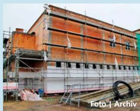
Středisko má být otevřeno v roce 2013.

Olomouc • V minulých dnech skončily práce na hrubé stavbě Krajského operačního a informačního střediska Hasičského záchranného sboru Olomouckého kraje. Objekt na Schweitzerově ulici v Olomouci staví pro záchranný kraj. Rozpočet celého projektu nového střediska, které se stane součástí integro-