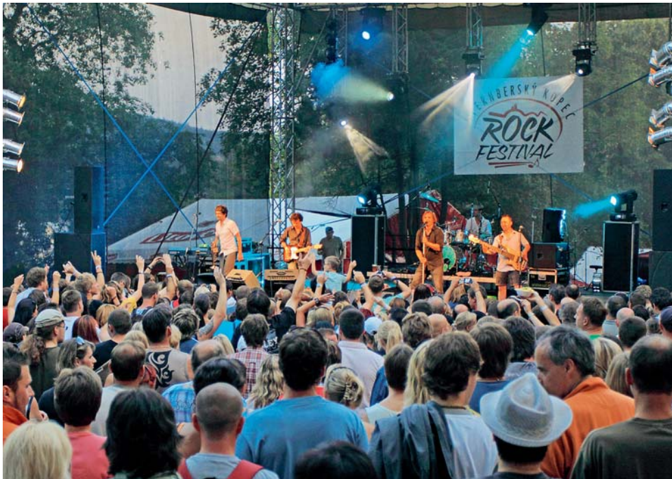
Osmý ročník Šternberského kopce sází na esa hudebního showbyznysu.

Šternberk • Poslední červencový víkend bude i letos patřit hudebním příznivcům. V sobotu 30. července ve dvě hodiny po poledni odstartuje v zahradách šternberského hradu již osmý ročník festivalu Šternberský kopec. Hudební menu nabídne řadu populárních interpretů česko-slovenské rockové a pop-rockové scény. Dramaturgie VIII. ročníku Šternberského kopce sází na esa současného hudebního showbyznysu. Hlavním hostem festivalu bude fanoušky Šternberského kopce žádaná slovenská šestičlenná formace No name v čele s Igorem Timkem. Dalšími lákadly pro publikum bezesporu budou slovenští Desmod, anglicky zpívající Sunshine či talentovaný muzikant Tomáš Klus. I letošní ročník přinese rockovou klasiku v podání stálice české hudební scény – kapely Arakain. Publiku se představí i muzikálový Ježíš, Kamil Strihavka, který do Šternberka zavítá se svou kapelou Leaders.