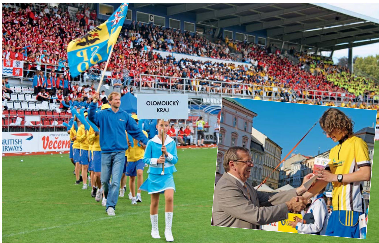
V obrovské konkurenci dokázali sportovci z Olomouckého kraje získat na olympiádě 4. místo.