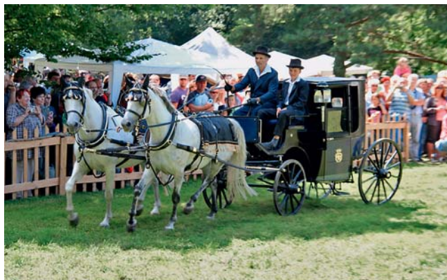
Mistři řemesla se sešli v zámeckém parku.