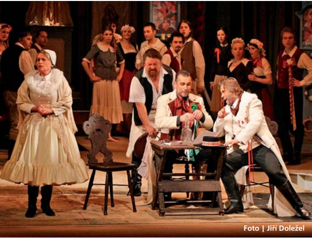
Prodaná nevěsta zůstává na repertoáru i v nadcházející sezoně, k vidění bude dokonce 9. září na Horním náměstí v Olomouci.