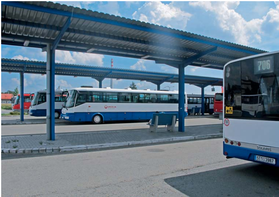
Železniční dopravu vystřídají autobusy.