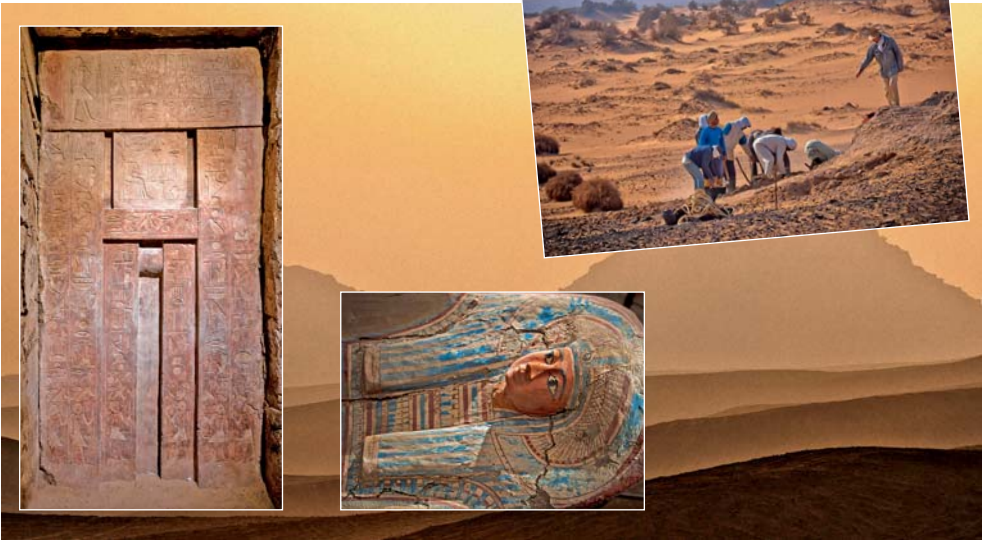
Výstava dokumentuje archeologické výzkumy a atmosféru Egypta.