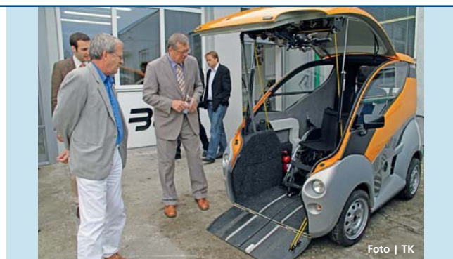
Elbee umožňuje postiženým jednoduchý nástup do vozu.

bu rychlostní komunikace R49 mezi Hulínem, Holešovem, Vizovicemi a hranicemi se Slovenskem a silnici R 55 od Olomouce, kolem Otrokovic až po Břeclav. Mezi priority patří i vyřešení dopravního přetížení města Přerova a modernizace železniční trati Otrokovice – Zlín. „Nedostatek peněz a útlum v přípravě dopravních staveb zpomaluje tolik potřebnou realizaci dokončení dálnice a výstavbu nových silnic. Tento trend je pro budoucí hospodářskou situaci v regionu velmi nepříznivý. Ze studie mapující vliv omezení investic do dopravní infrastruktury vyplývá hrozba zpomalení růstu HDP a zvýšení nezaměstnanosti,“ uvedl Libor Žádník, výkonný místopředseda sdružení, které usiluje o urychlení dobudování důležitých kapacitních silničních tahů. | ML