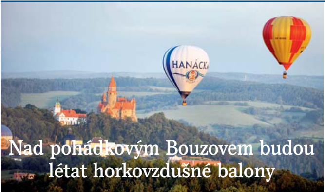
Balonová fiesta proběhne poslední srpnový víkend.

soukromých hrodek z doby stavitelů pyramid, ale i velkých šachtovitých hrodek z tzv. sasko-perské doby,“ doplnil Jiří Šmeral. Třetí část zavede návštěvníky daleko mimo běžně navštěvované oblasti Egypta, a to až do nitra Západní pouště. IJS