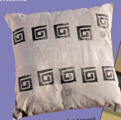
Batika Bellis – ručně barvené textilní výrobky