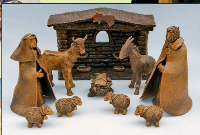
Ivana Bělařová – umělecká keramika