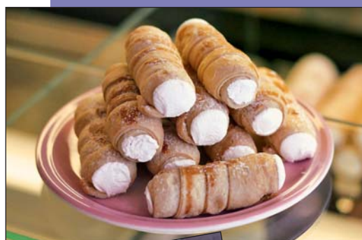
Olga Gřundělová – Staroměstské máslové trubičky