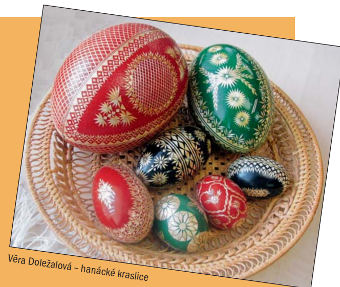
Věra Doležalová – hanácké kraslice