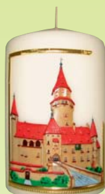
Charita Zábřeh – ručně zdobené svíce