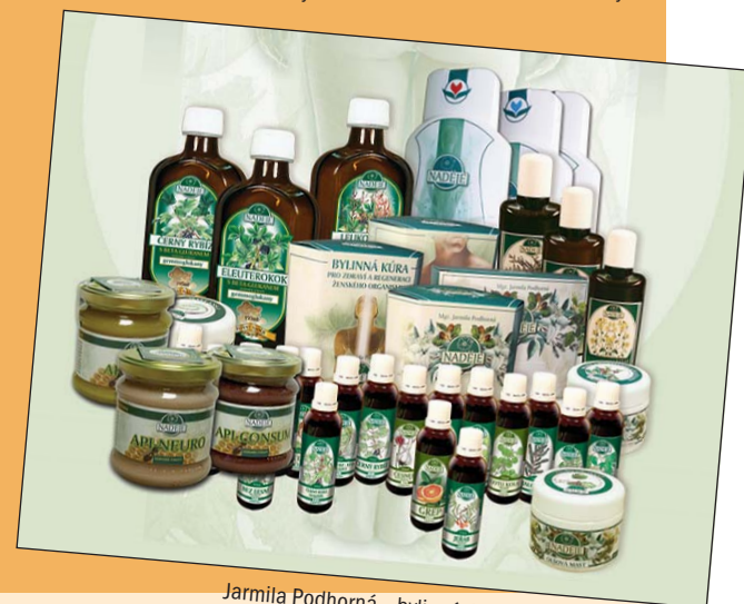
Jarmila Podhorná – bylinné tinktury a tinktury z pupenů