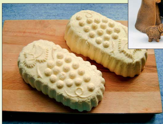
Michal Hrdlička – čerstvé ovčí a kravské sýry