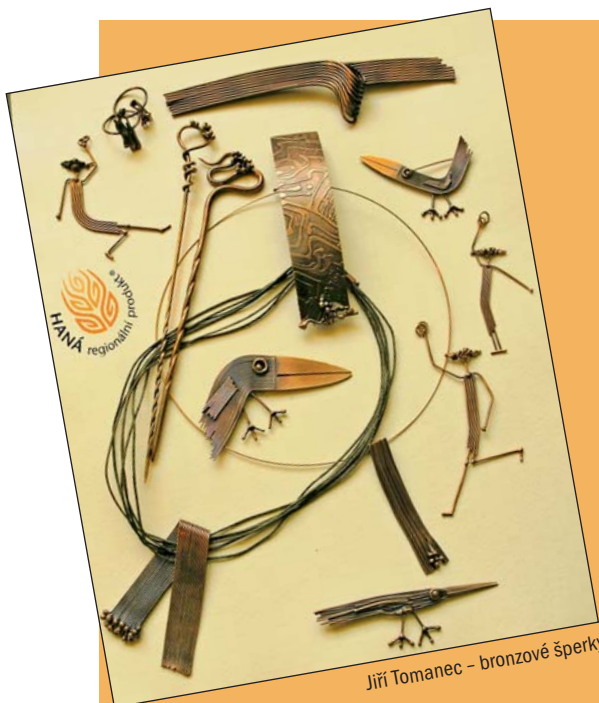
Jiří Tomanec – bronzové šperky