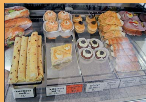
Zbyněk Poštulka – tvarůžkové moučníky