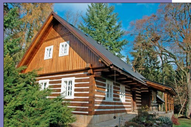
Janovy roubenky – hrubá stavba