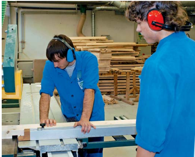
Po šikovných řemeslnících je na trhu práce poptávka.