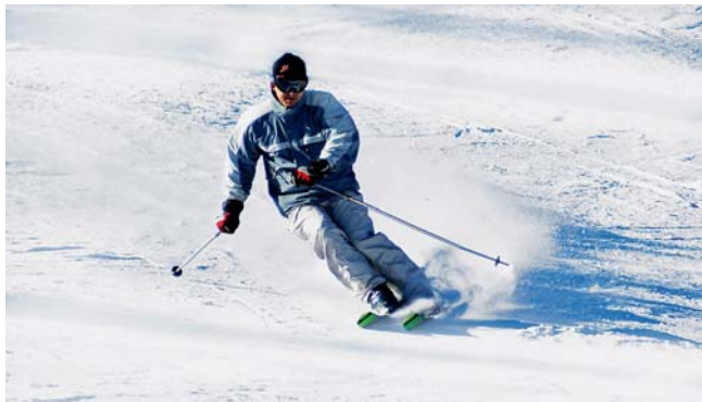
Lyžaři se mohou těšit na začínající sezonu.

ných lyžařských trasách, množství sněhu a další podrobnosti. Nový systém bude od letošní zimní sezony sledovat na 380 kilometru upravovaných běžeckých tratí. Na své si v Jeseníkách přijdou také příznivci sjezdového lyžování, kteří zde najdou desítky kilometrů sjezdovek pro zkušené lyžaře, snowboardisty, začátečníky i děti. Vybrat lze z nabídky bezmála čtyř desítek lyžařských areálů, které stále rozšiřují a zdokonalují své služby. První šestisedačková lanovka v České republice, čtyři sjezdovky dlouhé celkem 5,7 kilometrů,