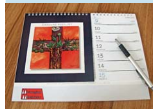
Kalendář bude prezentovat Olomoucký kraj.