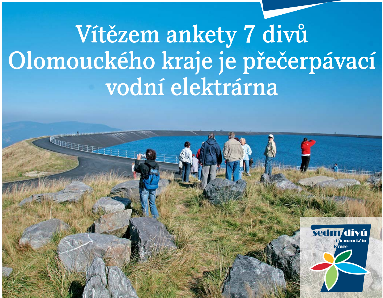
Elektrárna každoročně přiláká tisíce návštěvníků.

Olomouc • Přecherčpávací vodní elektrárna Dlouhé stráně na Šumpersku je vítězem prvního ročníku ankety 7 divů Olomouckého kraje. Svůj hlas jí dalo osm stovek občanů, kteří hlasovali prostřednictvím internetu. Na druhém místě skončily Rychlebské stezky na Jesenicku a pomyslnou bronzovou příčku obsadily Zlatorudné mlýny ve Zla-