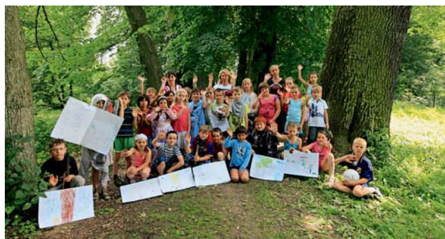
Alej ve Skaličce

Skalička • Několikaměsíční klání mezi dvanácti finalisty jubilejního desátého ročníku celostátní ankety Strom roku, který uspořádala Nadace Partnerství, skončilo. Vítězkou se s 12 645 hlasy stala alej ve Skaličce z Olomouckého kraje. Na druhé příčce se umístila Hruška v Horním poli ze Zlínského kraje (8 992 hlasů), třetí místo obsadil Skalický platan z Jihomoravského kraje (5 818 hlasů). Vyhlášení vítězů proběhlo v Brně 20. října, kdy se v České republice slaví Den stromů. Vítězek zpoplatněného hlasování v anketě letos dosáhl výše téměř 148 tisíc korun a opět směřuje do veřejné sbírky určené na výsadbu a ochranu stromů. „Výsledky ankety mne velmi potěšily. Již druhý rok po sobě má tato celostátní soutěž vítěze z našeho kraje, jelikož loni v hlaso-