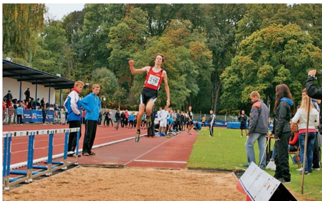
Borci z Církevního gymnázia Německého řádu odvedli opět skvělé výkony.

Olomouc • Patřili mezi favority, neponechali nic náhodě a po zdrcujícím výkonu vyhráli. A to již počtvrté za sebou! Republikové finále SŠP (středoskolského poháru) v atletice, které se konalo 11. října v Březlavi, přineslo „koncert“ v podání mladých mužů z Církevního gymnázia Německého řádu. Kluci, kteří jako vítězové krajského kola reprezentovali Olomoucký kraj, dokázali v konkurenci ze všech koutů České republiky zvítězit o více než 1.000 bodů, čímž rovněž přepsali dosavadní rekord. Ten, který v minulých letech rovněž vytvořili borci