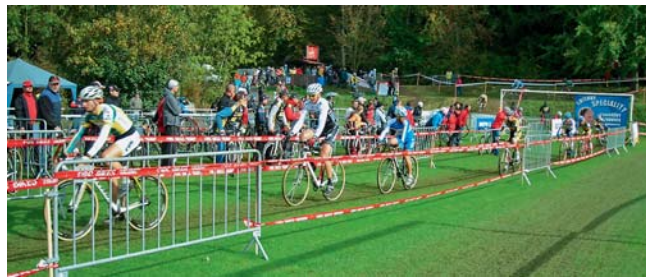
Vedoucí skupina ve druhém kole – Elite Loštice