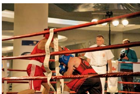
Na boxery byla skvělá podívaná.