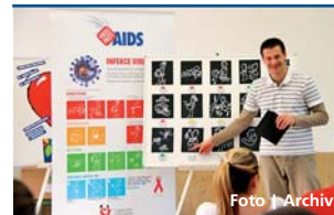
Osvětu na školách provádějí studenti UP Olomouc.