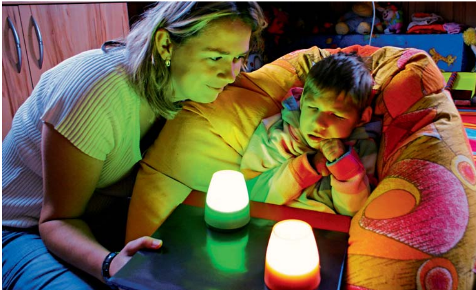
Postiženým dětem a jejich rodinám pomáhají zkušené odborníčky.

Zve na den otevřených dveří, zážitkové semináře, přednášky a výstavy