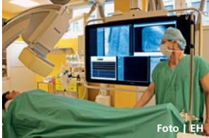
Nemocnice se může pyšnit skutečným unikátem.