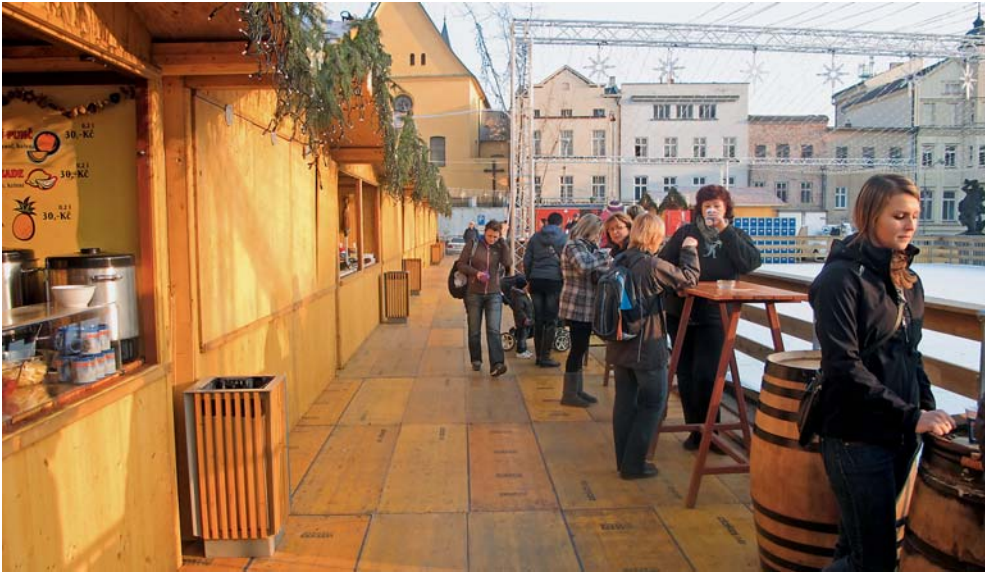
Na Dolním náměstí si lidé mohou zabruslit a občerstvit se punčem.