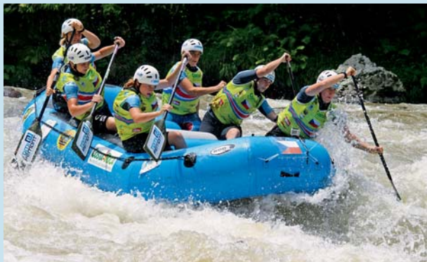
Posádce z Hané se dařilo.