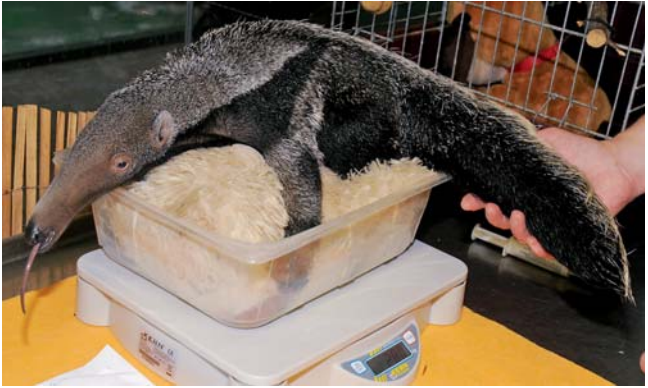
Mládě mravenečníka se narodilo před zraky návštěvníků.