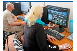
Provoz webových stránek ocení lidé se zrakovým postižením i zcela nevidomí.