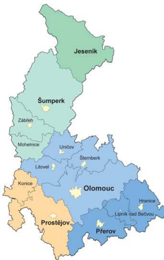
Obrázek 1 Správní členění Olomouckého kraje

Sídlo Krajského úřadu je v budově na adrese: