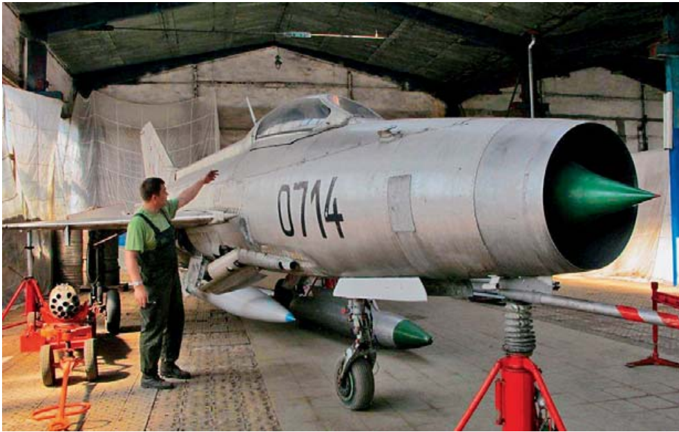
Muzeum vybudovali členové občanského sdružení 1. letecký školní pluk.

V muzejní expozici lze dále spatřit MiG-21. Při komentované prohlídce se zájemci mj. doví, že dosahoval rychlosti až 2 500 km za hodinu a vyráběl se licenčně v 60. letech v někdejším Československu. „Mezi nejceněnější exponát, který se nyní snažíme restaurovat, náleží MiG-15 neboli létající laboratoř. V 70. letech se na něm zkoušela první vystřelovací sedačka VS1-BRI. Je jedním ze dvou zachovaných exemplářů sovětských strojů, třetí havaroval se zkušebním a zalétávacím pilotem Rudolfem Duchoněm. Zahynul právě při testování vystřelovacího sedadla.