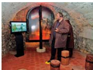
Mluvený komentář, filmová projekce a panely s exponáty dokáží ve sklepení navodit atmosféru průběhu čarodějnických procesů.

V přítomnosti sklepení domu lze zažít skutečně atmosféru období čarodějnických procesů. Každý návštěvník dostane sluchátka, v nichž slyší příběh, který sám o sobě vypráví nechvalně proslulý inkvizitor Boblig, na obrazovkách se promítá krutost tehdejšího věznění a ve dlabě svítí pětadvacet křížků. Každý za jednu z Bobligových obětí na Šumpersku,“ při-