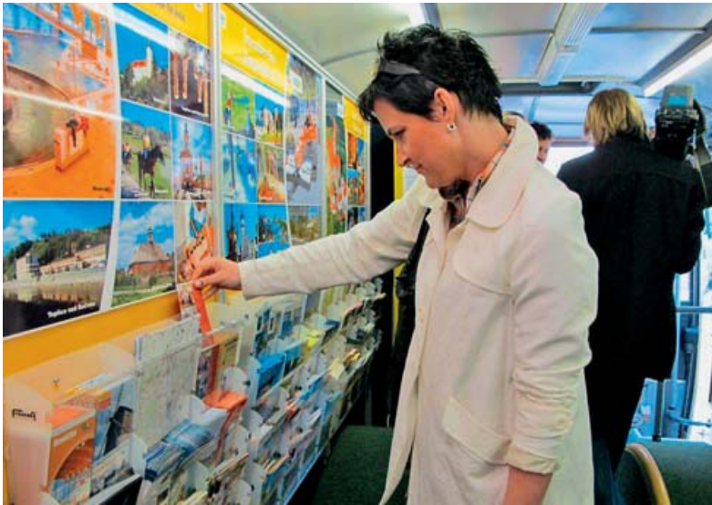
Infobus s propagačními materiály vyrazil na cesty.

K novinkám letošní sezóny nepatří pouze Veteran Arena v Olo-