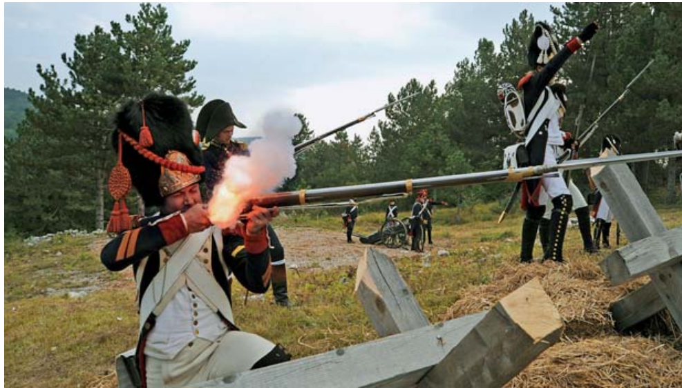
Historická vojenská jednotka z dob napoleonských válek je otevřena novým zájemcům.

Olomoucký kraj • Nadšenci s vášní pro vojenskou historii rozšířili svou členskou základnu Císařské Slavkovské gardy – La Garde Imperiale d'Austerlitz – na území celého Olomouckého kraje. Jednotku novodobých gardistů lze spatřit na bitevním poli při rekonstrukci tak slavných bitev jako byla bitva u Slavkova nebo u Waterloo. Často se jich účastní několik stovek uniformovaných vojáků z celé Evropy.