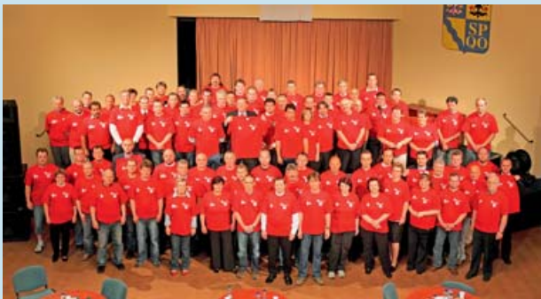
Dárci dostali Zlaté kříže.