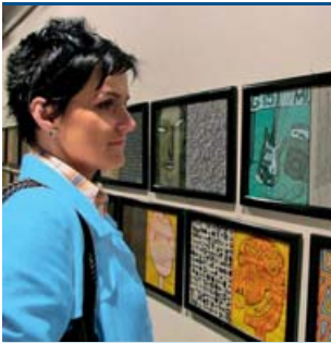
Tvorba Petra Války osloví širokou škálu milovníků umění.