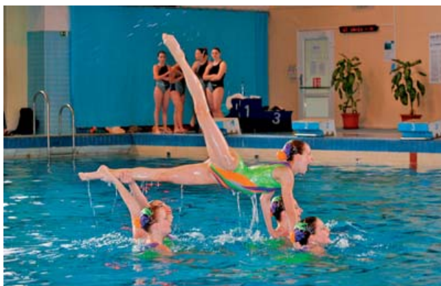
Akvabely předvedly kombinovanou sestavu.

kovém součtu skončila děvčata na 2. místě z 11 párů. V disciplíně týmových sestav uniklo