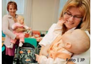
Pomáhají i maminky s podobnou zkušeností.

Pro region jeseníckého typu je důležitá mobilita pracovní síly související s dopravní obslužností. Zástupci starostů nám na květnovém setkání na téma nezaměstnanosti na Jesenícku poděkovali za současný rozsah autobusových a vlakových spojů. Myslím, že zachování dobré dopravní obslužnosti je dobrým příspěvkem kraje k boji s neza-