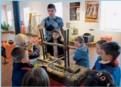
Malí i velcí ocení možnost vyzkoušet si některé staré techniky.

Šumperk • Cesta do pravěku je název jedné z největších archeologických výstav, kterou pro veřejnost připravilo Vlastivědné muzeum v Šumperku. Návštěvníci mohou nejen putovat pravěkými obdobími od dob lovců mamutů až po kultury z přelomu letopočtu, ale také si vyzkoušet některé pravěké techniky, například drcení zrn na zmotěrce, vrtání kamene pomocí lukového zařízení, tkání na vertikálním stavu či sekání dřeva replikou typické keltské sekery.