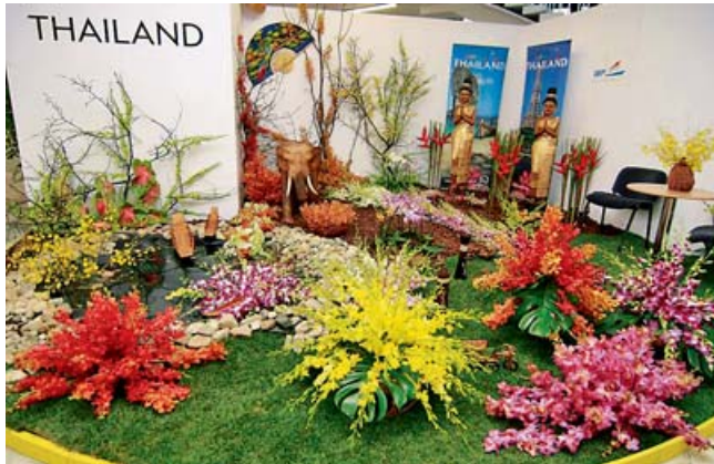
Krása jarních květin upoutá svou vůní a barevností.

Se samostatnou expozicí se na Floře představí členové Svazu květinářů a floristů ČR či zahradnictví města Vídně. Květinovou nabídku obohatí i speciální přehlídka orchidejí Thajského království, expozice holandských cibulovin a další květiny i okrasné dřeviny. „Galerie pavilonu A bude patřit účastníkům soutěže v aranžování květin, letos na inspirativní téma svatební vazby,“ konstatovala Studená. Lidé si zde mimo jiné mohou prohlédnout expozici s názvem Vzpomínka na čín-