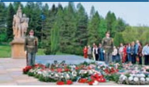
Pietní vzpomínka na oběti nacistických zločinů.