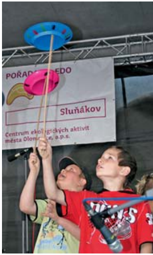
Doprovodný program EDO zaujme děti i dospělé.

Vyvrcholením festivalu bude prvomájový Ekojarmark. Rodiče i děti mají tak možnost do-