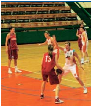
Vysokoškolačky vstoupily do sezony v roli nováčků.