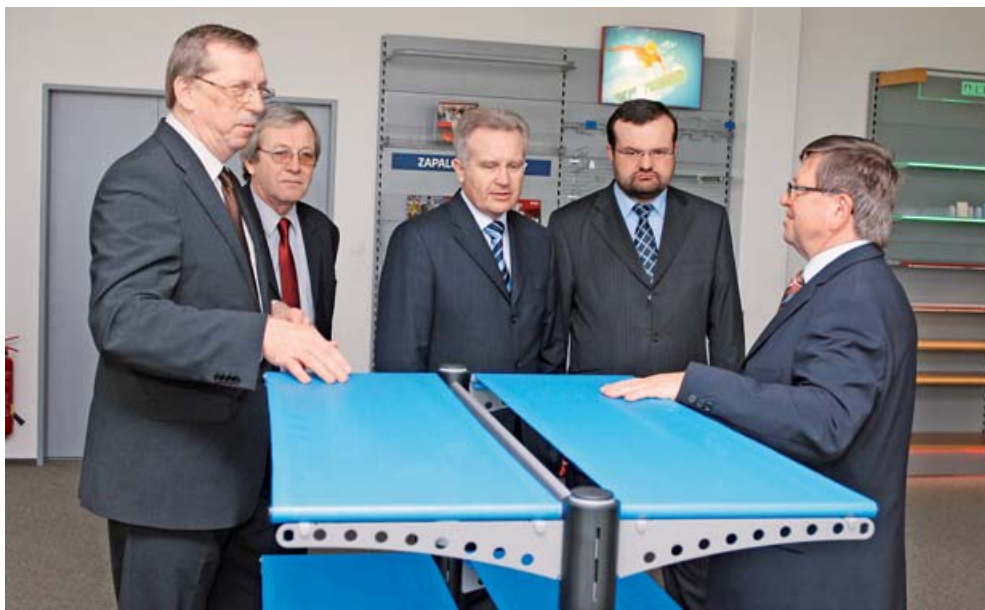
Krajská rada během své cesty na Zábřežsko zavítala také do firmy MBG, která se zabývá výrobou vybavení prodejen.