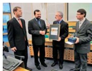
Hranice si prvenství odnesly také v krajském kole soutěže.

Olomoucký kraj • Nejlepší městské webové stránky v celé České republice mají Hranice. Rozhodla o tom komise celostátní soutěže Zlatý erb. Hranická delegace přijala ocenění za prvenství na slavnostním ceremoniálu, který se uskutečnil 12. dubna v Hradci Králové. Hranice přitom získaly prvenství rovněž v krajském kole, jehož výsledky byly vyhlášeny 22. března v sídle Olomouckého kraje. Vítězství v sedmém ročníku krajského kola soutěže Zlatý erb hodnotí webové stránky a elektronické služby za obce obdržela Libina. Nejlepší elektronickou službou porota vyhlásila koncept územního plánu zveřejněný na webu města Šumperka. Cenu veřejnosti, o níž rozhodují svým hlasováním samotní občané, získal městyš Náměšť na Hané. Ocenění starostům Olomouckého kraje předal náměstek hejtmána Pavel Horák. „Jsem moc rád, že úroveň webů jde stále nahoru a občané dostávají lepší služby, kterých mohou využívat přímo z pohodlí svého domova,“ konstatoval náměstek Horák. Letošního ročníku krajského kola Zlatého erbu se zúčastnilo osm měst a jedenáct obcí. Cílem soutěže internetových stránek měst a obcí je podpořit modernizaci místní a regionální veřejné správy prostřednictvím rozvoje informačních služeb. | 111