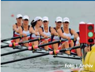
Veslařky se probíjaly do finále