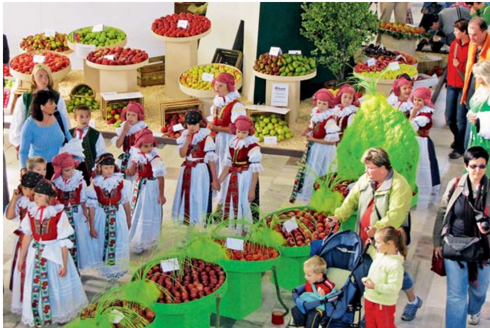
Podzimní Flora nabídne radovánky na Selském dvoře.

Olomouc • Podzimní zahradnická výstava Flora Olomouc 2010 proběhne od 7. do 10. října na výstavišti Flora. Návštěvníky čeká nejen bohatá přehlídka ovoce, zeleniny a podzimních květin, ale také gastronomické pochoutky, dobré víno a burčák.