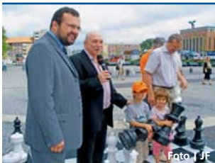
Olomouc ovládl šachový festival.