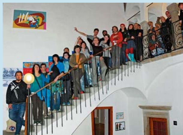
Skupina spojuje umělce z celé republiky.