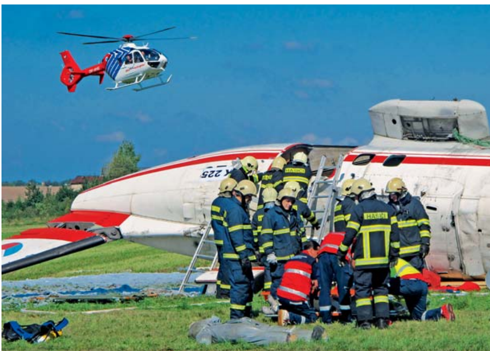
U simulované letecké nehody zasahovali hasiči, záchranáři i policisté.