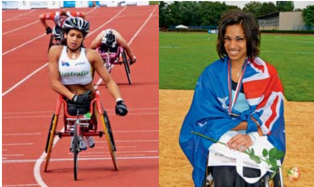
Vozíčkáři se utkali na Haně.