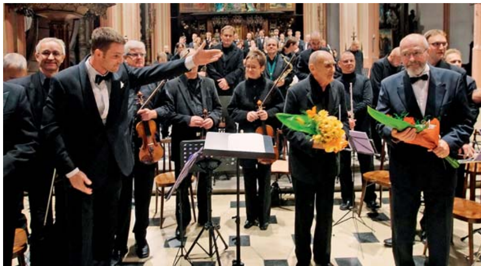
Festival duchovní hudby je vnímán jako významná událost uměleckého i duchovního charakteru.

Olomouc • Sedmnáctý ročník Podzimního festivalu duchovní hudby (PFDH) proběhne v hanácké metropoli od 25. září do 23. října. Veřejnost se může těšit na přední česká i středoevropská orchestrální tělesa, vynikající pěvce a sbory, znamenité interprety a dirigenty ze všech koutů Evropy.