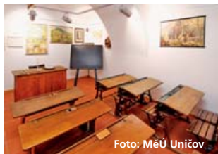
Městská galerie představuje historické školní třídy.