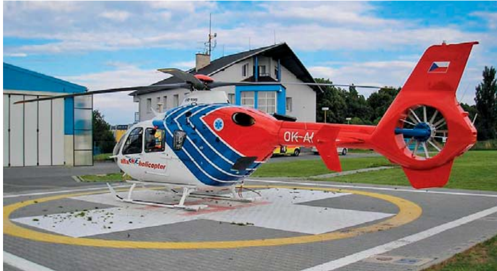
Strojový park prošel obrovskou modernizací.

Olomouc • Úsilím tehdejšího vedení okresu Olomouc, Okresního ústavu národního zdraví, města Olomouce a řady dalších zúčastněných se podařilo využít nabídky ministerstva zdravotnictví a České pojišťovny, která tehdy provoz letecké záchranné služby financovala, a v krátké době vybudovat zázemí pro provoz letecké záchranné služby v Olomouci. Heliport se zázemím pro techniku a posádky se nacházel v Olomouci, na Hněvotínské ulici, v areálu po Sovětské armádě v blízkosti fakultní nemocnice uprostřed obytné zástavby. V samotných počátcích jsme využívali vrtulníky polské výroby Mi-2 a provozovatelem těchto strojů byl státní podnik Slovair. Od roku 1992 se stala provozovatelem vrtulníků firma Alfa Helicopter, která v Olomouci létá až do dnešních dnů. Postupně jsme modernizovali