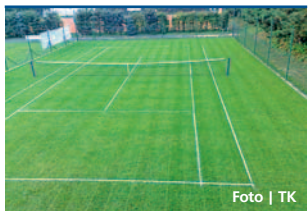
Hráči mohou díky novému hřišti zažívat pocity šampionů.