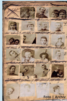
Dny židovské kultury zprostředkovaly tvorbu i osudy židovských osobností regionu.