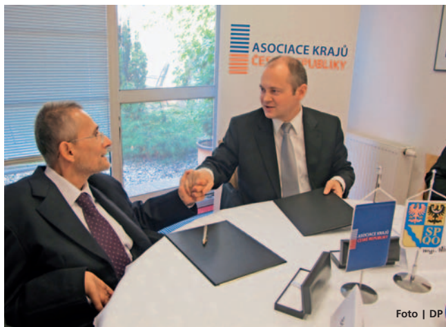
Michal Hašek a Václav Krása podepsali v Olomouci memorandum.

Olomouc • Memorandum o spolupráci podepsal v metropoli Hané jihomoravský hejtmán a předseda Asociace krajů ČR Michal Hašek a předseda Národní rady osob se zdravotním postižením Václav Krása. Asociace v Olomouci jednala také o platech či o dopravní problematice. Podle Haška chce vláda investovat do sociálních služeb částku 6,1 miliardy korun, přičemž reálná potřeba je 6,8 miliardy. „Chceme dorovnat těch 700 miliónů korun,“ vysvětlil Hašek. Stejněho mínění byl Krása. „Existují oprávněné obavy z důsledku škrtů, propad prostředků v oblasti sociálních služeb by byl v realu ještě vyšší než avizovaných 700 miliónů. To by se neblaze projevilo v oblasti péče,“ doplnil Krása. Hašek dále konstatoval, že finanční prostředky na platy v příštím roce by měly zůstat stejné jako letos. „Nevidím dů-