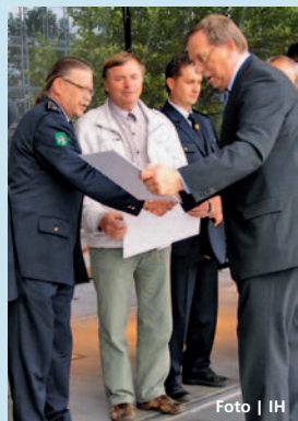
Kraj dobrovolné hasiče dlouhodobě podporuje.