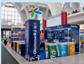
Olomoucký kraj na veletrhu zaujal.

Brno • Představit Olomoucký kraj jako centrum inovací byl hlavní úkol letošní účasti Olomouckého kraje na veletrhu Urbis Invest. Mezinárodní prezentace investic, financí, realit a technologií pro město a obce proběhla v polovině září na brněnském výstavišti. Tradiční akce se tentokrát konala v rámci Mezinárodních strojírenských veletrhů. Díky tomuto opatření se o existenci veletrhu dozvěděl širší okruh odborných návštěvníků a potenciálních investorů. Návštěvníky zaujala zejména vizualizace vysokoškolského kampusu s inovačním centrem, který má stát na třídě Kosmonautů a svým velkorysým stavebním řešením vytvořit novou dominantu Olomouce. Bohatou nabídku investičních příležitostí připravili také tradiční spoluvystavovatelé Olomouckého kraje, města Olomouc, Přerov, Šternberk, Zábřeh a Litovel. S mimořádným zájmem se setkal no-