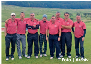
Muži Golf Clubu Olomouc vybojovali extraligu.