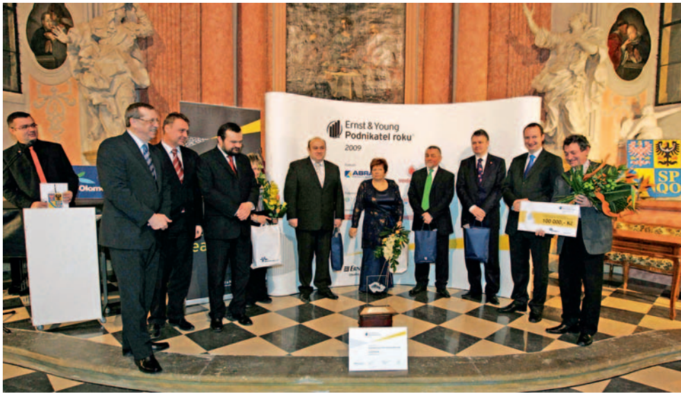
Kraj vyhlásil soutěž o titul páteho podnikatele roku Olomouckého kraje.

Olomouc • Živnostníci z regionu se mohou ucházet o titul Podnikatel roku Olomouckého kraje. Pátý ročník regionálního kola soutěže pořádá Olomoucký kraj ve spolupráci s firmou Ernst & Young. Vítězem se může stát výrazná osobnost, která svým úsilím, podnikatelským nápadem a poctivou prací má být vzorem pro ostatní.