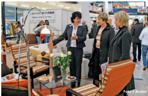
Zájemci se mohou na výstavě nechat inspirovat dobrými nápady.

Olomouc • Výstava nábytku, interiérového vybavení, doplňků a životního stylu Bydlení 2010 proběhne na olomouckém výstavišti Flora ve dnech 22.–24. října. Letošní ročník oblíbené prodejní akce přinese pod mottem „Vícegenerační bydlení“ především pestrou nabídku zařízení bytů, kuchyňských sestav, vybavení ložnic, dětských i obývacích pokojů, zahradního ná-