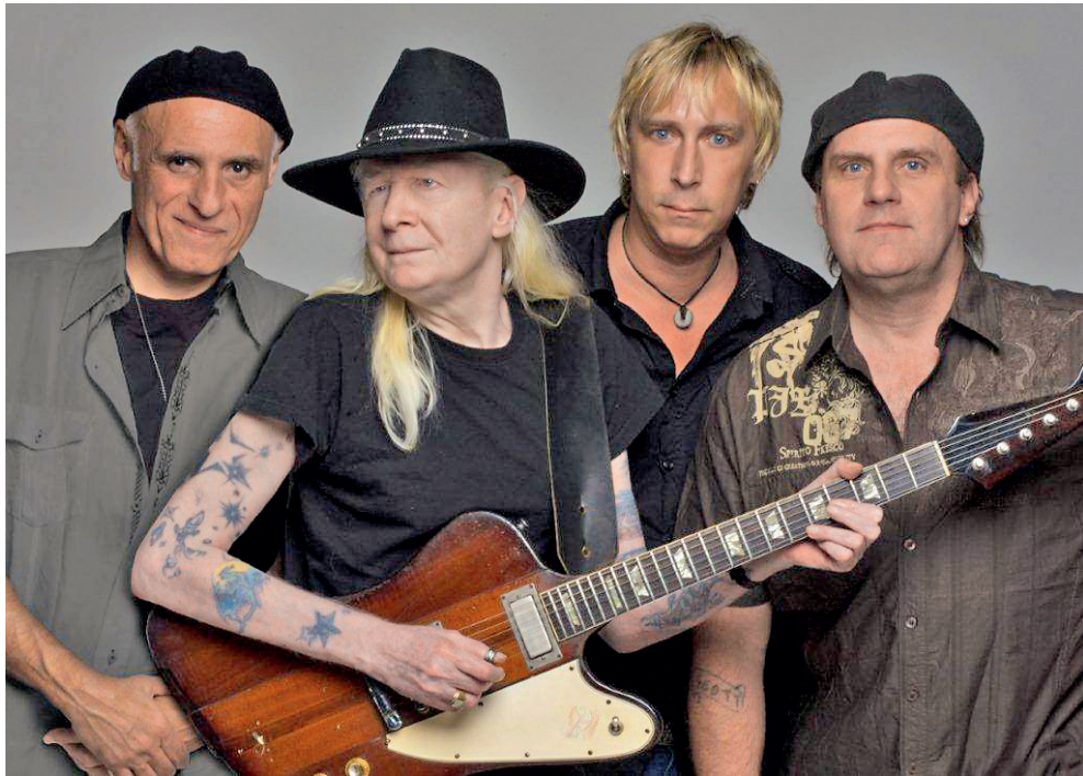
Největší hvězdou festivalu bude Johnny Winter.