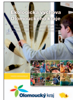
Publikace je určena pro školy a školská zařízení.

Olomouc • Železniční muzeum by mohlo vzniknout v zanadrazním prostoru v Olomouci. O evropské peníze na jeho zřízení chce žádat Olomoucký kraj a nadace Okřídlené kolo. Smyslem akce je přilákat do města více turistů a zvýšit cestovní ruch. | DP