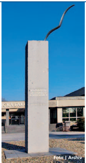
Památník bojovníkům za svobodu a demokracii

Olomouc • Bohumil Teplý vystavuje své sochy, medaile a drobné plastiky od 12. října do 5. listopadu v prostoru pro umělecké výstavy neobvyklém, a to v 6. patře nové budovy Přírodovědecké fakulty UP v Olomouci na třídě 17. listopadu. S tímto místem ho spojují hned dvě autorství. První je Památník bojovníkům za svobodu a demokracii – pět a půl metru vysoký žulový obelisk s kovovou vlnovkou ptačích křídel na vrcholu, nacházející se před právnickou fakultou. Druhou je spoluautorství na tvorbě insignií přírodovědecké fakulty.