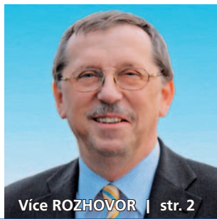
Více ROZHOVOR | str. 2

Hejtmán poděkoval lidem za pomoc při letošních povodních