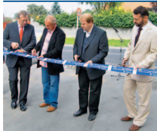
Obyvatelé Troubek mají novou vozovku a chodníky.