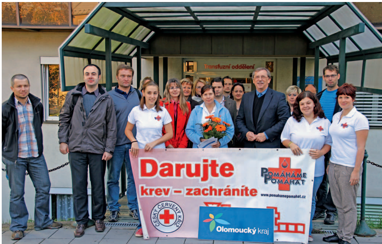
Úředníci vyslyšeli výzvu hejtmána a šli darovat krev.