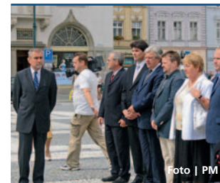
Pietní vzpomínka u příležitosti Kravé neděle, kdy byli zastřeleni tři občané, proběhla závěrem srpna v Prostějově.

Olomouc • V minulých dnech vyšla publikace Ekologická výchova Olomouckého kraje obsahující přehled ekologických výukových programů, seminářů, publikací, pomůcek a akcí. Materiál určený pro školy a školská zařízení vydal Olomoucký kraj. V úvodní části publikace jsou uvedeny přehledné popisy dvaceti pěti organizací spolu s jejich aktivitami, které se na poli environmentálního vzdělávání, výchovy a osvěty realizují. Součástí materiálu jsou také kontaktní údaje pro objednávku nabízených služeb. Další část brožury je rozdělena na čtyři základní části podle předmětu nabídky. Brožura Ekologická výchova Olomouckého kraje ve školním roce 2010/2011 bude distribuována na všechny školy a školská zařízení v Olomouckém kraji na začátku výše uvedeného školního roku. | IH