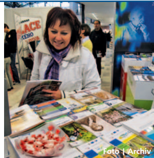
Města v kraji představí návštěvníkům své projekty.

poklesl proti loňsku jen z 30 631 včelstva na 30 201 včelstvo. Z těchto čísel vyplývá, že pokles není způsoben jen morem včelího plodu. KVSO zdůrazňuje, že chovatelé nesmí léčit včelstva s příznaky moru včelího plodu ani preventivně používat med, pyl, plásty a vosk pocházející z oblastí s neznámou nákazovou situací pro krmení a chov včel a divoce žijící včelstva. Včelí roje neznámého původu také nesmí umísťovat do chovatelských včelařských zařízení k jiným účelům než k jejich okamžitému utracení. IDZ