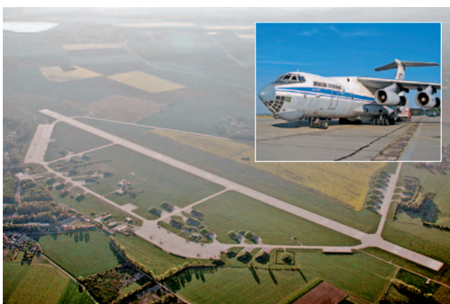
Neveřejné mezinárodní letiště se smíšeným provozem.

„Společnost Regionální letiště Přerov (RLP), kterou založily v roce 2008 Olomoucký a Zlínský kraj a město Přerov, získala počátkem listopadu od Úřadu pro civilní letectví licenci pro provozování civilní části letiště v Bochoři,“ konstatoval náměstek hejtmána Ivan Kosatík (ODS). Kromě 23. základny vrtulníkového letectva, které zde sídlí, mohou tedy letiště využívat i letadla se vzletem do 1,2 kilometru a rozpětím křídla do 24 metrů, tedy v letecké terminologii letadla do kategorie 2B. „Jedná se o drobnější dopravní, sportovní letadla pro pár lidí jako jsou například cesny nebo