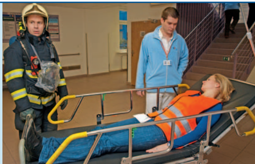
Cvičení si vyžádalo rozsáhlou evakuaci.

ých cen,“ uvádí informační materiál sdružení. Odběratelé navíc budou vědět, že produkty pocházejí od místních farmářů, byly sklizeny až po skutečném dozrání a netrpěly dlouhou a složitou dopravou, což je častý problém ovoce a zeleniny v supermarketech. Bedýnky budou nabízeny ve dvou velikostech o hmotnosti dvou a pěti kilogramů. V každé bedýnce bude navíc originální recept vycházející z dodaných surovin. Do systému Bedol.cz je možné se zaregistrovat již v současné době, první rozvoz bedýnek proběhne ve čtvrtek 6. ledna. Bližší informace o systému je možné získat na webové adrese www.bedol.cz , případně na e-mailu info@bedol.cz . | TH