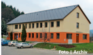
Nová administrativní budova.