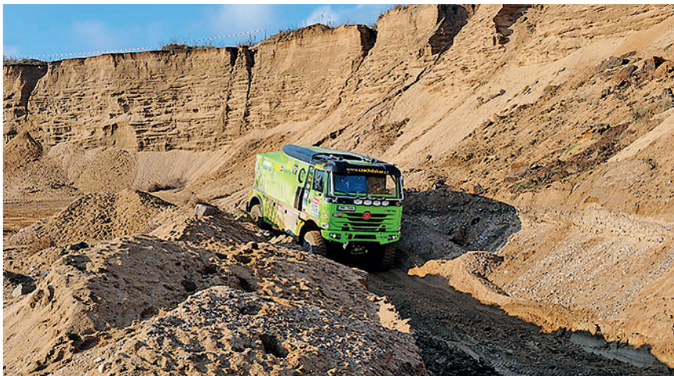
Czech Dakar Team na Dakar vysílá dvě závodní tatro.