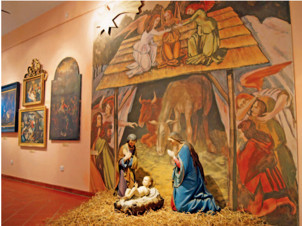
Šumperská expozice nabízí příběh Vánoc.