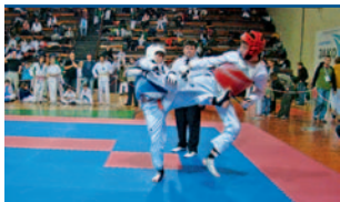
Škorpioni soutěžili v Praze a v Košicích. Foto | EH

Tam narazil na obhájce mistrovského titulu Sy Sadivova. Přerovský borec byl hned v prvním kole dvakrát počítán. Český reprezentant se sice snažil, ale do finále nepostoupil. | MH