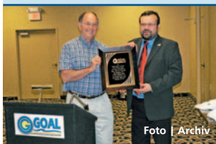
Zástupci Olomouckého kraje navštívili partnerský region.

Olomouc • Vánoční trhy odstartují na olomouckém výstavišti Flora od 11. do 21. prosince. Kromě nakupování dárků zde mohou návštěvníci zhlédnout výstavu betlémů, 11. a 12. prosince jsou připraveny vánoční zabíjačkové hody a v neděli 12. prosince i pohádky pro nejmenší. V tento den přijde na Floru také čert a Mikuláš. Na trzích nebudou chybět ani ukázky zdobení staročeského perníku, malování vánočních baněk či klání šermířů. Více na www.flora-ol.cz | DP