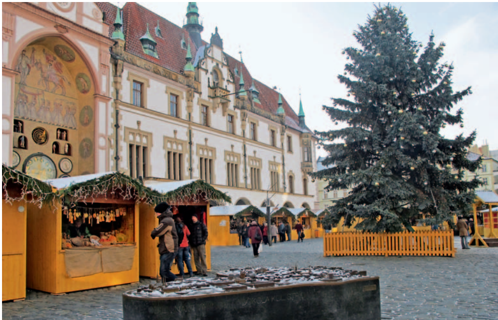
Centrum Olomouce ožilo vánočním jarmarkem.

Olomouc • Vánoční trhy v metropoli Hané nabízí lidem řadu koncertů a pohádek, příležitost nakoupit dárky nebo si popovídat s přáteli nad punčem. Na obou olomouckých náměstích je celkem 82 stánků s vánočními výrobky, občerstvením, potra-