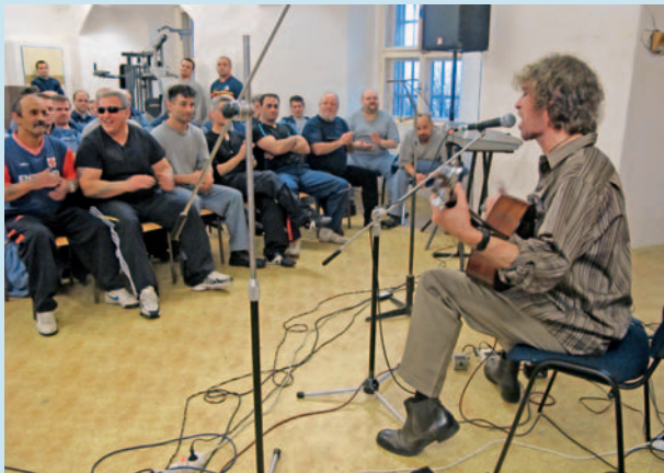
Kulturní místnost věznice Mírov rozezněly tóny blues.