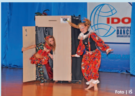
Tanečníci z M-plusu si skvěle poradili s konkurencí.