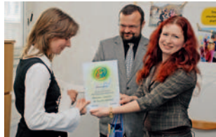
Ocenění získala i Advokátní kancelář Kovaříková.